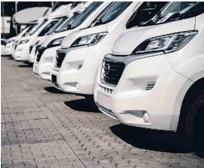
Wohnwagen sind aktuell sehr beliebt.