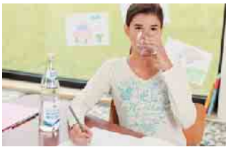
Regelmäßiges Trinken steigert die Konzentration.

Trinkgewohnheiten sind effektive Maßnahmen, um Schülerinnen und Schüler daran zu erinnern, regelmäßig zu trinken. In der Schule können Kinder und Jugendliche eine Trinkroutine entwickeln, von der sie ein Leben lang profitieren.“ Um Lehrkräfte bei der Vermittlung des Themas zu unterstützen, bietet die Informationszentrale Deutsches Mineralwasser (IDM) verschiedene kostenfreie Medien an. (akz-o)