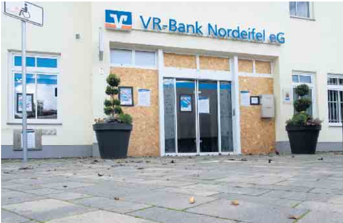
Mit Holzplatten wurden die zerstörten Scheiben provisorisch ersetzt. Mit einem Juwelergitter hinter der automatischen Schiebetür soll während der jetzt anstehenden Sanierung eine zusätzliche Sicherung eingebaut werden.