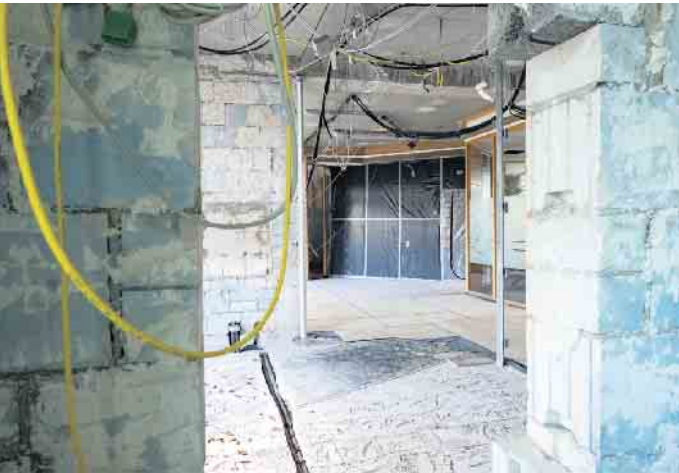
In diese Lücke kommt wieder ein Geldautomat: Denn die Dahlemer VR-Bank Filiale wird nach der erfolglosen Sprengung im Juni nun saniert.