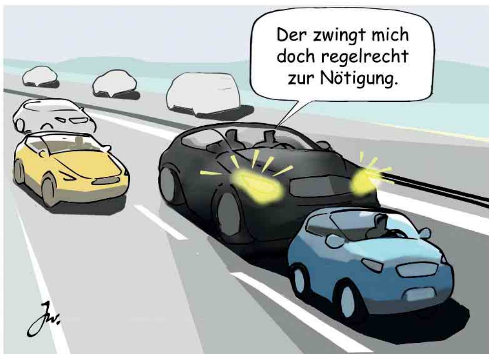
Falsche Reaktion auf Drängler: Demonstratives Langsamfahren auf dem linken Fahrstreifen trägt zur Eskalation bei.

Wer es mit solch einem Drängler zu tun hat, kann dabei schnell selbst in Hektik oder in Wut geraten. Beides ist die denkbar schlechteste Reaktion. Stattdessen muss die Devise lauten: Immer ruhig bleiben. Denn Ärger oder Wut haben auf der Autobahn, aber auch im Straßenverkehr generell nichts zu suchen, weil diese Emotionen zu den falschen Aktionen und Reaktionen verleiten.