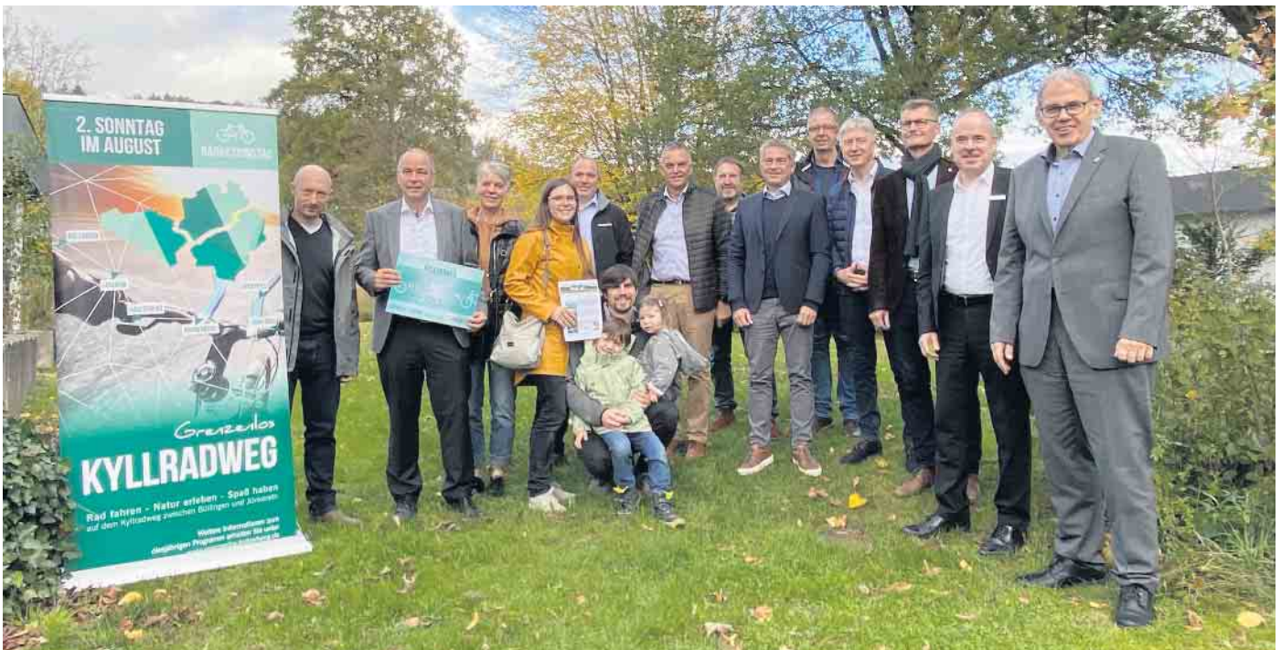
Zur Preisübergabe trafen sich Veranstalter, Organisatoren und Gewinner jetzt in Jünkerath.

auf eigene Faust Fachräume, Klassenräume und Fachpräsentationen anschauen. Sowohl für die Grund- als auch für die angehenden Oberstufenschüler:innen sowie deren interessierte Begleiter werden auch dann vielfältige Informationsmöglichkeiten geboten. Im Eltern-für-Eltern-Kaffee bietet sich die Gelegenheit, auch mit „erfahrenen“ Müttern und Vätern ins Gespräch zu kommen. Ganz gleich, ob man sich im September schon vom JSG einen Eindruck verschafft hat oder nicht, die Schulgemeinschaft des Johannes-Sturm-Gymnasiums freut sich gleichermaßen darauf, bekannte aber auch viele neue Gesichter begrüßen zu können.