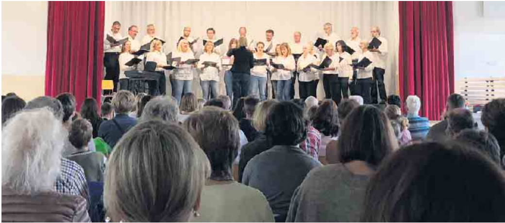
Die Kleine Cantorei vor einem voll besetzten Vereinshaus