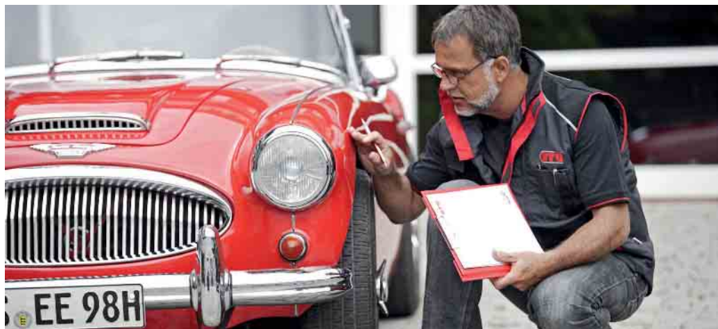
Vor der Erteilung eines H-Kennzeichens muss erst ein Ingenieur das Auto überprüfen und die Originalität beurteilen.

Vor der Erteilung eines H-Kennzeichens muss erst ein Ingenieur von Dekra, TÜV, GTÜ oder KÜS das Auto überprüfen und die Originalität beurteilen. Daraus ergibt