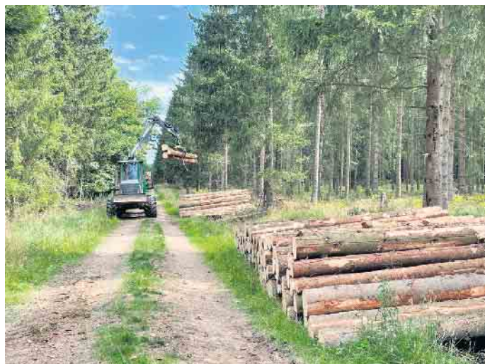
Die Holzernte lohnt sich wieder im Gemeindewald.

metern, vorwiegend Fichte, kann in 2023 voraussichtlich zu guten Preisen an den Markt gebracht werden. Das führt nach Abzug der Betriebsausgaben zu einem Betriebsergebnis von rund 625.000€ im Gemeindehaushalt. Diese positive Situation erhoffen die Experten auch für die kommenden Jahre, damit die schlechten Ergebnisse der letzten Jahre ausgeglichen werden können. Eine weitere Aufgabe des Forstbetriebes ist auch im kommenden Jahr die Beseitigung der Hochwasserschäden bei den Forstwegen. Rund 400.000€ sind hierfür vorgesehen, die aus dem Wiederaufbauplan der Gemeinde durch das Land NRW gefördert werden. Insgesamt können der Forstausschuss unter Vorsitz von Hans-Josef Bohnen, der Gemeindeförster