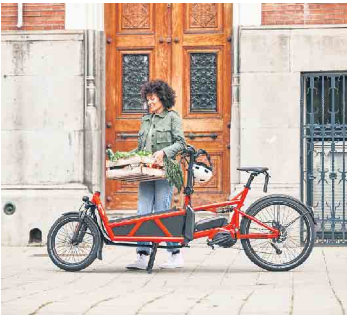
Lastenräder gehören in vielen Städten zum Alltagsbild. Mit elektrischer Unterstützung ermöglichen E-Cargobikes den bequemen Transport zum Beispiel von Wocheneinkäufen.