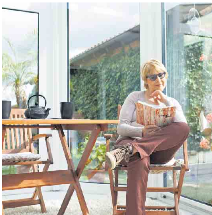
Der Lieblingsplatz ist immer da, wo das meiste Licht ist. Das ist einer der wichtigsten Gründe für die Beliebtheit eines Wintergartens.

Zunächst wird das zum Einsatz kommende Profilsystem getestet. Danach folgen Zertifizierungen für die Bereiche Planung, Fertigung und für die Montage vor Ort. Für die Bereiche Planung und Montage müssen Fachseminare besucht und nach spätestens fünf Jahren wiederholt werden. www.bundesverband-wintergarten.de . (DJD)