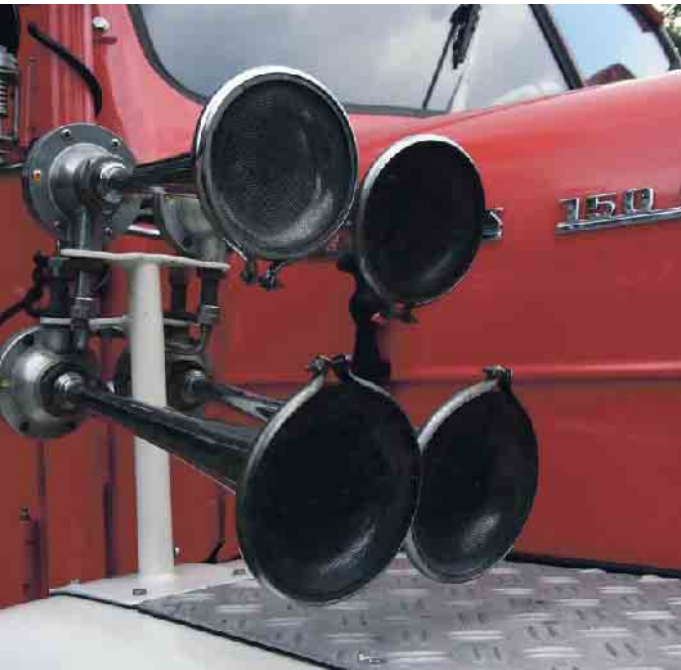
In Deutschland sind kreative Installationen von Schallerzeugern am Privatfahrzeug verboten.

hinzuweisen. Wer unerlaubt ein Schallzeichen abgibt, muss mit einem Bußgeld in Höhe von fünf Euro rechnen, werden zusätzlich andere dadurch belästigt, sind zehn Euro fällig. Fühlt sich jemand durch das Hupen genötigt, kann der oder die Belästigte eine Anzeige stellen. Wer zu oft wegen unsachgemäßen Hupens ein Bußgeld kassiert, kann zur Medizinisch-Psychologischen-Untersuchung (MPU) geschickt werden. Die Lieblingsmannschaft gewinnt den Pokal oder der Neffe hat gerade geheiratet? Autokorsos mit wiederholtem Hupen sind rechtlich Lärmbelästigung und damit ebenfalls nicht erlaubt, oft wird aber ein Auge zugeknippt. Wer es übertreibt, kann dennoch ein Bußgeld erhalten. Übrigens: Auch ein unerlaubtes oder mangelhaftes Schallzeichen, wie eine Melodie als Hupsignal, kann ein Bußgeld in Höhe von 15 Euro nach sich ziehen. Die Hupe muss ein akustisches Signal mit gleichbleibender Grundfrequenz erzeugen. Ausgenommen von dieser Regel sind Fahrzeuge mit Blaulicht, wie Polizei- und Rettungswagen und Feuerwehrautos. (mid/ak-o)