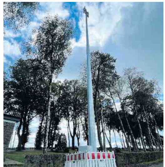
Die neue Mastsirene am Friedhof Dahlem.

tag mit Probealarm der Sirenen im März und September jeden Jahres. Der Heulton für die Warnung ist 1 Minute auf und abschwellend, die Entwarnung mit 1 Minute Dauerton. Damit verbunden ist die Aufforderung, den lokalen Hörfunksender einzuschalten und auf Durchsagen zu achten.