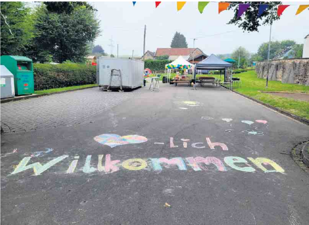
Kinderfest in Baasem.

Das Baasemer Kinderfest wird besonders den Kindern als ein Tag der Gemeinschaft und des Abenteuers in Erinnerung bleiben und hoffentlich der Auftakt für weitere Feste dieser Art sein!