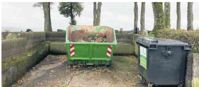
Die Abfallcontainer an den Friedhöfen sind ausdrücklich nur für den dortigen Abfall gedacht.

sorgungssystem gibt. Grünabfälle können auch in kleinen Mengen zum Grünabfall-Sammelplatz gebracht werden. Bereits in der Vergangenheit wurden Personen bei der Abfallentsorgung an den Friedhöfen beobachtet und angeschrieben. Daher appelliert die Gemeindeverwaltung diese unzulässige Abfallentsorgung zu unterlassen!