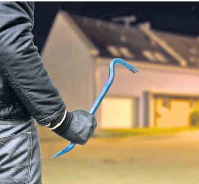
Einbrecher sind wieder verstärkt auf Beutezug. Massive Außenwände aus Leichtbeton können die Sicherheit erhöhen.

so Andreas Krechting. Unter www.klb-klimaleichtblock.de oder per Telefon (02632-25770) gibt es mehr Informationen zum Einbruchschutz mit Leichtbeton. (DJD)