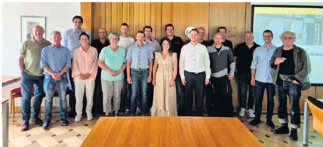
Teilnehmer des ersten Akteurstreffen zur Wärmeplanung in der Gemeinde Dahlem.

Die erste öffentliche Akteursveranstaltung wurde am 02.09.2024 erfolgreich durchgeführt. An dieser Veranstaltung haben Akteure aus verschiedenen Bereichen, wie Energieversorger, Heizungsinstallateure, Mitglieder des Gemeinderats und lokale Unternehmen, teilgenommen. Im Rahmen des Workshops wurden das Projekt sowie dessen Ziele vorgestellt. Ebenfalls wurden erste Ergebnisse der Bestands- und Potenzialanalyse präsentiert und diskutiert. Zudem gab es Raum für einen intensiven Austausch über mögliche Herausforderungen und Chancen. Im Rahmen eines ge-