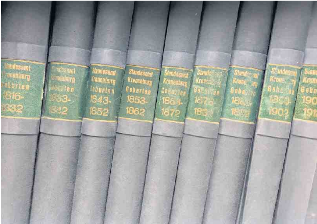
Ein Blick auf die Standesamtsbücher der Gemeinde Dahlem.

Zunächst einmal ist es von Vorteil, so viele Informationen wie möglich im eigenen Zuhause zusammenzutragen - die Namen und Geburtsdaten der Eltern, womöglich sogar der Großeltern, aber auch Fotografien und Informationen zum Beruf und Werdegang können hier ein guter Startpunkt sein. Sind die eigenen Möglichkeiten und Ressourcen erschöpft, hilft das Gemeindearchiv Dahlem weiter. Mithilfe der dort vorhandenen Standesamtsunterlagen können die vollständigen Namen der längst verstorbenen Ahnen sowie die Identitäten ihrer potenziellen Geschwister, Kinder, und Ehepartner sowie deren Ge-