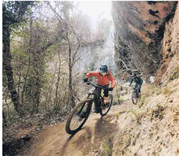
Das E-Bike ist das passende Trainingsgerät für alle, die gezielt ihre Fitness verbessern möchten.

wichtigsten Informationen zählen unter anderem Höhendaten, Leistungswerte, die Trittfrequenz und die Anzeige der verbrannten Kalorien. So sehen E-Biker, ob sie gerade über oder unter ihrer persönlichen Leistung und Trittfrequenz fahren und können auf diese Weise ihr Sportprogramm optimieren. Mit dem richtigen Training ist das E-Bike ein effektiver Fettverbrenner und Fitness-turbo. Wichtig dabei: Gerade Einsteiger sollten sich realistische Ziele setzen und sich zu Beginn nicht überfordern. Zudem sollten sich auch Sport-Enthusiasten zwischen jeder intensiven Einheit ein bis zwei Ruhetage zur Regeneration gönnen. Ein weiterer Tipp: E-Biken in der Gruppe macht noch mehr Spaß und fördert erfahrungsgemäß die persönliche Motivation. (DJD)