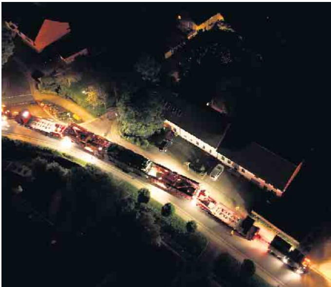
Der Trafo-Schwertransport fährt in Dahlem ein.