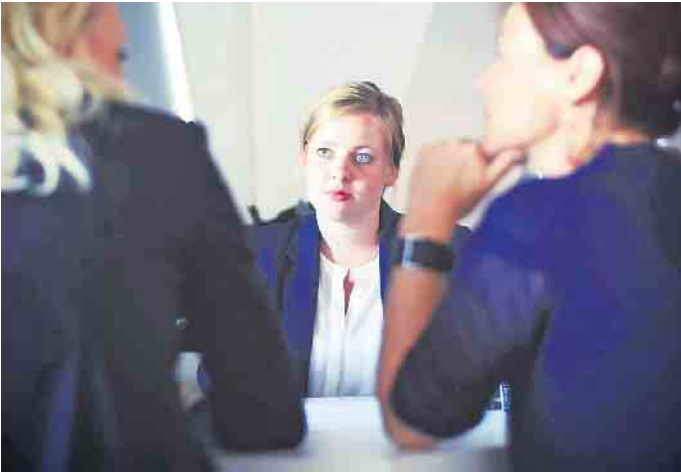
Mit gezielten Fragen können Bewerber im Vorstellungsgespräch ihr Interesse an einem Job untermauern.

So können Bewerber im Vorstellungsgespräch punkten