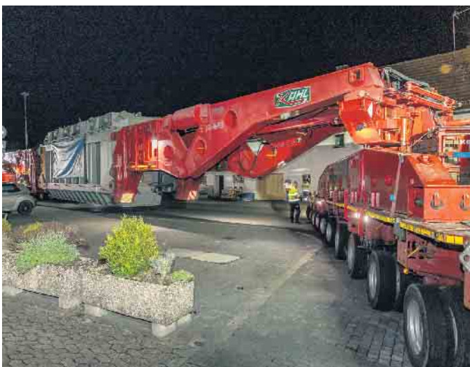
Die Einfahrt in die „Ursprungstraße“ war die letzte Hürde auf dem Weg zum Umspannwerk Dahlem.