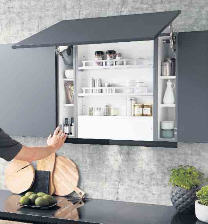
Die wichtigsten Gewürze unmittelbar griffbereit zum Kochen - beispielsweise anhand eines Gewürzregals und Abstellmöglichkeiten direkt über dem Kochfeld. Die Einbauhaube im Oberschrank lässt dafür noch Platz.

Innenorganisationssysteme in edlem Echtholz, Holzdekor, Metall oder Kunststoff. Ob als kompletter Besteckeinsatz mit fest vorgegebenen Einteilungen oder mit flexibel organisier- und versetzbaren Ordnungselementen - darüber entscheidet der persönliche Geschmack. Das können beispielsweise unterschiedlich große, verschiebbare Holzfächer und -Boxen sein; Schubkästen mit rutschfesten Halterungen oder Steckdübeln; dehnbare Einteilungen, die sich an jedes Staugut flexibel anpassen und somit auch unterschiedlich große oder geformte Küchen- und Kochutensilien sicher und rutschfest aufbewahren. Zur Reinigung kommen