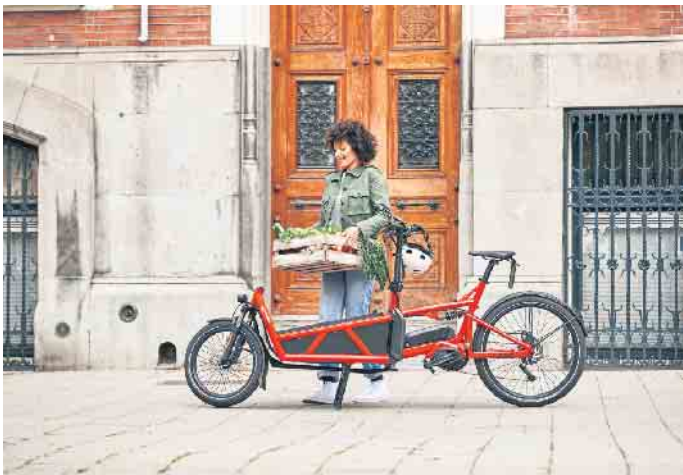
Lastenräder gehören in vielen Städten zum Alltagsbild. Mit elektrischer Unterstützung ermöglichen E-Cargobikes den bequemen Transport zum Beispiel von Wocheneinkäufen.

Lastenräder werden als nachhaltiges Transportmittel immer beliebter