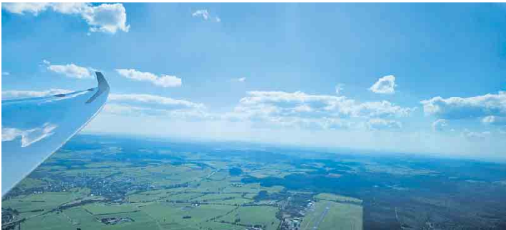
Über Gemeinde und Flugplatz Freude pur.

Nachdem die Flieger der Binz im letzten Jahr die ehrenamtlichen Mitarbeiter der Zülpicher Tafel als kleines Dankeschön für deren Einsatz zum Fliegen eingeladen hat-