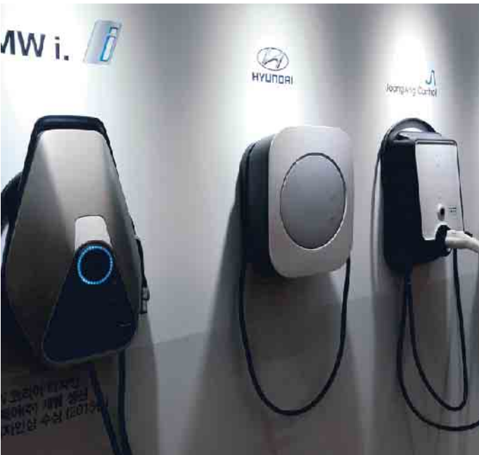
Für Autofahrer ist das Ladeangebot noch recht unübersichtlich.

Damit E-Autos für alle attraktiver werden, braucht es laut ACE aber seitens der Hersteller mehr Modellvielfalt. Vor allem Kleinwagen und preiswerte Familienautos seien jetzt gefragt, nicht Pkw aus dem Luxussegment. Auch der Ausbau der Ladeinfrastruktur müsse weiter konsequent vorangetrieben werden. E-Mobilität dürfe nicht nur für Besitzer eines Eigenheims alltagstauglich und erschwinglich sein. Insbesondere Mieter bräuchten Lösungen, um unkompliziert laden zu können. (mid/ak-o)