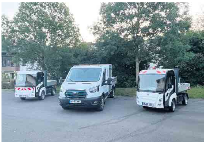
Die umweltfreundlichen E-Fahrzeuge des Bauhofs Dahlem.

Auch im Bauhof der Gemeinde Dahlem werden bereits seit einiger Zeit Elektrofahrzeuge genutzt, wo es arbeitstechnisch sinnvoll ist.