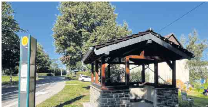
In „Ortsleistung“ bald fertiggestellt ist das neue Bushäuschen.

Vor rund zwei Jahren haben die aufwändigen Bauarbeiten an der Kreisstraße 73 in und um Dahlem-Frauenkron begonnen. In knapp zwei Jahren hat der Kreis Euskirchen die Straße zwischen der Landes- und Kreisgrenze zu Rheinland-Pfalz und der Landstraße 17 komplett saniert und außerorts verbreitert. Außerdem wurden in diesem Zusammenhang zwei Brücken über die „Lewert“ und die „Kyll“ erneuert, die Bushaltestellen barrierefrei umgebaut und die Wasser- und Kanalleitungen saniert.