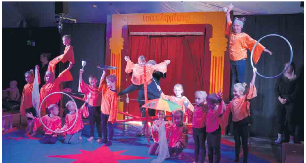
Alle Schülerinnen und Schüler waren mit Begeisterung und Einsatz Teil des Mitmachzirkus.

die letzte Vorstellung am Samstag in rekordverdächtigen 2 Stunden abgebaut und verladen.