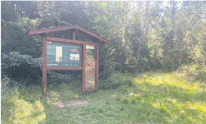
Infotafel AgrippasträÙe im Forst Schmidtheim

Am Sonntag, 1. Oktober, laden der Landschaftsverband Rheinland, die Nordeifel Tourismus GmbH und die Kommunen im Kreis Euskirchen Sie herzlich zur 16. Archäologietour Nordeifel ein. Zwischen 10 und 18 Uhr heißen wir Sie an sechs Bodendenkmälern herzlich willkommen. Fachleute aus Archäologie, Paläontologie und Geschichte geben Ihnen Einblicke in die Erdgeschichte und das Leben unserer Vorfahren. Der Eintritt ist wie immer frei. Sie können individuell anreisen und an den Führungen an den Bodendenkmälern teilnehmen. Oder melden Sie sich (untenstehend) für die Busexkursion zu allen sechs Bodendenkmälern an. Folgende Stationen stehen auf dem Programm: Nettersheim: Korallen und Co im Mauerwerk von St. Margareta in Frohngau