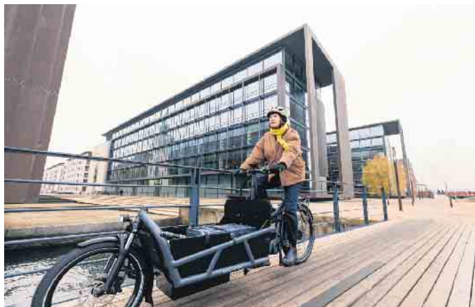
Mit dem Lastenrad lassen sich Einkäufe oder auch der Nachwuchs umweltfreundlicher und sicherer befördern.

lediglich falsche Kleidung. Diese geflügelten Worte haben beim Radfahren in Herbst und Winter besondere Bedeutung. Empfehlenswert ist stets das bewährte Zwiebelprinzip: Mehrere Schichten übereinander tragen, dabei möglichst zu atmungsaktiver und wasserdichter Kleidung greifen. Als unterste Lage ist schnell trocknende Funktionskleidung die passende Wahl, während die oberen Schichten vor Wind und Nässe