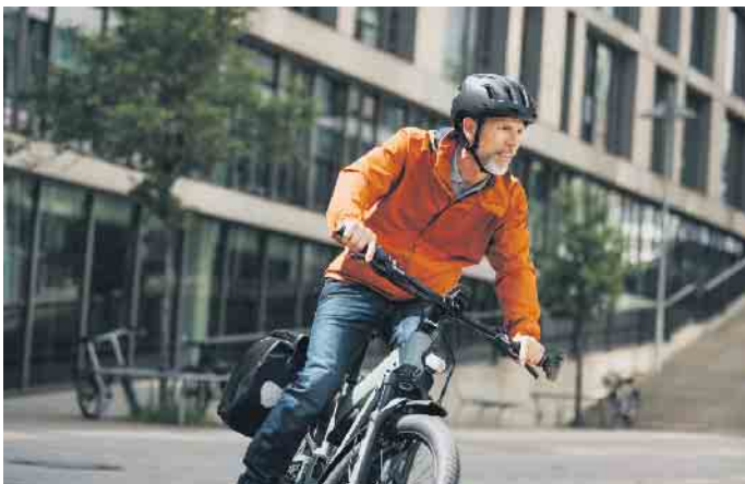
Umweltfreundlich mobil bei jedem Wetter: Viele nutzen ihr Zweirad ganzjährig.

Darauf kommt es beim Radfahren im Herbst und Winter an