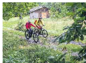
Genug Power für jede Etappe: Vernetzte Bordcomputer helfen bei der Tourenplanung und der Nutzung der Akku-Kapazitäten.

Ladefläche zwischen Lenker und Vorderrad hat man die Kids stets im Blick, beim „Long Tail“ sitzen die Kinder gut und sicher hinten auf dem Rad. Ob größere Radreise oder Auszeit vom Alltag – eine Entdeckungstour mit dem E-Bike ist immer eine gute Idee. (djd)