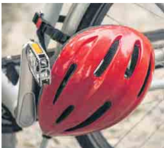
Das Tragen eines Fahrradhelms bietet Radlern den bestmöglichen Schutz.

um den Kopf ziehen. Neben der richtigen Größe ist auch der passende Sitz entscheidend. Der Helm sollte etwa 2,5 Zentimeter über den Augenbrauen sitzen. Achten Sie also darauf, dass der Helm nicht zu weit im Nacken sitzt und die Stirn ungeschützt bleibt. Die meisten Helme können zusätzlich an die Kopfgröße und -form angepasst werden. Neben der Größe bieten Helme weitere Einstellungsmöglichkeiten wie Kopf- oder Kinnriemen. Sie sollten festsitzen, aber kein beeengendes Gefühl geben. Vor allem Stirn, Schläfen und Hinterkopf sollten vom Helm gut geschützt sein. Eine Mindestanforderung ist das CE-Kennzeichen, das vom Hersteller selbst vergeben wird und angibt, dass der Helm den geltenden Anforderungen genügt. Wer sich nicht allein auf die Selbstklärung des Herstellers verlassen