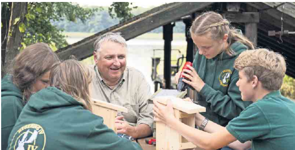
Aus unbehandeltem Holz lässt sich ein neuer Nistkasten ganz leicht selberbauen.

ten, dass der Nistkasten mindestens zwei Meter hoch hängt und das Einflugloch möglichst nach Osten oder Südosten zeigt, um vor der Witterung geschützt zu sein. Im Frühling ziehen dann neue geflügelte Mieter sicher gerne ein. (DJD).