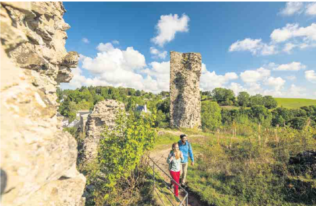
Auf der Burgruine Kronenburg.

Im Angebot www.trekking-eifel.de sind beide Übernachtungsplattformen in der Gemeinde für die Saison zwischen April und Oktober fast komplett ausgebucht. Diese Übernachtungsangebote in der freien Landschaft liegen voll im touristischen Trend.