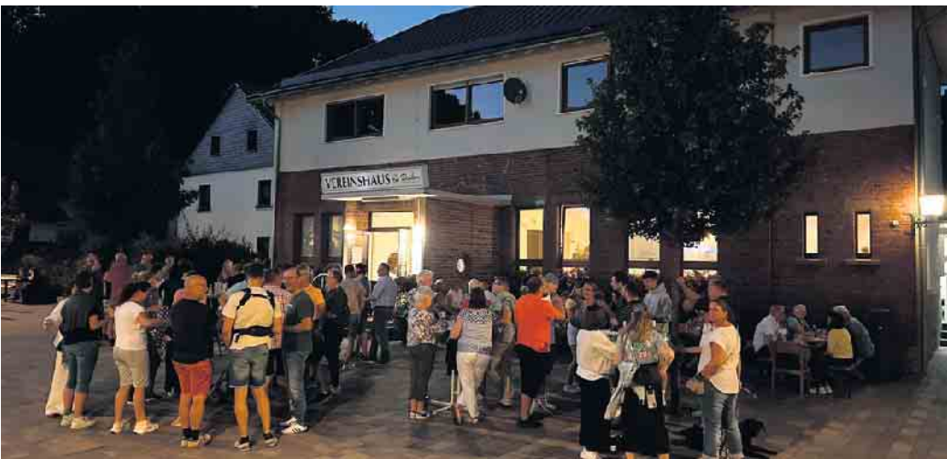
Bis in die Abendstunden konnten die Besucher auch gemütlich draußen verweilen.

Nach dem erfolgreichen Auftakt im Juli fand am 15. August der 2. Thekenabend im Trinkzimmer des Vereinshauses Dahlem großen Anklang. Rund 130 Besucherinnen und Besucher nutzten die Gelegenheit, in gemütlicher Atmosphäre bei kühlen Getränken und geselligem Beisammensein ein paar schöne Stunden miteinander zu verbringen. Die positive Resonanz zeigt, dass sich das neue Format innerhalb kürzester Zeit zu einem beliebten Treffpunkt für alle Altersklassen entwickelt hat. Auch diesesmal war der Abend geprägt von vielen guten Gesprächen, guter Stimmung und einem vollen Haus. Der Förderverein Dorfentwicklung Dahlem e. V. bedankt sich herzlich bei allen Gästen für die Unterstützung. Mit ihrer Teilnahme tragen die Besucherinnen und Besucher dazu bei, dass die The-