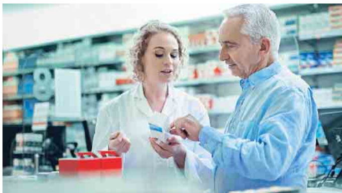
Apothekerin hilft einem älteren Kunden.