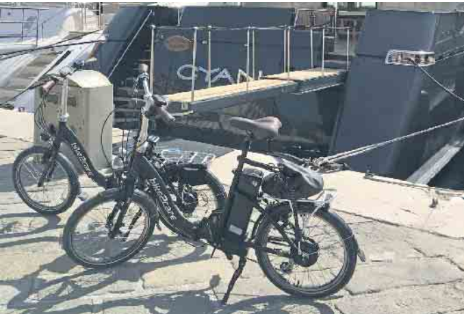
Im Urlaub sind die kompakten E-Falträder ideale Begleiter.

Sommerliche Reisesaison: Kompakte E-Falträder lassen sich überall verstauen