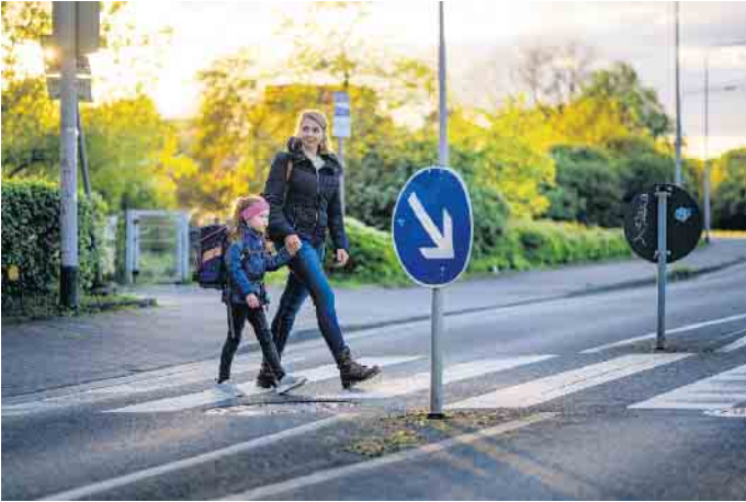
Überquerung eines Zebrastreifen.

ADAC gibt Tipps für einen sicheren Schulweg