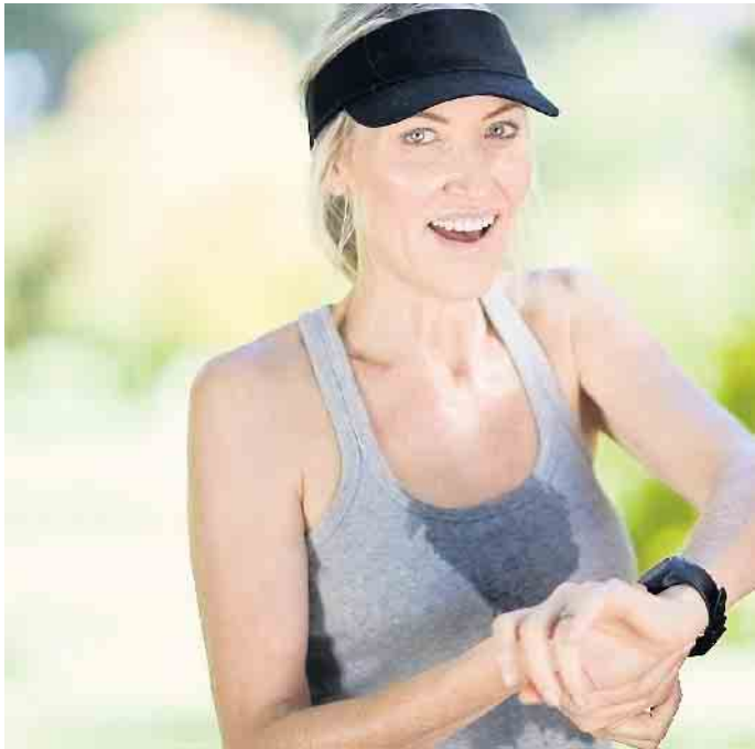
Beim Schwitzen verliert der Körper Flüssigkeit und Elektrolyte. Beides muss ersetzt werden, um Erschöpfung und Krämpfe zu vermeiden.