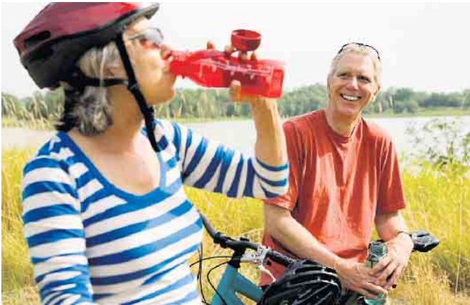
Wer im Sommer draußen aktiv ist, sollte viel trinken und darauf achten, sich bei Hitze nicht zu überlasten.

Expertentipps gegen Muskelkrämpfe bei sommerlichen Outdooraktivitäten