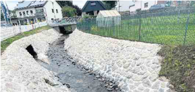
Eine aktuelle Maßnahme für Wiederaufbau und Hochwasserschutz waren Brücke und Bachlauf am Glaadtbach in Dahlem.

Neben den zahlreichen Projekten und Maßnahmen zur Entwicklung der Infrastruktur in der Gemeinde, stehen der Wiederaufbau und der Hochwasserschutz weiterhin im Vordergrund der Arbeit der Gemeindeverwaltung.