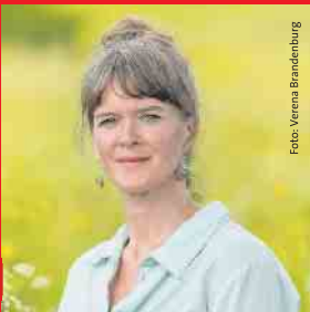
Verena Brandenburg Wahlbezirk 6: Dahlem 4