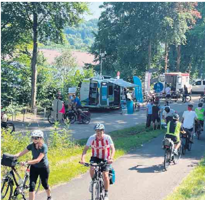
Die Abfahrt Kronenburger See wurde von vielen Radfahrern wieder zu einer Pause an der Strecke genutzt.

tungswagen viel zu fachsimpeln, zu beraten und Kleinigkeiten einzustellen. Der Kreis Euskirchen hatte mit dem Gesundheitsmobil die Vorsorge vor Hitze im Fokus. Und überall wimmelte es von Radfahrern auf dem Radweg, den Nebenstrecken und den Dörfern entlang der Strecke. Es war wieder eine gelungene Gemeinschaftsaktion der Städte und Gemeinden mit ihren touristischen Partnern von Jünkerath bis ins belgische Büllingen. https://kyllradweg.wixsite.com/grenzenloskyllradweg