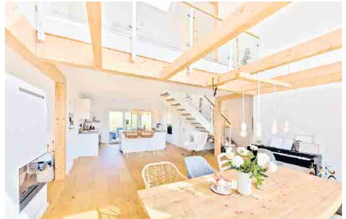
Große Glasflächen und Blickbeziehungen zwischen Küche und Essbereich schaffen hier ein helles und einladendes Raumgefühl.