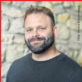
Samuel Augustin Wahlkreis 8: Schmidtheim 1