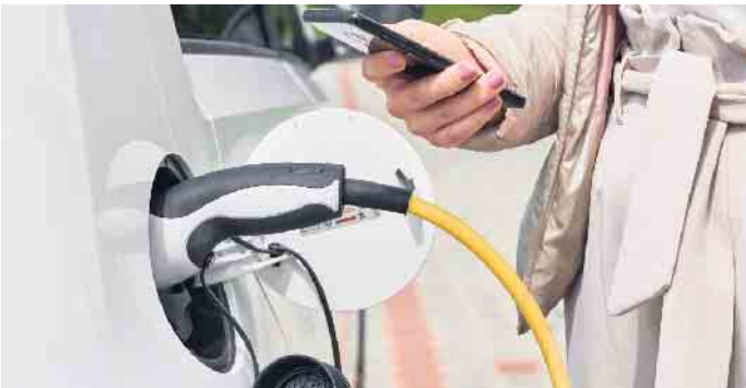
Einfach per Smartphone ein Auto buchen und elektrisch losbrausen. Carsharing-Nutzer sollten allerdings auf versteckte Kosten etwa bei einem Unfall achten.