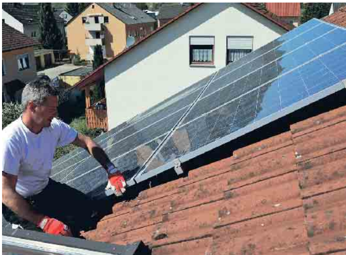
Der qualifizierte Dachdecker prüft die Befestigungen der Solarmodule und begutachtet die Unterkonstruktion im Rahmen des DachChecks.