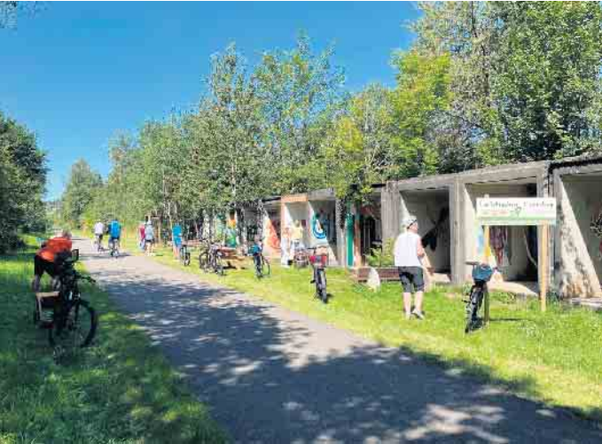
Stark besucht war die „Freilichtgalerie“ am ehemaligen Bahnhof Kronenburg direkt am Radweg.

Aktionstag: Achte Auflage lockte bei bestem Wetter zahlreiche Gäste mit buntem Unterhaltungsprogramm