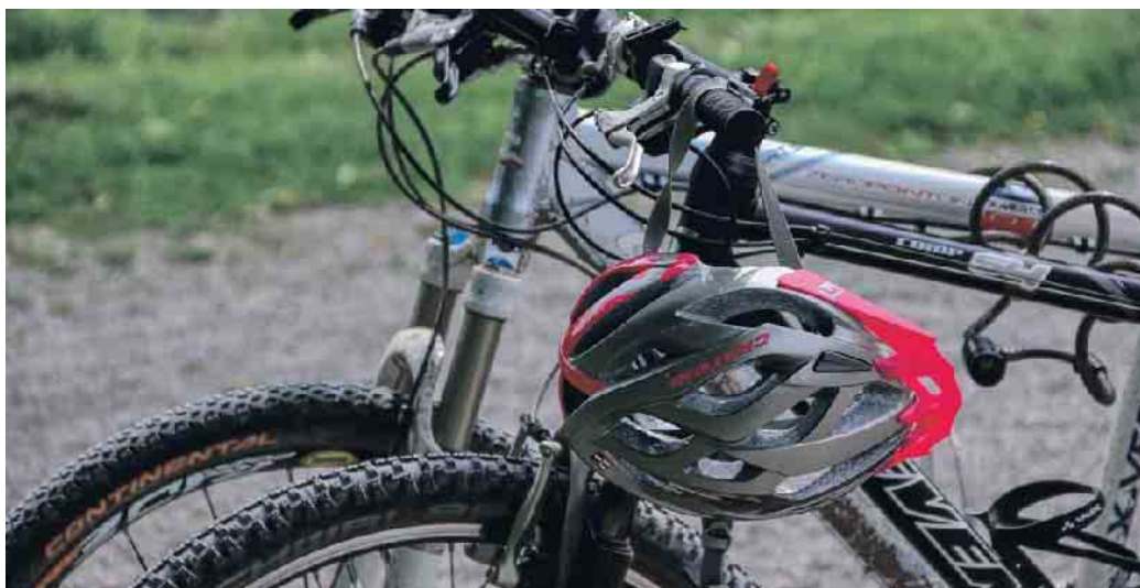
Wer sein Fahrrad auf der Anhängerkupplung seines Autos transportieren will, sollte deren Eignung überprüfen.