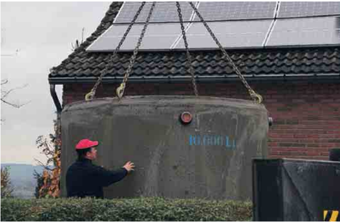
Aufgrund der immer länger anhaltenden Trockenperioden sollten die Regenwasserzisternen ausreichend groß geplant werden.

Wasseraufbereitung für Einfamilienhäuser