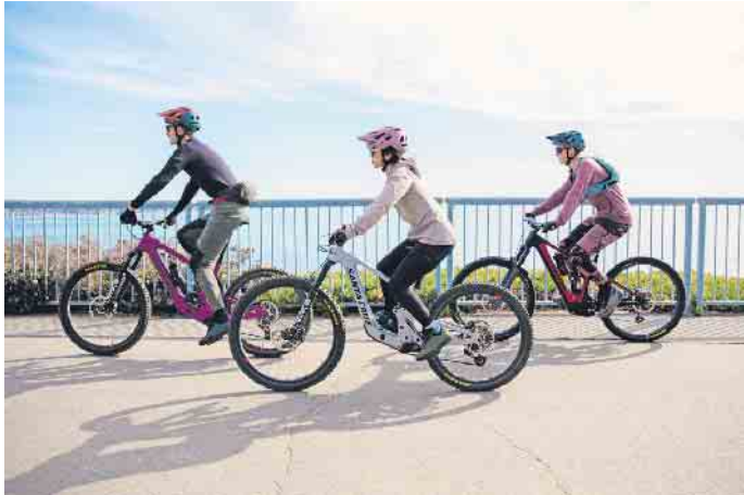
Sicher mit dem Fahrrad unterwegs: Dafür sind unter anderem die richtige Ausrüstung und eine gute Sichtbarkeit wichtig.