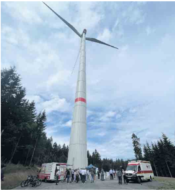
An einer der neuesten Windenergieanlagen trafen sich die beteiligten Partner zum offiziellen Projektabschluss.

In den letzten Wochen sind im Teilprojekt Windpark Dahlem V weitere 3 Windenergieanlagen im Waldeigentum der Gemeinde und der Familie Graf Beissel in Betrieb gegangen. Damit ist über 12 Jahre nach den entsprechenden Beschlüssen des Gemeinderates das gesamte geplante Windpark-Projekt mit 18