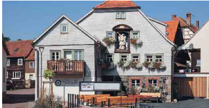
Wer die alte Mühle kannte, kommt aus dem Staunen nicht heraus.

zukunftsträchtige Handwerk ein kreativer Beruf. Da es genug Arbeit gibt, lässt sich gutes Geld verdienen. Wer körperlich fit ist und nicht nur drinnen, sondern auch draußen arbeiten will, ist hier richtig. Hervorragende Aus- und Weiterbildungsmöglichkeiten, wozu auch ein duales Studium ge-