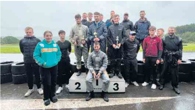
Siegerehrung der Rotax-Senior Klasse.