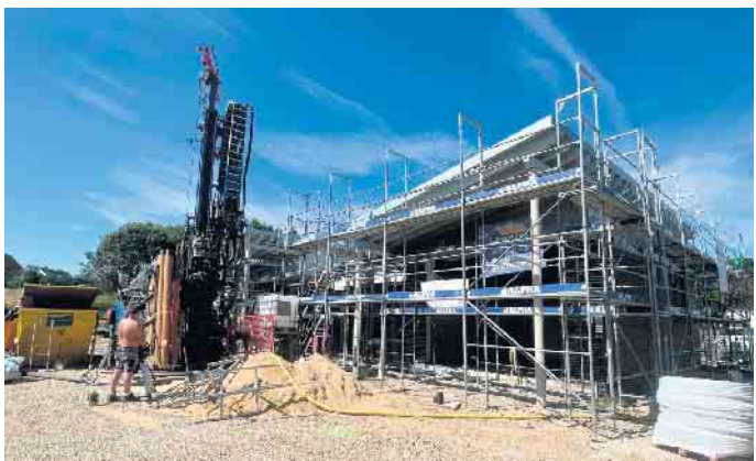
Die 5 bis zu 100 Meter tiefen Bohrungen für die Erdwärmenutzung sind bereits erfolgt.

Das energetische Konzept der im Bau befindlichen Kita in Dahlem stellt einen guten Schritt in Richtung Nachhaltigkeit dar. Durch die Integration von Wind- und Solarenergie, unterstützt durch moderne Speichersysteme und die geothermische Heizung, wird ein Großteil des zukünftigen Energiebedarfs der Einrichtung auf umweltfreundliche Weise gedeckt. Dieses Projekt dient nicht nur als Vorbild für andere öffentliche Einrichtungen, sondern zeigt auch, wie innovative Technologien erfolgreich zum Klimaschutz beitragen