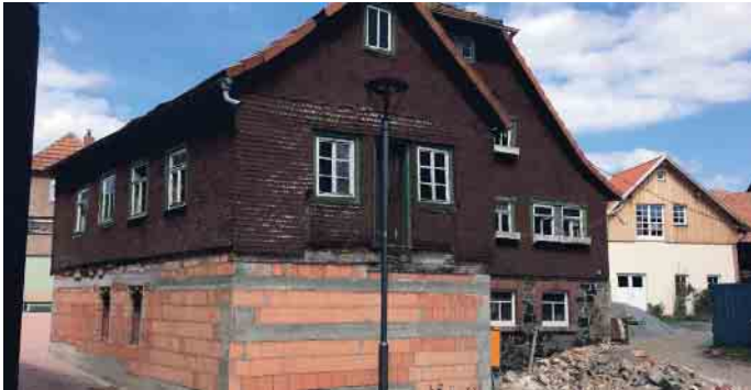
Bevor die Maler kamen, war die Mühle in einem traurigen Zustand.

Nicht sachgemäße Umbaumaßnahmen in der Vergangenheit und das undicht gewordene Dach hatten erhebliche Bauschäden am jahrhunderte alten Gebäude einer Müllerfamilie verursacht. Der Dachstuhl musste erneuert und das Gebäude komplett entkernt werden. Immerhin gelang es, das Originalfachwerk, Bemalungen und Teile des alten Holzfußbodens zu retten. Die alten Putzstrukturen der Mühle sollten übernommen werden, und da war es ein Glück, dass ein älterer Geselle der ausführenden Firma diese Technik, die er in der Jugend gelernt hatte, noch beherrschte. Alte Schindeln aus Eichenholz mussten zum Teil ausgetauscht, die verbliebenen mit einem Trockeneisverfahren schonend gereinigt und anschließend gestrichen werden. Bei diesen Arbeiten kamen denkmalgerechte Produkte von Caparol zum Einsatz: Histolith Halböl und Leinöl für den Anstrich von alten und neuen Schindeln, die speziell für Fachwerk und Holzverkleidungen entwickelt wurden, sowie Histolith Sol Silikat als Fassadenfarbe.