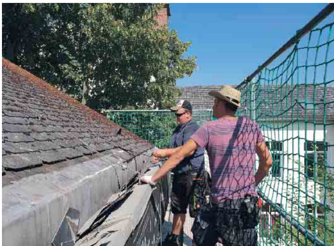
Verklammerung und Befestigung der Dachziegel bzw. -platten werden beim DachCheck geprüft.

Vor der Montage einer Photovoltaikanlagen müssen Hausbesitzer den Zustand ihres Daches prüfen lassen. Aber auch Dächer ohne weitere Aufbauten sollten regelmäßig gecheckt werden. Dächer werden durch starke Temperaturunterschiede, Stürme und heftige Regen- und Hagelschauer stark beansprucht. Dabei können unbemerkt Schäden entstehen, durch die sich im schlimmsten Fall beim nächsten Sturm Ziegel, Dachsteine oder Schiefer vom Dach lösen. Eigentümer haften für Schäden, die Passanten oder parkenden Fahrzeugen durch herunterfallende Bauteile zugefügt wer-