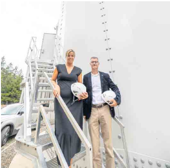
Ministerin und Bürgermeister informierten sich in der Windenergieanlage über die Technik.