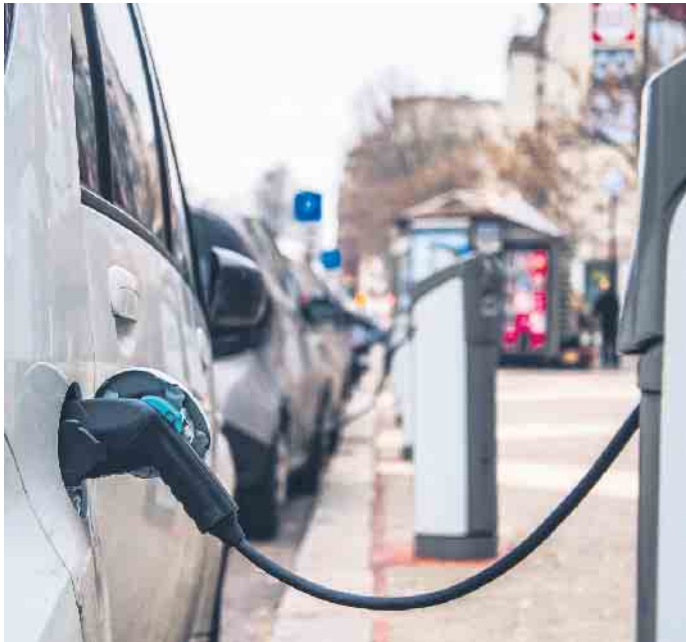
Mit Elektrofahrzeugen ist Carsharing nicht nur praktisch und flexibel, sondern auch noch besonders klimafreundlich.

Unter www.carassure.de gibt es mehr Informationen zum Angebot, das ebenso für Mietfahrzeuge oder in verschiedenen Kombipaketen auch für die Nutzung im In- und Ausland online abschließbar ist. Gemeldet wird ein Schaden erst, wenn die Rechnung vom Carsharing- oder Mietwagenanbieter über die Selbstbeteiligung vorliegt. (djd)