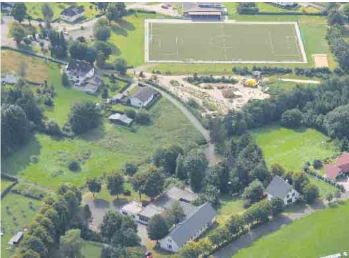
Heute sind Schulgebäude mit Anbau und Lehrerhaus von viel Grün und weiterer Bebauung umgeben, oben der Generationenpark und der Sportplatz.