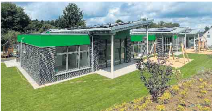
Mit den Dach-PV-Anlagen und der Windturbine wird ein Teil des Stromverbrauchs auf den Dächern erzeugt.