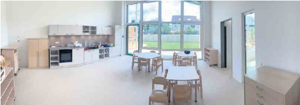
Jede Gruppe hat 3 Räume und den Sanitärbereich.

Ein bedeutendes Projekt der Gemeinde geht in die nächste Phase: Die Gemeinde Dahlem als Träger der Kindertageseinrichtungen hat Anfang des Monats das neue Kita-Gebäude am Schmidtheimer Bahn-