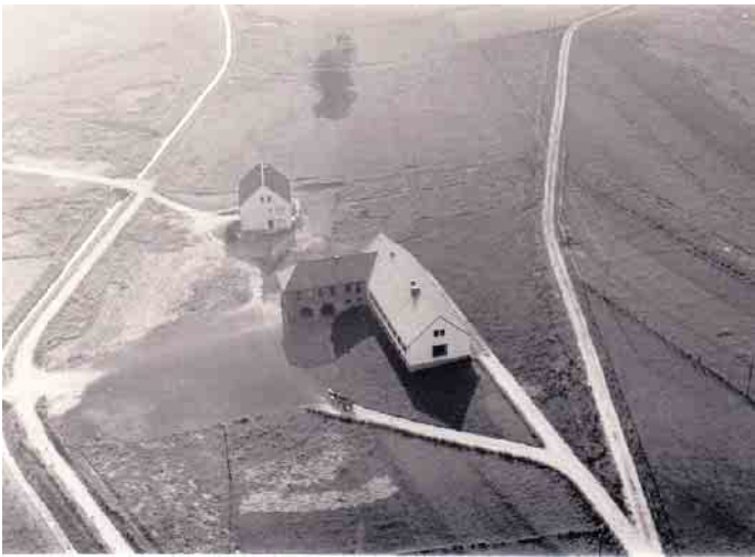
Das Foto von 1957: Schulgebäude (vorne) und Lehrerhaus (hinten) zwischen Urft (links) und heutiger Straße „Sonnenweg“ (rechts).

Daraufhin hat die Gemeinde Dahlem die beiden Gebäude verkauft, sie werden heute als Wohnhäuser genutzt.