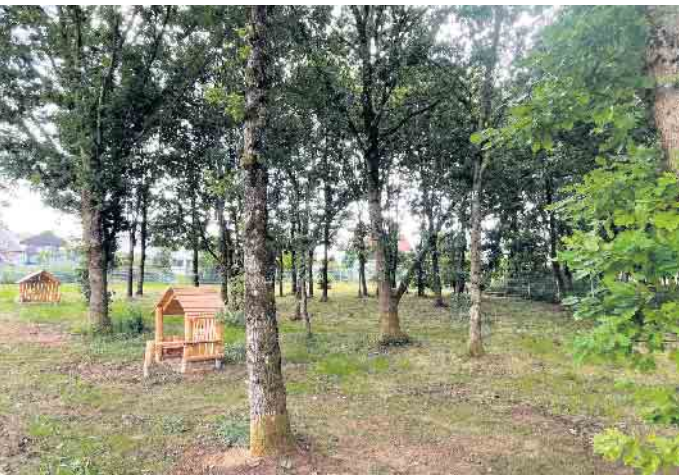
Zu jeder Jahreszeit bietet der Kita-Wald eine tolle Abwechslung im Tageslauf.