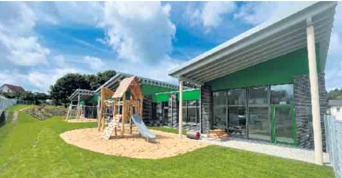
Viel Licht im Gebäude, viel Platz, tolle Spielgeräte und der Kita-Wald im Außengelände.

platzes werden PKW-Fahrer ge-behen, den unteren Stellplatz an der Bahn-Haltestelle zu nutzen. In dieser Woche startete der neue Kindergarten seinen Betrieb mit den ersten rund 20 Kindern. Wenn sich die Abläufe im Kinder-garten eingespielt haben und alle Restarbeiten erledigt sind, wird sich die Einrichtung auch den Bür-gerinnen und Bürgern präsentie-ren.