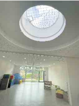
Der Bewegungsraum mit Lichtkuppel kann auch für Veranstaltungen genutzt werden.

Ein bedeutendes Projekt der Gemeinde geht in die nächste Phase: Die Gemeinde Dahlem als Träger der Kindertageseinrichtungen hat Anfang des Monats das neue Kita-Gebäude am Schmidtheimer Bahn-