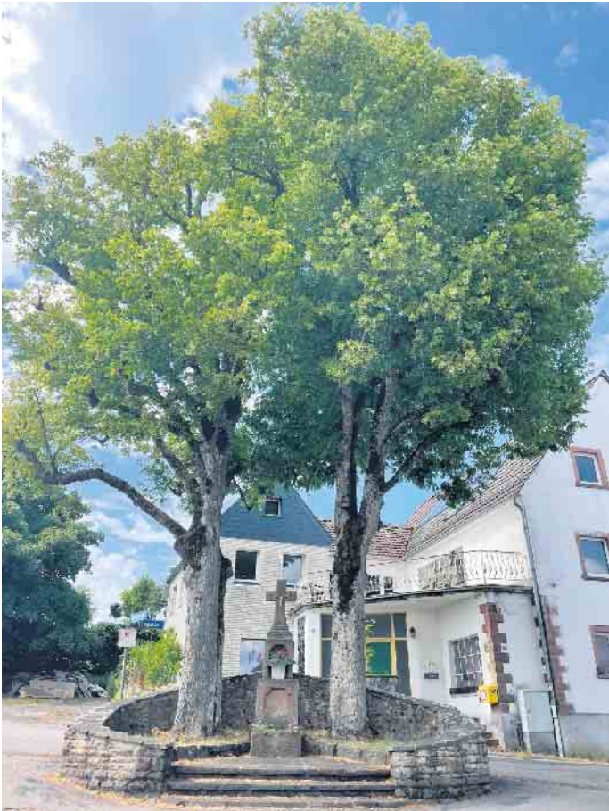
Ein Beispiel für diese wichtigen Maßnahmen sind die beiden etwa 80jährigen Linden am Prozessionskreuz im Ort Baasem.

mehr Wasser und Luft. Wo es erforderlich ist, wird verdichteter Boden im Wurzelbereich schonend abgetragen und strukturstabiles, durchwurzelbares Substrat zur Verbesserung der Standortbedingungen eingebracht. Pflanzung von trockenheitsverträglichen, wasserspeichernden Stauden, die gleichzeitig zur Biodiversität beitragen und pflegeleicht sind werden gepflanzt. Ein erneutes Verdichten der unmittelbaren Baumumgebung muss dann verhindert werden. Mit diesen Maßnahmen können die Lebensdauer und die Vitalität der wichtigen alten Bäume an den meisten Standorten verlängert werden. Das trägt neben dem ästhetischen und ökologischen Wert auch zur Verkehrssicherung bei.