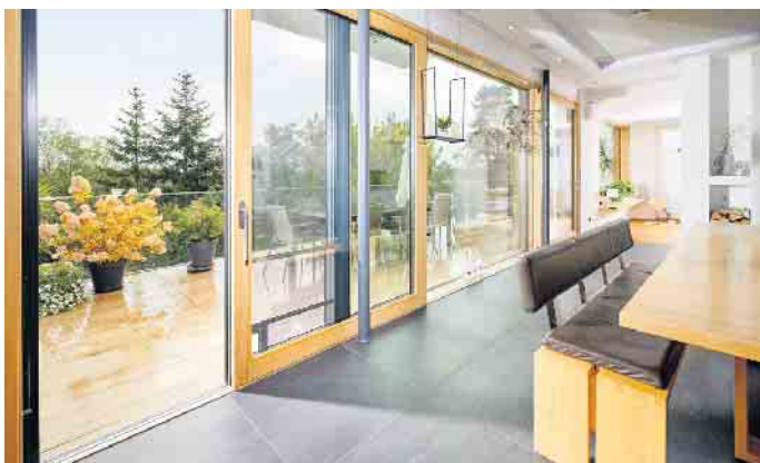
Holzfenster: der nachhaltige Klassiker.

Aluminiumrahmen werden wegen ihrer guten Statik sowie des robusten und doch leichten Materials besonders für große, moderne Fensterfronten gerne genutzt. Darüber hinaus sind sie sehr wartungsfreundlich. Dass Aluminiumfenster wegen ihres Materials besonders lange Wind und Wetter trotzen und in einer Vielzahl von Farben beschichtet und lackiert werden können, sind weitere Pluspunkte dieses beliebten Rahmenmaterials. 19 Prozent des hiesigen Marktes machen Aluminiumkonstruktionen aus, die häufig in hochwertigen Wohnungen und im Gewerbebau, aber auch als Sondereinheiten wie Brandschutz, Flucht- und Paniktüren zu finden sind. Durch das geschlossene Wertschöpfungskreislaufsystem liegt die Recyclingquote bei Aluminiumprodukten heute bereits bei circa 98 Prozent.