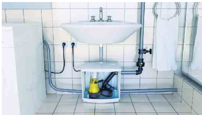
Die Kleinhebeanlage sammelt das Schmutzwasser aus Waschmaschine, Waschbecken und Dusche und pumpt es in das nächste Abwasserrohr. Richtig installiert, schützt sie auch gegen Rückstau.

fachlich richtig installiert und sorgt dafür, dass kein Abwasser aus dem Kanal zurück in den Keller drücken kann. Setzt man als Eigenheimbesitzer*in auf Markenprodukte und lässt diese vom Profi einbauen, hat man nicht nur die Gewährleistung auf das Gerät selbst, sondern auch auf die gesamte erbrachte Leistung, die Installateure auf Grundlage relevanter Normen durchführen. Kaufentscheidung: Kundendienst, Wartung & Ersatzteile Doch warum werden diese Vorteile nicht durch eine hohe Sternchen-Bewertung oder gute Rezensionen sichtbar? Der Grund ist einfach: Installateure kaufen die Markenprodukte, die sie einbauen, beim Fachgroßhandel ihres Vertrauens. Daher vergeben sie auch keine Sternchen im Netz oder nehmen sich die Zeit für Produkt-Rezensionen. Und nicht zu vergessen: Wenn