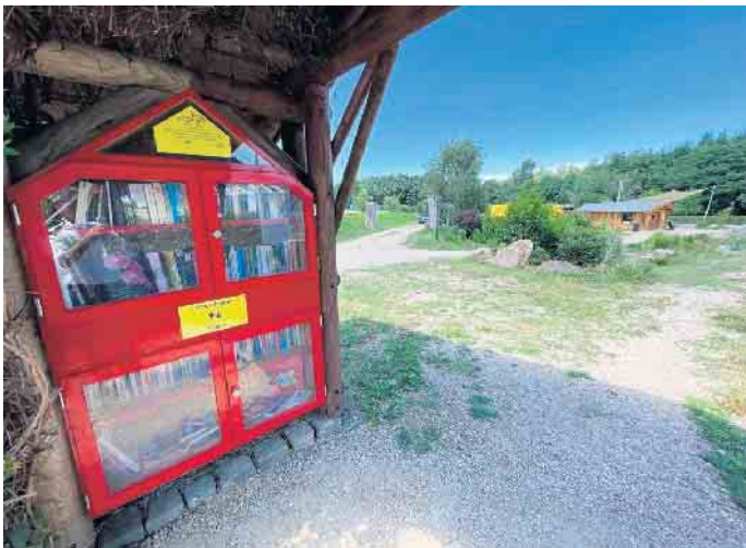
Der neue Bücherschrank am Eingang des Generationenparks in Schmidtheim