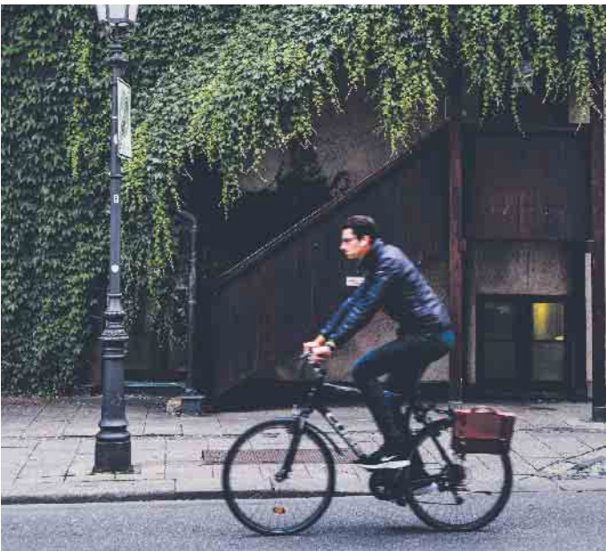
Volle Dröhnung: Auf keinen Fall darf man mit aufgesetzten Kopfhörern und hoher Lautstärke am Straßenverkehr teilnehmen.

Ohren auf im Straßenverkehr! Nicht nur gutes Sehen ist dort wichtig, auch um sich als Autofahrer, Radler oder Fußgänger sicher zu orientieren, ist das Gehör wichtig. Ist es also verboten, im Verkehr Kopfhörer zu tragen, um seine Lieblingsmusik, Podcasts oder Hörbücher zu genießen? Ganz so konsequent regelt es in Deutschland die Straßenverkehrsordnung (StVO) nicht. Hier heißt es lediglich in Paragraf 23 („Sonstige Pflichten von Fahrzeugführenden“): „Wer ein Fahrzeug führt, ist dafür verantwortlich, dass seine Sicht und das Gehör nicht durch die Besetzung, Tiere, die Ladung, Geräte oder den Zustand des Fahrzeugs beeinträchtigt werden.“ Auf keinen Fall darf man mit aufgesetzten Kopfhörern und hoher Lautstärke am Straßenverkehr teilnehmen. Am besten ist es daher, ganz auf Kopfhörer zu verzichten. Das gilt gerade für Modelle, die beidseitig im Ohr getragen werden oder die Ohren komplett umschließen, hier insbesondere alle Kopfhörer mit aktiver Unterdrückung von Umgebungsgeräuschen. Auf der anderen Seite können aber Kopfhörer als Freisprech-