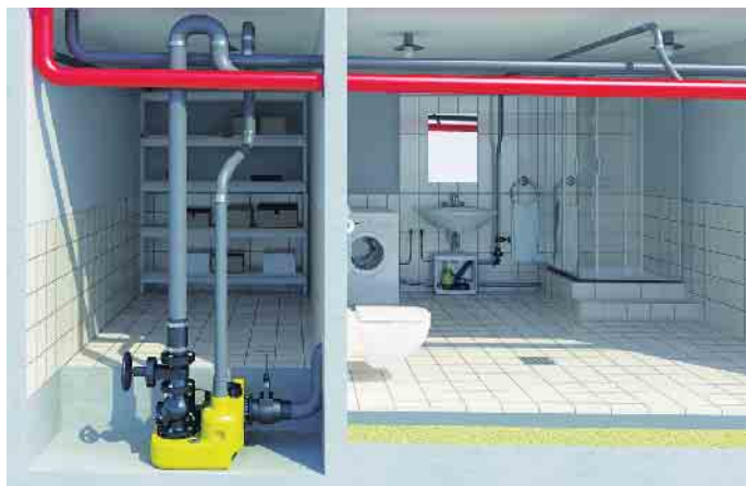
Die Hebeanlagen fördern Abwasser aus dem Keller in den Kanal und sorgen gleichzeitig für Schutz gegen Rückstau.

Zuverlässige Abwasserentsorgung inklusive Rückstau-Schutz