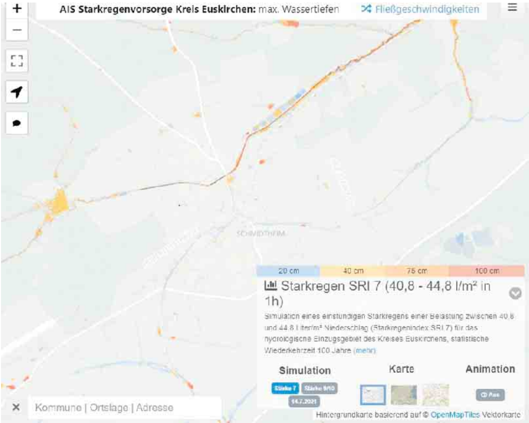
Starkregenkarte Schmidtheim