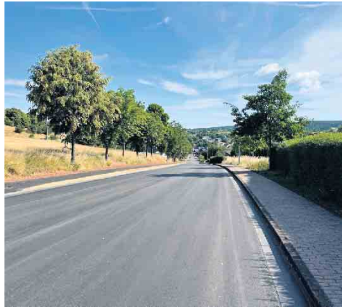
Die Trierer Straße Richtung Ortsmitte.

Anschließend wurde die über 800m lange Strecke im Auftrag des Eigentümers Landesbetriebs Straße