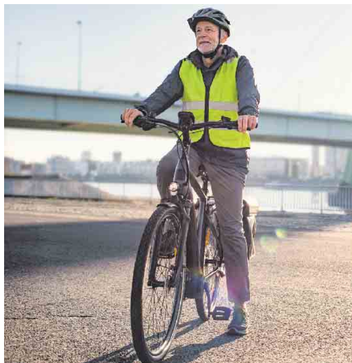
Jede fünfte Person über 55 Jahren besitzt einer Studie zufolge mittlerweile ein Pedelec.

Bundesweite Kampagne will Unfällen mit Elektrofahrrädern vorbeugen