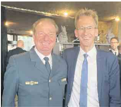
Detlef Seif ist Berichterstatter der CDU/CSU Bundestagsfraktion für Bevölkerungsschutz und steht in engem Kontakt mit den zuständigen Organisationen – hier bei der Verabschiedung des THW-Präsidenten Gerd Friedsam am 29. Juni 2023 in Bad Godesberg

Die Bundesregierung und die Ampelkoalition müssen deshalb dringend nachbessern.