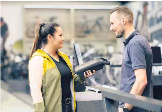
Rat vom Profi: Fahrradfachhändler können den Zustand des Akkus überprüfen, zudem nehmen sie verbrauchte oder defekte Energiespenders zurück.

sam umzugehen und ihn nicht immer komplett leerzufahren“, erklärt Bosch-Expertin Tamara Winograd. „Für eine lange Akku-Lebensdauer sollte man zudem starke Sonneneinstrahlung vermeiden.“ Bei längerer Nichtbenutzung ist es hilfreich, den Akku bei einem Ladestand von 30 bis 60 Prozent zu lagern - ein vollgeladener oder leerer Zustand bedeutet mehr Stress für den Akku. Wichtig: E-Bike-Akkus sollten in gut belüfteten Räumen mit Rauchmeldern geladen und aufbewahrt werden, die nicht als Fluchtweg vorgesehen sind. Am besten eignen sich Orte mit einer Umgebungstemperatur zwischen 0 und 20