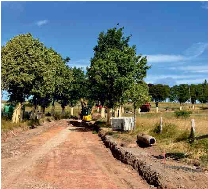
Bauarbeiten an der Zufahrt zum Friedhof und zum Wohngebiet Markusstraße

Eine weitere Großbaustelle in der Gemeinde ist inzwischen abgeschlossen. In Dahlem ist die gesamte „Trierer Straße“ (L 110) von der Kirche in der Ortsmitte bis zur Ortsgrenze Richtung Stadtkyll unter und über der Oberfläche saniert worden.