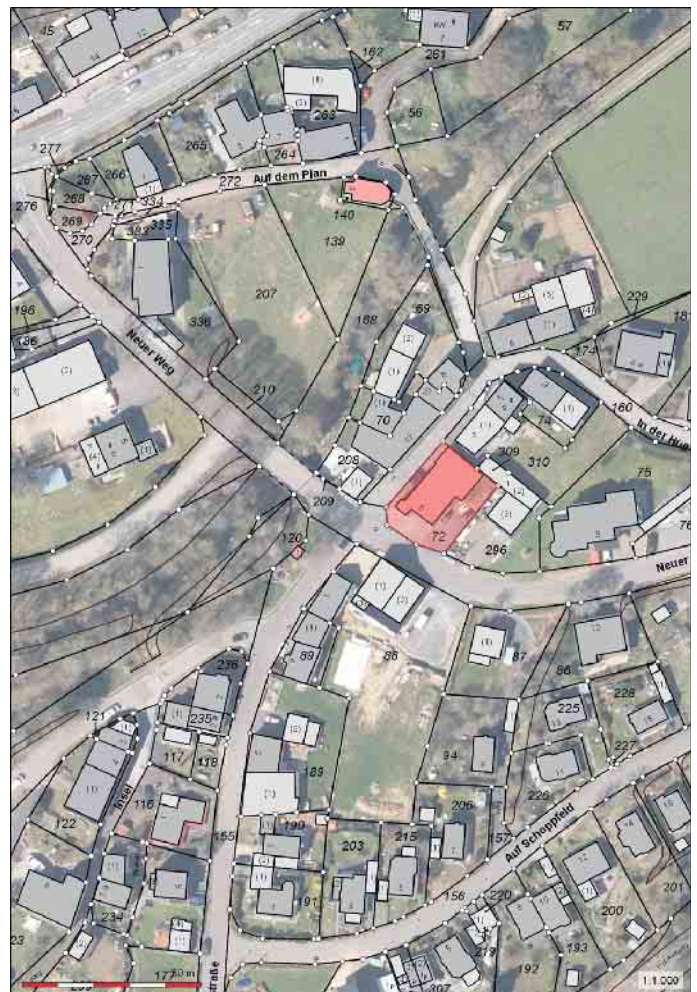
Übersichtskarte altes Feuerwehrhaus Kronenburg