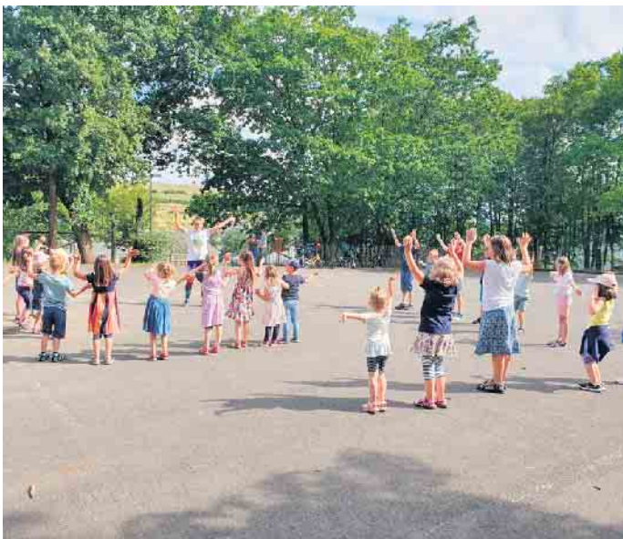
Musik, Bewegung und Spaß bei der Minidisco in Dahlem.