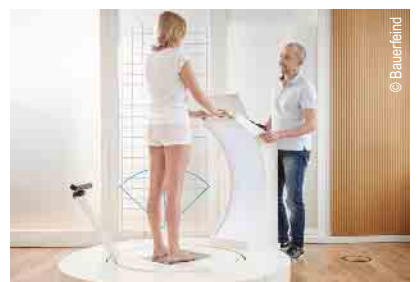
3D-Vermessung für Kompressions- strümpfe und orthop. Einlagen