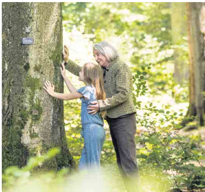
Ein Baum kann über Generationen hinweg als Ort der letzten Ruhe genutzt werden.

Eine Urnen-Umbettung nach Ablauf der Nutzungsfrist ist nicht notwendig