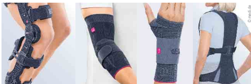
Direktversorgung von Bandagen und Orthesen