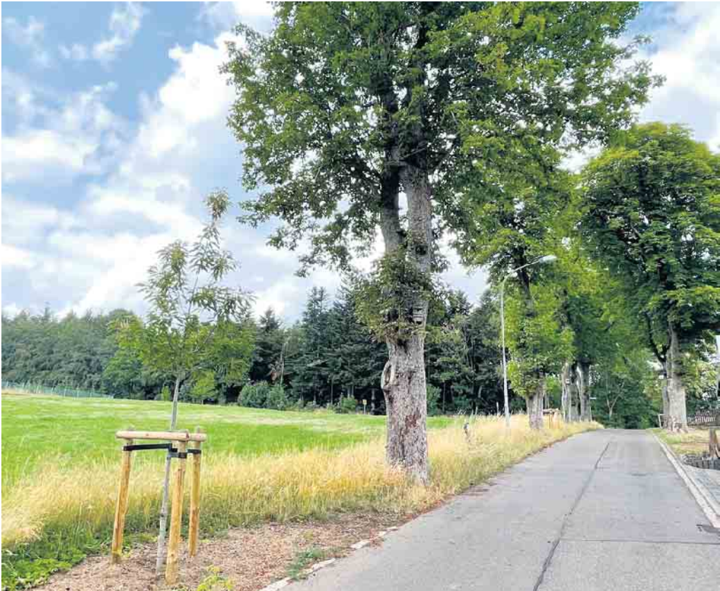
Neupflanzungen an der „Kastanienstraße“ in Schmidtheim

So mußten an der „Kastanienstraße“ in Schmidtheim einige alte Roßkastanien aufgrund einer Pilzerkrankung entfernt werden. Inzwischen sind Neuanpflanzungen mit Esskastanien erfolgt, die ein wärmeres und trockeneres vertragen Klima können. Damit können auch die Baumbestände in den Orten gesichert werden.