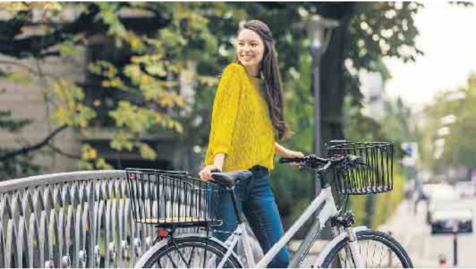
Lenker- und Hinterradkorb werden sicher und sekundenschnell angeklickt und wieder abgenommen.

Im Fachhandel gibt es eine Vielzahl an Fahrradtaschen, -boxen und -körben, die direkt am Fahrradrahmen, am Lenker, an der Sattelstütze oder am Gepäckträger befestigt werden können. Gute Mo-