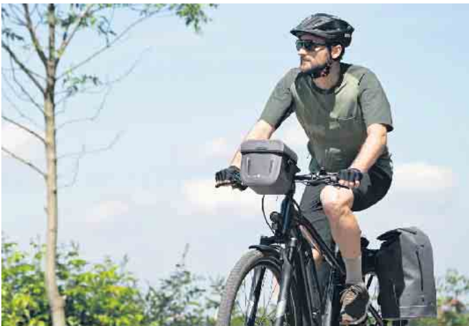
Gute Lenkertaschen zeichnen sich dadurch aus, dass sie mit einem Befestigungssystem, wie etwa Klickfix, ausgestattet sind.

delle zeichnen sich dadurch aus, dass sie mit einem Schnellbefestigungssystem, wie etwa Klickfix, ausgestattet sind. Damit werden sie sicher und sekundenschnell an den passenden Adapter geklickt - und per Tastendruck wieder abgenommen. Eine große Auswahl unterschiedlichster Modelle - von der kleinen Lenkertasche über Rucksack, Thermotasche und Hunde-