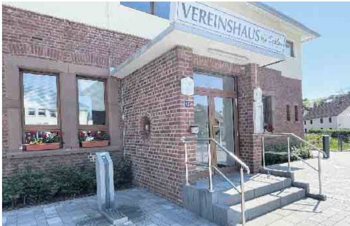
Der Trinkbrunnen auf dem Dorfplatz Dahlem am Vereinshaus.

Seit Anfang des Jahres hat Deutschland die EU-Trinkwasser-Richtlinie übernommen, wonach den Bürgerinnen und Bürgern mehr öffentliche Trinkwasserstellen zur Verfügung gestellt werden sollen. Diese Vorgaben sind auch eine Reaktion auf die Hitzeperioden der letzten Jahre, die sich auch in diesem Jahr fortsetzen und in Zukunft häufiger erwartet werden.