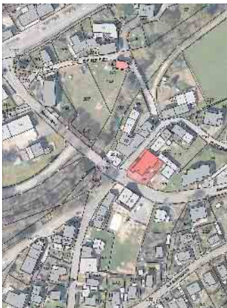
Übersichtskarte altes Feuerwehrhaus Kronenburg

Die Gemeinde Dahlem bietet das ehemalige Feuerwehrgerätehaus in Kronenburg, Neuer Weg 5, zum Verkauf an. Zu dem in Massivbauweise errichteten Gebäude (Grundbaujahr 1953) gehören unter anderem eine Fahrzeughalle, ein Feuerwehrturm, zwei ehemalige Wohnungen, ein Lagerraum und eine Garage. Die Bruttogrundfläche des Gesamtgebäudes beträgt rund 470 m². Die Grundstücksfläche beläuft sich auf 539 m². Das Gebäude ist sanierungsbedürftig. Der vorhandene Feuerwehrturm ist dauerhaft zu erhalten. Kaufinteressenten werden ge-