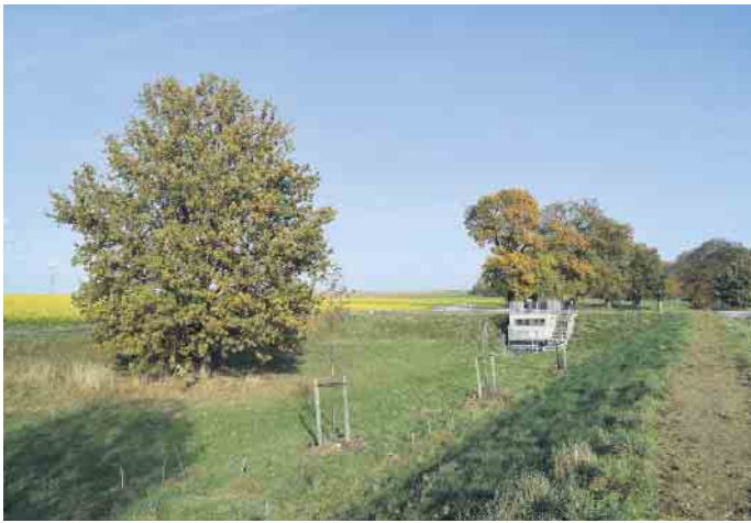
Beispiel für eine mögliche Schutzmaßnahme: Errichtung eines so genannten Hochwasserrückhaltebeckens.