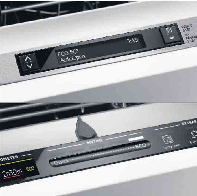
Für vollintegrierte Modelle gibt es unterschiedlichste Bedienkonzepte - z. B. zum Tippen (oben) oder intuitiv per manuellem Touch-Schieberegler (unten). Er ermöglicht eine individuell anpassbare Geschirreinigung: von extrem sparsam, wenn Zeit gerade keine Rolle spielt, bis schnell.

tet. Er nimmt Kleinteile auf wie z. B. Espressotassen, Müsli-Schalen, Kochbesteck und kleine Plastikschälchen. Ein spezielles Design sorgt dafür, dass das Spülgut während des Reinigungsprozesses auch an Ort und Stelle bleibt und weder verrutscht noch sich verdreht, wie es bei kleineren Geschirrtteilen aus Kunststoff vorkommen kann. Und da sich ein Teil des Korbs verschieben lässt, können im Oberkorb darunter sogar langstielige Weingläser oder voluminöse Weißbierrgläser untergebracht werden, die dort sonst keinen Platz hätten. Neue Auszugssysteme sorgen für einen geschmeidigen und schwebelichten Lauf der Korbsysteme. In Premium-Spülern garantieren spezielle Auszugsschienen mit integrierter Dämpfung einen schonenden Umgang mit hochwertigen Glas- und Porzellanwaren während des Ein- und Ausfahrens der Geschirrkörbe. Und wer seine Bandscheiben beim Ein- & Ausräumen schonen möchte, der lässt sich seine Neuheit in einen Hochschrank einbauen. Oder er wählt ein Modell, bei dem der untere Geschirrkorb beim Herausziehen auf Hüfthöhe angehoben wird.