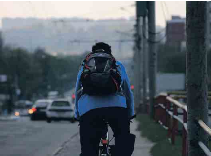
Zum Schutz aller Verkehrsteilnehmer bedarf es mehr gegenseitiger Rücksichtnahme.

Nach wie vor sind Autos die größte Gefahr für Radfahrer. Dabei lassen sich viele Unfälle - vor allem die sogenannten Dooring-Unfälle - bereits durch einfache Maßnahmen und mehr gegenseitige Rücksichtnahme im Verkehr verhindern. Allein in Berlin kommt es seit 2018 statistisch gesehen jeden Tag zu mindestens einem „Dooring-Unfall“, dem Zusammenstoß eines Radfahrers mit der sich öffnenden Tür eines parkenden Autos. Der kann für Radfahrende mit schweren Verletzungen - in einigen Fällen sogar tödlich - enden. Radfahrende selbst können einen Dooring-Unfall nur schwer verhindern. Viele Radwege in der Stadt führen direkt an parkenden Autos vorbei. Bei einer Geschwindigkeit von 20 km/h müssten Radfahrende ca. elf Meter im Voraus sehen,