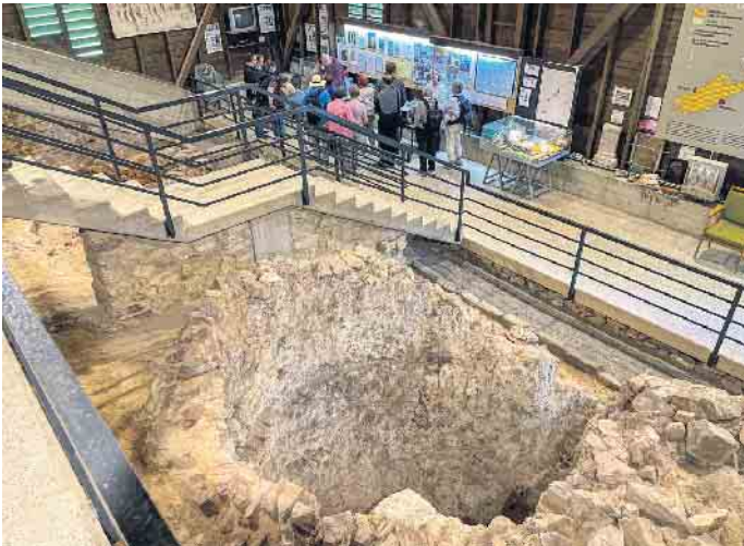
In der römischen Kalkbrennerei in Iversheim.

Der Verein Erlebnisraum Römerstraße e.V. veranstaltete im Mai erstmals zwei Bustouren auf den ehemaligen römischen Fernstraßen Via Belgica und Agrippastrasse. Die spezielle Art der Erkundung der Römerstraßen fand großen Anklang. Der Verein betreut das 2015 fertiggestellte Tourismus-Projekt Erlebnisraum Römerstraße. Mit diesem Großprojekt wurde erstmals der Verlauf von zwei antiken Fernstraßen nördlich der Alpen auf moderne Art sichtbar gemacht. 170 Kilometer lange Rad- und Wanderrouen verlaufen heute möglichst auf oder nahe an den Originaltrassen entlang und machen die römischen Fernstraßen von Köln nach Boulogne-sur-Mer (Via Belgica) und von Köln über Trier und Lyon nach Marseille (Agrippastrasse) auf ihren Teilstücken in Nordrhein-Westfalen wieder erlebbar. Wer allerdings weder radelnd noch wandernd in die Geschichte des Rheinlandes eintauchen wollte, konnte die Angebote des Vereins annehmen und auf einer Bustour mit fach- und sachkundiger Begleitung beide Römerstraßen erkunden. Die Fahrt auf und entlang der Via Belgica begann in Übach-Palenberg. Der Leiter des Museums in Jülich, Herr Marcell Perse MA, begleitete die Gruppe fachkundig den ganzen Tag. Erster Haltepunkt