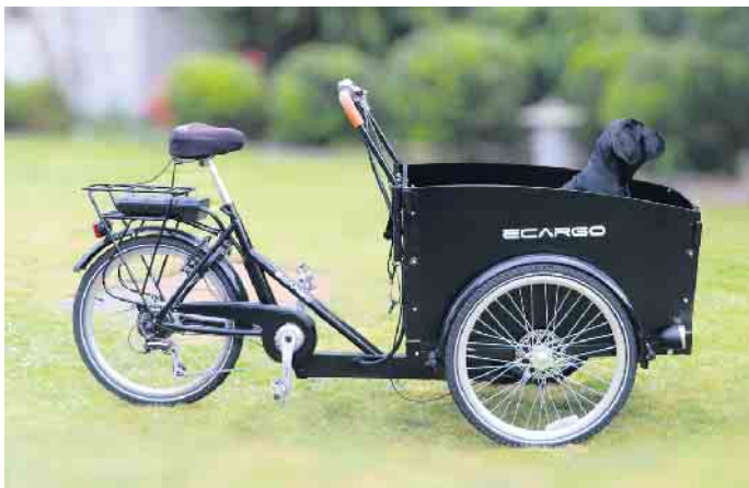
Grundsätzlich ist das Lastenrad eine sichere Methode, nicht nur Güter, sondern durchaus auch Kinder oder Tiere zu befördern.

verpflichtenden Fahrradweg ist nur vorgesehen, wenn das Rad zu breit ist oder die Qualität des Weges nicht zumutbar. Außerdem dürfen Lastenradfahrer auf dem Gehweg fahren, wenn sie unter Achtjährige begleiten. Wie nehmen mich andere Verkehrsteilnehmer wahr? Hier gilt es die Sichtbarkeit zu überprüfen; Reflektoren an Rad und Kleidung oder Fahnen zum Beispiel sorgen für Aufmerksamkeit. Aber es geht auch um das eigene vorausschauende Fahren: Da sich der Lastenkorb gewöhnlich in der Front befindet, schiebt dieser sich in den Verkehr, bevor der Radler den richtigen Einblick hat. Gleichzeitig ist der Korb so niedrig, dass andere Verkehrsteilnehmer das Gefährt erst spät wahrnehmen. Was darf transportiert werden und mit welchem Gewicht? Sachgüter, Tiere und Kinder sind als ‚Last‘ erlaubt; bei bestimmten Modellen auch Erwachsene. Wichtig: Das maximale Gesamtgewicht