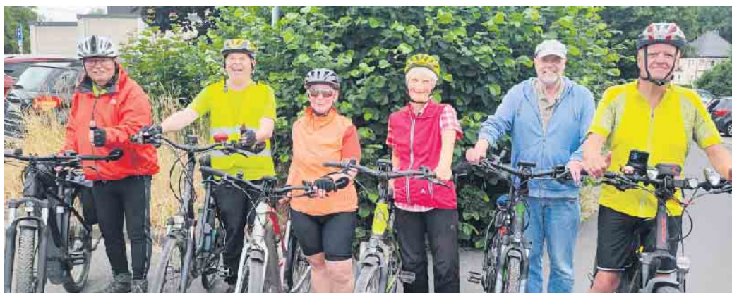
14 Menschen fanden sich nach der Auftaktveranstaltung „Das Netzwerk startet durch“ zur neuen E-Bike-Gruppe zusammen. Diese sechs Teilnehmer gingen jetzt auf ihre erste Tour.

Das Durchstarten hat sich gelohnt - bei der neuen E-Bike-Gruppe im Netzwerk von Urft und Olef ist das