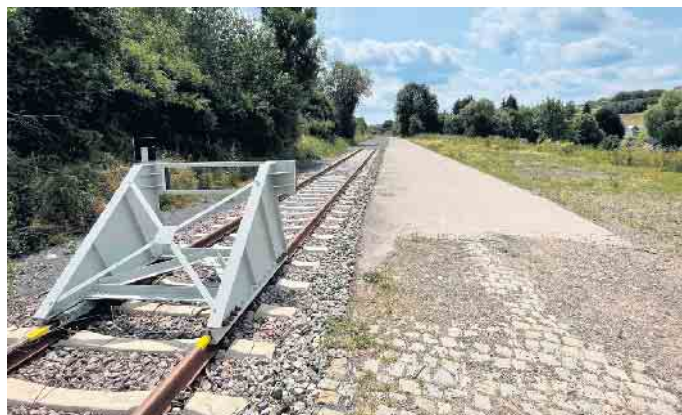
Das erneuerte Transportgleis in Dahlem

In Dahlem auf dem Gelände der Deutschen Bahn am Ende der Bahnstraße wurde im letzten Jahr ein Gleisabzweig von der Bahnstrecke nach Trier komplett erneuert. Diese Arbeiten erfolgten im Auftrag des Stromnetzbetreibers Amprion im Zusammenhang mit