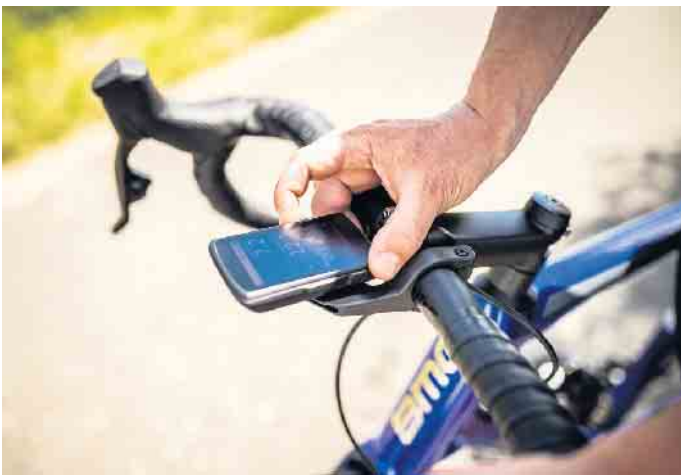
Mit zeitgemäßem Zubehör lassen sich auch ältere Räder gestiegenen Anforderungen anpassen.

der Straße empfiehlt sich aufgrund der guten Geländegängigkeit und Federung ein Mountainbike. Wer hingegen lange Strecken mit höherer Geschwindigkeit fahren möchte, sollte sich ein Rennrad zulegen. Es ist leicht und auch dank der sportlichen Sitzposition besonders aerodynamisch. Eine gute Mischung zwischen Sportlichkeit und Komfort bieten Trekkingräder, die sowohl im Alltag als auch auf Touren gute Dienste leisten. Doch manchmal muss es einfach praktisch sein. „Wer auf dem Weg zur Arbeit nicht aufs Rad verzichten will, setzt aufs Faltrad. Falträder sind platzsparend und können bequem in Bus, Bahn oder Auto transportiert werden - deshalb liegen sie wieder voll