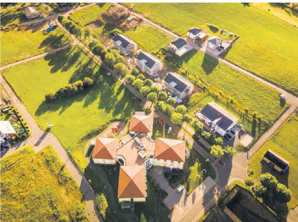
Die Einrichtungen für ältere Menschen in unserer Gemeinde: unterhalb der Allee das „Haus Marienhöhe“, darüber die 3 Gebäude Service-Wohnen und rechts die Caritas-Tagespflege.

Nach intensiven Akquisitionsbemühungen hat sich der Saarländische Schwesternverband 2019