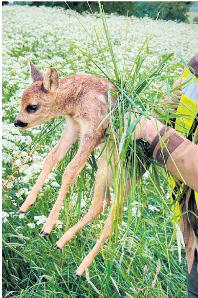
Rehkitzrettung Kreis Euskirchen e.V.