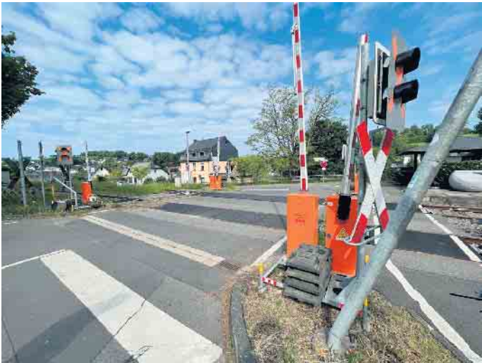
Am Bahnübergang in Dahlem sind die provisorischen Schranken- und Signalanlagen aufgestellt.

die Geschwindigkeit für die Straße auf 30km/h zu begrenzen. Es handelt sich um die drei folgenden Bahnübergänge: Dahlem I: Höhengleiche Kreuzung bei bahn-km 77,368 mit „Bahnstraße“ Dahlem II: Höhengleiche Kreuzung bei bahn-km 78,268 mit „Untermühle“ Dahlem III: Höhengleiche Kreuzung bei bahn-km 78,790 mit unbenanntem Weg (Abzweig von Untermühle) Der Neubau der Anlagen ist bereits vollständig geplant und ist für den Zeitraum Oktober 25 - März 26 vorgesehen, in dieser Zeit ist kein Bahnverkehr in diesem Streckenabschnitt vorgesehen, was ein sicheres und reibungsloses Arbeiten an den Anlagen ermöglicht.