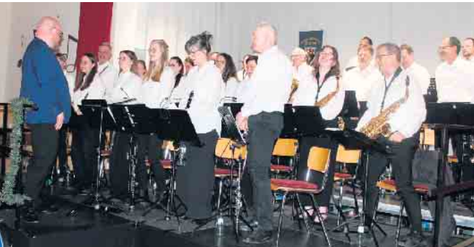
Die über 30 Musiker:innen freuten sich über den heftigen Applaus im voll besetzten Vereinshaus am Ende des Konzerts.

mer spielten sowohl allein als auch mit dem Musikverein Dahlem zusammen drei unterhaltsame Stücke. An der Sicherung der Zukunft des Vereins arbeitet dieser schon seit Jahren sehr intensiv und, wie man sehen und hören konnte, erfolgreich weiter.