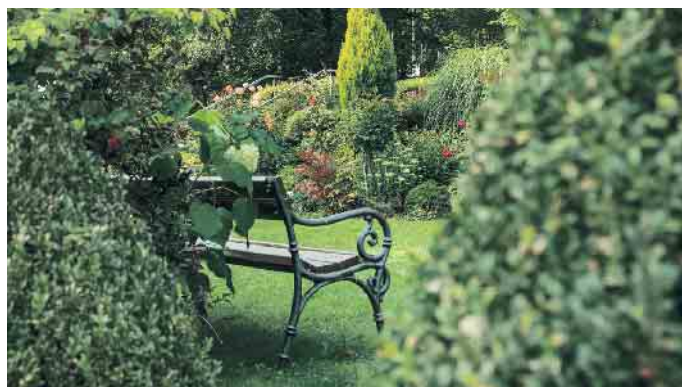
Rasengrab oder Bestattung im Blumengarten.

Frühzeitig Entscheidungen treffen Empfehlenswert ist es, zu Lebzeiten festzulegen, ob später eine Körperbestattung oder eine Einäscherung erfolgen soll, damit den Angehörigen diese Entscheidung in der Zeit der Trauer abgenommen wird. Die Körperbestattung ist zumeist teurer wegen massiverer Särge und höherer Grabkosten. Außerdem gibt es hierbei weniger Möglichkeiten für die Art der Beisetzung, wie sie viele Städte und Gemeinden bei Urnengräbern anbieten.