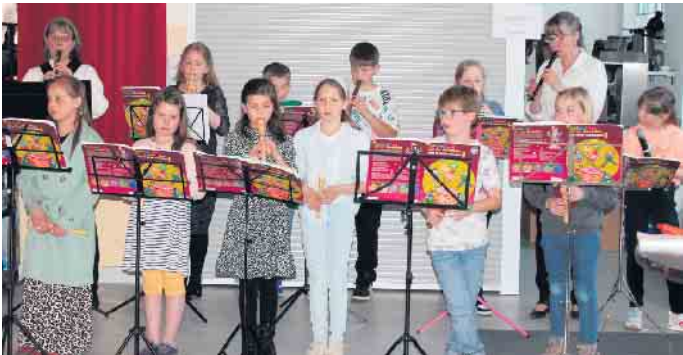
Auch der Nachwuchs des Musikvereins trug zum Gelingen des Konzerts bei.