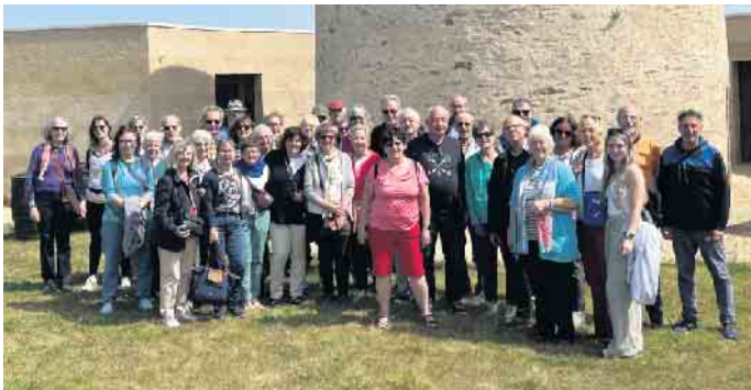
Deutsch-Französische Gruppe Weingut

Rhuys“ für die 2022 erfahrene Gastfreundschaft. Der letzte Abend gehörte den Familien. Am Sonntag, 4. Mai, hieß es Abschied nehmen von alten und neuen Freunden. Pünktlich um 8 Uhr startete der Bus wieder Richtung Heimat, wo er die Gemeinde Dahlem trotz des sensiblen Wochenendes um 22 Uhr erreichte. Wie immer war es eine richtig schöne Zeit inmitten einer angenehmen Gemeinschaft.