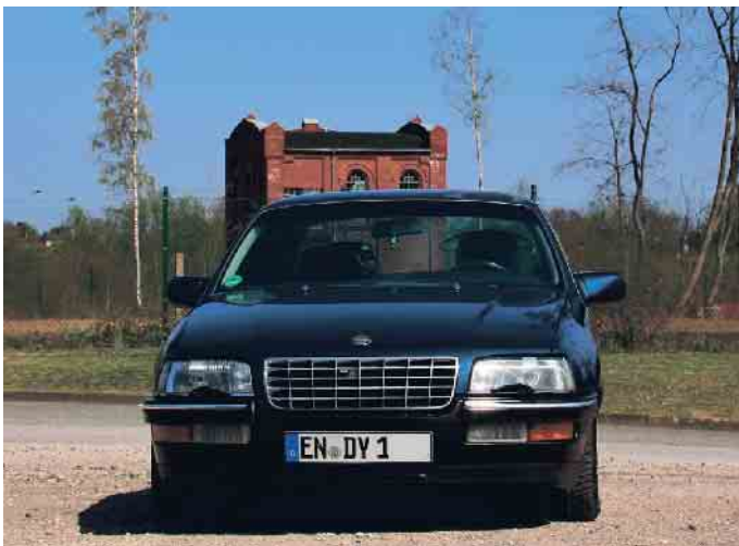
Autokennzeichen müssen von Gesetzes wegen gut lesbar sein.

NOTARIUS KFZ-Technik Dahlem ☎ 02447-91 30 62