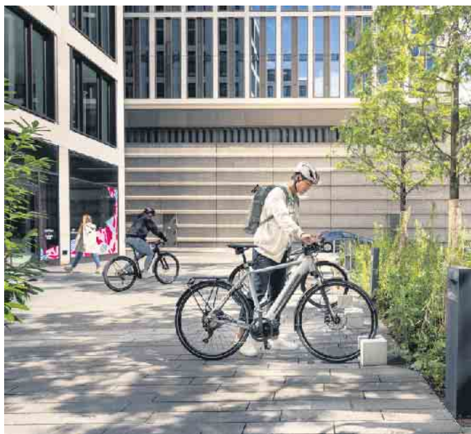
Sorgenfreier unterwegs: Mit einem digitalen Diebstahlschutz wird das Abstellen von E-Bikes noch sicherer.

Zusätzlich dient ein Sicherheitsfeature zum Deaktivieren der Motorunterstützung. Ob es aktiv und damit die Motorunterstützung deaktiviert ist, signalisieren kurze Töne, Lichter und Symbole auf der Bedieneinheit LED Remote, dem Display oder Smartphone. Unter www.bosch-ebike.com/de/produkte/ebike-protect gibt es weitere Tipps für einen wirksamen Diebstahlschutz fürs E-Bike. (DJD)