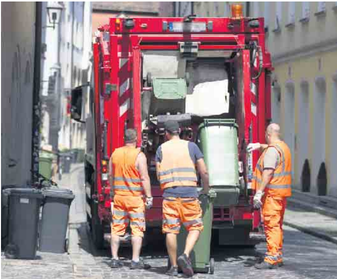
Jobrisiko Sonne: Beschäftigte in Außenberufen sind besonders gefährdet für hellen Hautkrebs.

Generell ist ein achtsamer Um- gang mit der Sonne wichtig. Tipps hierzu auch auf www.actinicalotion.com . So ist es sinnvoll, sich gerade in der war- men Jahreszeit einen Trick der Süd- europäer abzuschauen: Diese hal- ten in der Mittagszeit eine lange Siesta und sind so weniger Risiko durch die UV-Strahlung ausge- setzt. Zumindest sollte in diesen Stunden die Arbeit in den Schatten verlegt werden. Hier sind auch Ar- beitgeber in der Pflicht, die außen liegenden Arbeitsstellen abzuschir- men beziehungsweise zu überda- chen. Und nicht zuletzt können sorgfältige Selbstbeobachtung und regelmäßige Vorsorgeuntersu- chungen beim Hautarzt helfen, Hautkrebs möglichst frühzeitig zu entdecken und behandeln. (DJD)