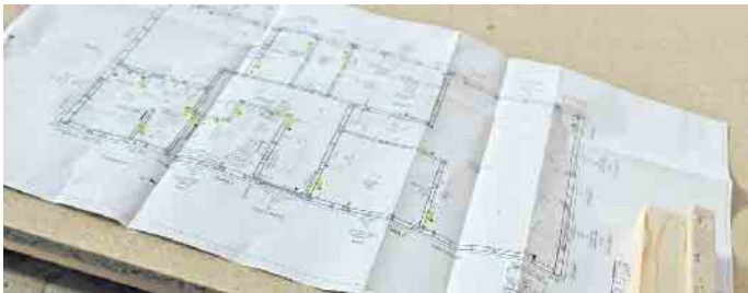
Der maßstabsgetreue Grundriss ist eine wichtige Planungsgrundlage für Bauherren sowie bei der Herstellung von Fertigbauteilen im Werk.

Mit Blick auf das Älterwerden und sich wandelnde Lebensumstände sollten Bauherren bei der Hausplanung auch auf die Flexibilität ihres Grundrisses achten: Lässt sich etwa ein großes Kinderzimmer noch problemlos aufteilen, wenn weiterer Nachwuchs ins Haus steht? Und was passiert mit dem Familiendomizil, wenn in einigen Jahren die Kinder das Haus verlassen? Lässt es sich in zwei separate Wohneinheiten unterteilen, von denen eine bestenfalls barrierefrei und damit perfekt für das Älterwerden in den eigenen vier Wänden geeignet ist? „Bei aller Euphorie in der Planungsphase ihres Traumhauses, sollten junge Baufamilien immer auch vorausschauen. Bei einem Holz-Fertighaus können sie sich auf die Erfahrung ihres Hausherstellers verlassen, denn er arbeitet alle Merkmale des Neubaus Zimmer für Zimmer mit der Bau-familie durch, bevor das Haus in die Produktion geht - so gelingt die Grundrissplanung zukunfts-sicher“, schließt Tews. BDF/FT