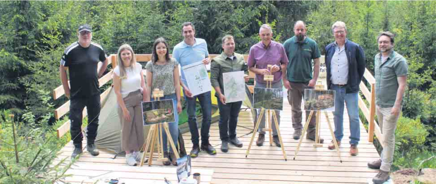
Vertreter der beteiligten Kommunen, des Naturparks Nordeifel und der Nordeifel Tourismus GmbH stellten die Standorte der vier neuen Trekking-Plattformen vor.

Vier neue Naturlagerplätze in Dahlem und Hellenthal