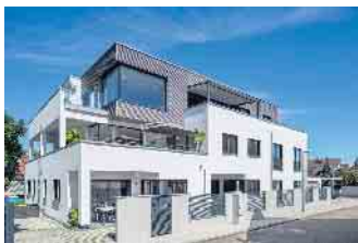
Mehrgenerationenhäuser in Holz-Fertigbauweise sind im Kommen.

Mehrgenerationenhäuser aus Holz sind ein zukunftssicheres Zuhause für die ganze Familie