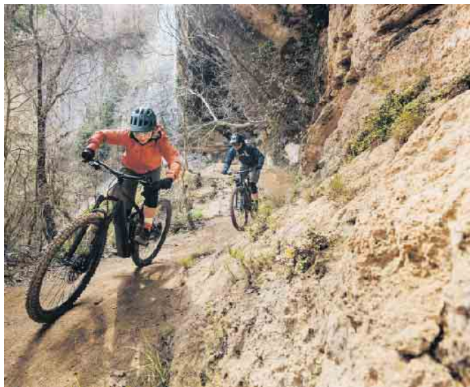
Das E-Bike ist das passende Trainingsgerät für alle, die gezielt ihre Fitness verbessern möchten.

wichtigsten Informationen zählen unter anderem Höhendaten, Leistungswerte, die Trittfrequenz und die Anzeige der verbrannten Kalorien. So sehen E-Biker, ob sie gerade über oder unter ihrer persönlichen Leistung und Trittfrequenz fahren und können auf diese Weise ihr Sportprogramm optimieren. Mit dem richtigen Training ist das E-Bike ein effektiver Fettverbrenner und Fitnessturbo. Wichtig dabei: Gerade Einsteiger sollten sich realistische Ziele setzen und sich zu Beginn nicht überfordern. Zudem sollten sich auch Sport-Enthusiasten zwischen jeder intensiven Einheit ein bis zwei Ruhetage zur Regeneration gönnen. Ein weiterer Tipp: E-Biken in der Gruppe macht noch mehr Spaß und fördert erfahrungsgemäß die persönliche Motivation. (DJD)