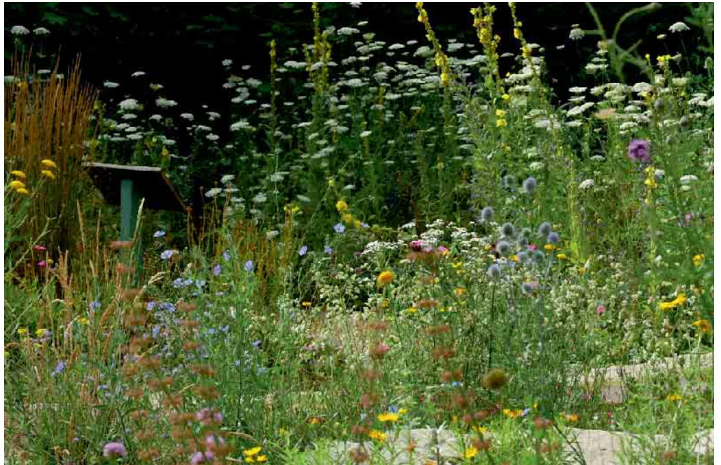
Naturgärten sind Blüh- und Insektenparadies zugleich.

Um den Austausch zwischen den Teilnehmenden zu fördern und Fragen zu klären, bietet die Stiftung für Mensch und Umwelt zusätzlich ab dem Sommer eine monatliche Live-Veranstaltung auf der Lernplattform an. Los geht es immer mit einem Impuls zu einem Schwerpunktthema, darunter zum Beispiel die Auswahl von geeigneten Substraten für neu zu ge-