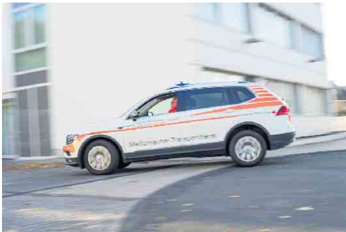
Das Blut muss natürlich auch zum Empfänger transportiert werden. Hierfür ist eine gute Logistik erforderlich.

Wie vor der Coronakrise üblich, wird durch die Mitglieder des DRK-Ortsvereins Hellenthal für die Spender wieder ein Imbiss angeboten. Beim letzten Termin in Hellenthal waren über 128 Spender gekommen, davon hatten sechs Blutspender erstmals ihr Blut zur Verfügung gestellt. Weitere Infos können auch unter der Webseite des Blutspendedienstes unter „www.blutspendedienst-west.de“ eingesehen werden. Hier werden Geschichten rund um das Blutspenden aufgeführt.