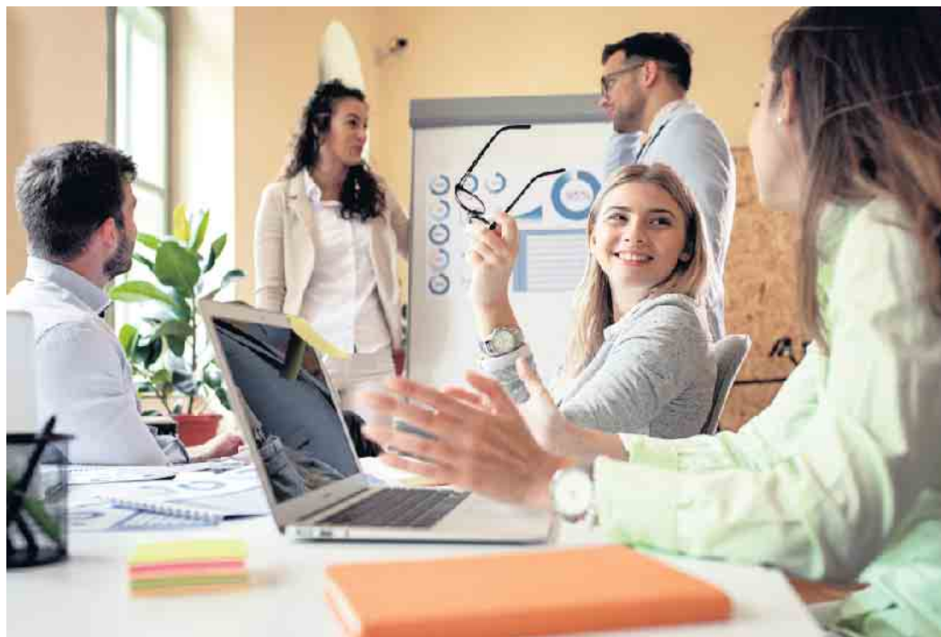
Kommunikative Fähigkeiten sind bei angehenden Bankkauffleuten besonders gefragt.

Für Abiturienten, die sowohl ein Studium als auch eine praxisbezogene Ausbildung absolvieren wollen, ist das duale Studium eine interessante Perspektive. Die Studierenden lernen wie bei einer normalen Ausbildung neben der Kundenberatung in der Filiale auch verschiedene zentrale Abteilungen wie die Kreditab-