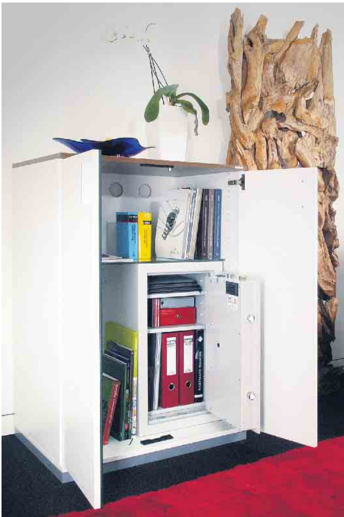
Schutz für alle Fälle: Wertschränke sind der passende Aufbewahrungsort für Schmuck, Uhren und Bargeld, aber auch für wichtige Dokumente.

dem persönlichen Fingerabdruck regeln, dafür eignen sich biometrische Verschlusssysteme. Beispielsweise unter www.hartmann-tresore.de gibt es einen Überblick zu den verschiedenen technischen Lösungen und weitere Tipps rund um den Kauf eines Wertschranks. Der klassische Look eines Tresors muss heute übrigens nicht mehr sein. Möbeltresore lassen sich unauffällig in Einbauschränke oder Sideboards integrieren. Alternativ sind auch Möbel erhältlich, die den Wertschrank komplett umrahmen und sich somit harmonisch in das Wohnumfeld einfügen. (djd)