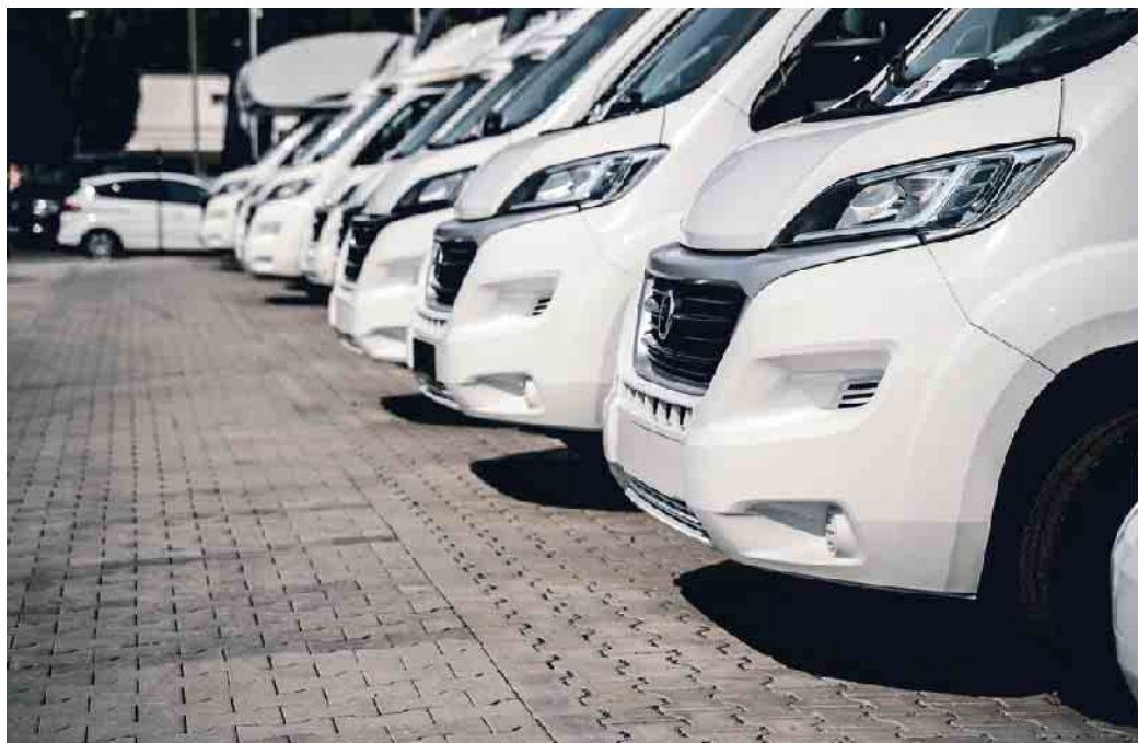
Wohnwagen sind aktuell sehr beliebt.