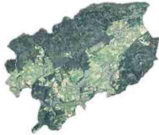
Mehr als die Hälfte der Gemeindefläche ist mit Wald bewachsen.

Jährlich kann ein Hektar Waldfläche durchschnittlich 6 Tonnen CO 2 speichern, in einem Festmeter Holz sind rund 1 Tonne CO 2 gebunden. Allerdings hat der Wald in ganz Deutschland einige ‚schwere‘ Jahre hinter sich. Die Niederschläge in den wichtigen Vegetationszeiten gingen deutlich zurück, die Durchschnittstemperaturen stiegen gleichzeitig an. Das hat dann auch zu einem ungewöhnlich langen Zeitraum des Borkenkäfer-Befalls über mehrere Jahre geführt. In anderen Regionen in NRW und Deutschland sind daher 30 bis 50% der Fichtenbestände abgestorben. In den flachen Gebieten in NRW rechnen die Fachleute gar mit einem Aussterben der Fichte in den nächsten Jahren. Dem Dahlemer Wald geht es erfreulicherweise etwas besser. Die Höhenlage, die (noch) relativ hohen Niederschläge und