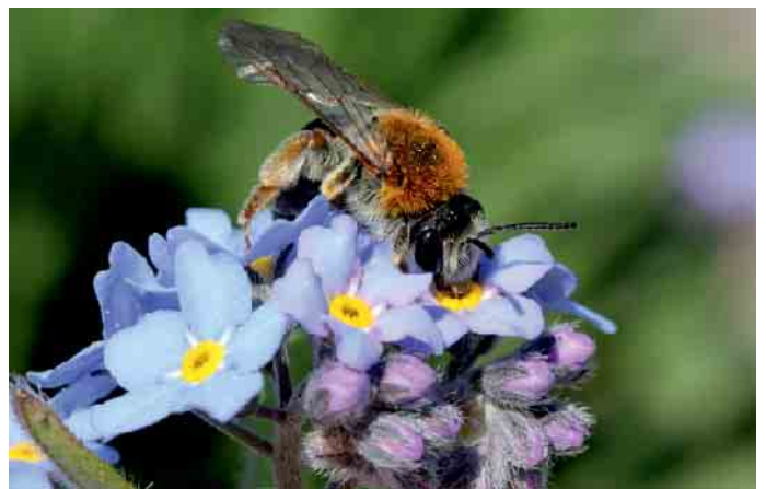
Sandbiene ( Andrena haemorrhoa ).

Naturnahes Grün im Wohnungsbau hat großes Potenzial, die Artenvielfalt zu fördern. Rasenflächen können großflächig in blühende Wiesen umgewandelt werden. Naschobst wie Stachel- oder Jo-