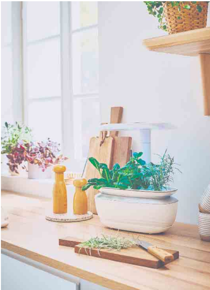
Gesund & frisch ernähren und Indoor-Gardening liegen im Trend. Mit diesem vernetzten Mini-Indoor-Garten lassen sich Kräuter, Salate, essbare Blüten, Microgreens und Früchte das ganze Jahr über superfrisch ernten.