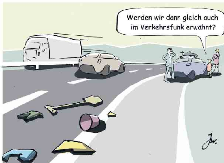
Kaum zu glauben, was so alles auf den Fahrbahnen herumliegt.

Das verlangt auch der Paragraph 32 der Straßenverkehrsordnung (StVO). Demnach ist es verboten, „die Straße zu beschmutzen oder zu benetzen oder Gegenstände auf Straßen zu bringen oder dort liegen zu lassen, wenn dadurch der Verkehr gefährdet oder erschwert werden kann.“ Verstöße werden mit Bußgeldern bis zu 60 Euro geahndet und können - je nach Schwere des Vergehens - sogar einen Punkt in Flensburg nach sich ziehen. Was folgt nun daraus, wie hat man sich zu verhalten, wenn man selbst der Verursacher von Hindernissen auf der Fahrbahn ist? Und wie