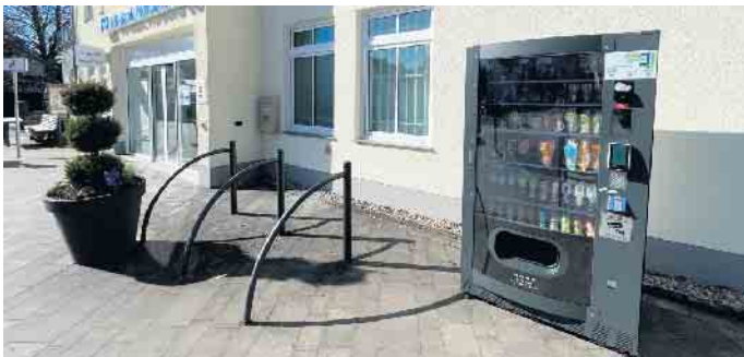
Vor der VR-Bank Nordeifel steht der Verkaufsautomat

Nachdem inzwischen an vielen Orten in der Region Verkaufsautomaten die Versorgung etwas ergänzen, gibt es auch in der Gemeinde Dahlem den ersten Automaten.