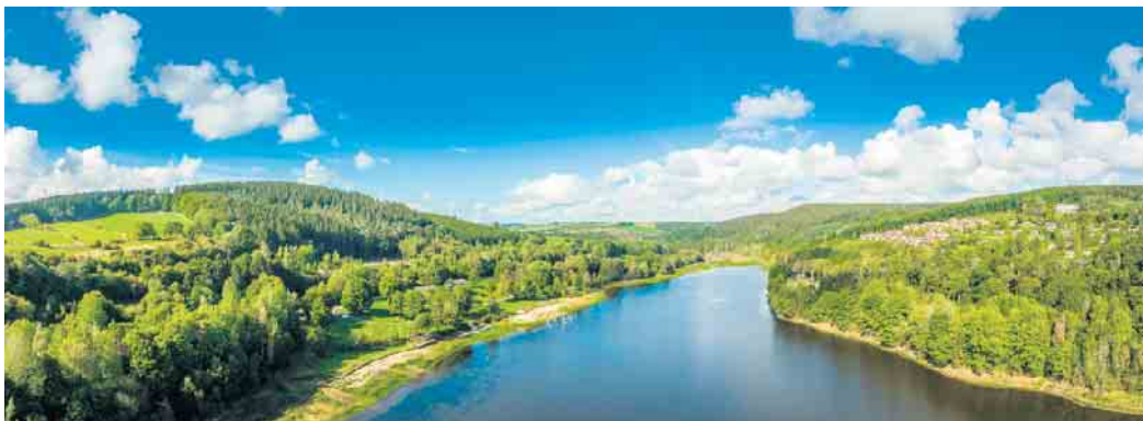
Der Kronenburger See im Süden des Kreises Euskirchen ist das größte Hochwasserschutzbauwerk im Verlauf der 128km langen Kyll.

Auswirkungen wie 2021 bei zukünftigen Hochwassern zu vermeiden. An langen Flüssen und in großen Einzugsgebieten müssen sich die Anrainer zusammenschließen, um eine durchgehende Vorsorge zu erhalten: Denn Wasser macht nicht an Verwaltungsgrenzen Halt. Mit der Unterzeichnung der Kooperationsvereinbarung zur Erstellung eines gemeinsamen Aktionsplans machen sich die Landkreise und Verbandsgemeinden entlang der „Kyll“ auf den Weg, eine derartige Vorsorge zu realisieren“. Für den Zweckverband Kronenburger See unterzeichnete Dahlems Bürgermeister Jan Lembach als Verbandsvorsteher des Zweckverbandes Kronenburger See die Vereinbarung. Die Kreisverwaltung Euskirchen vertrat der Allgemeiner Vertreter des Landrats Achim Blindert. Auch für diese beiden Kooperati-