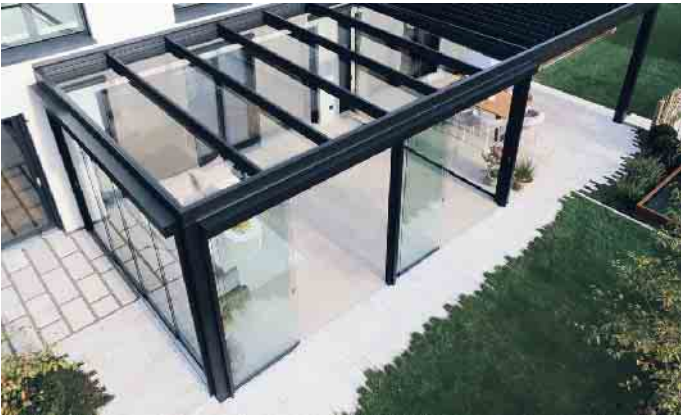
Das Lamellendach lässt sich mit einem Flachdach in einem Überdachungssystem kombinieren - und ist damit einzigartig.

Wetter- und sonnengeschützter Garten-Genuss