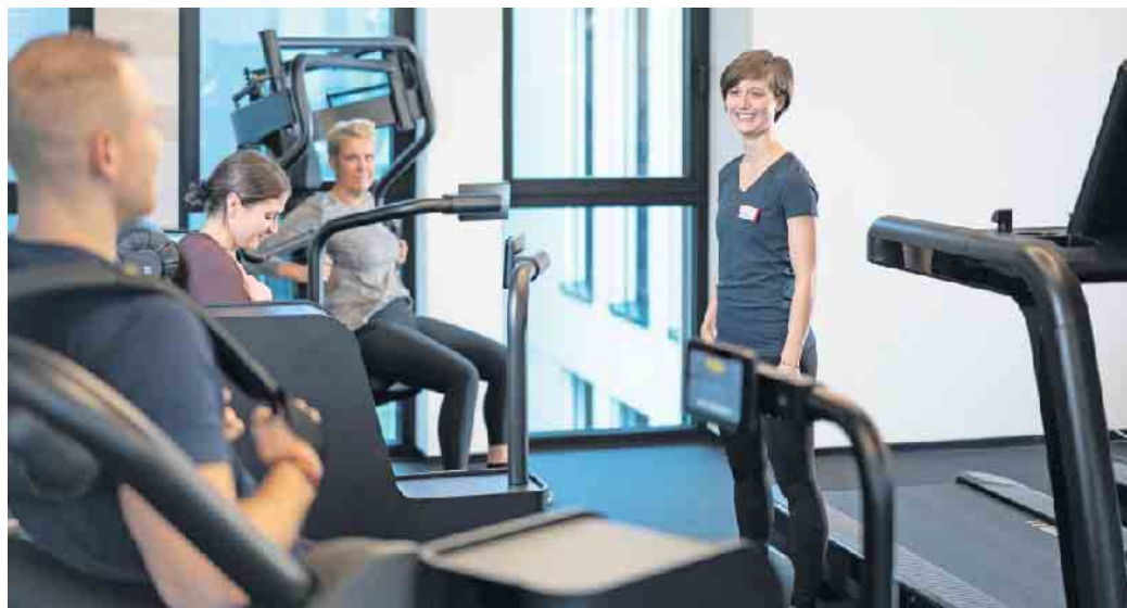
Fitness- und Gesundheitsanlagen etablieren sich zunehmend als elementare Bestandteile der Gesundheitsversorgung. Entsprechend gut muss die Ausbildung der Fachkräfte sein.

2023 hat sich der Wachstumstrend in gleicher Größenordnung fortgesetzt. (DJD)