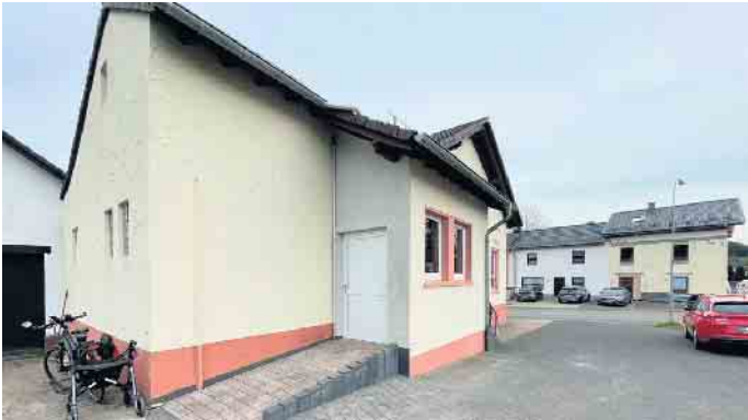
Jetzt auch durch die Gemeinde fertiggestellt ist der stufenlose Zugang zum Bürgerhaus Berk.