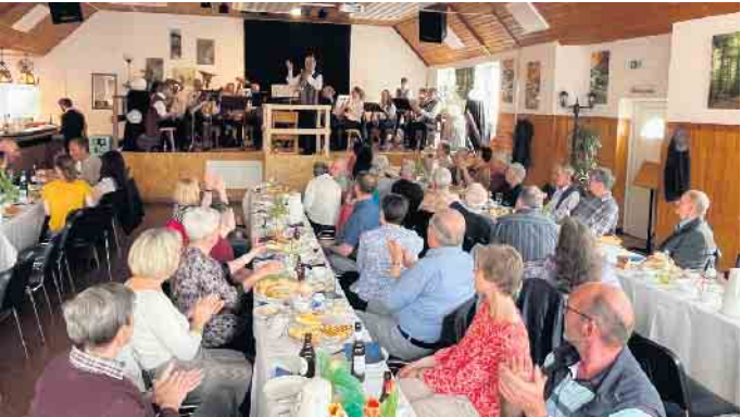
Gute Stimmung im Bürgerhaus Berk.

zugeht zeigten beide in einer lustigen Sketch-Einlage. Den Abschluss bildete auch wieder das beliebte Bilderrätsel. Es war ein schöner Nachmittag für alle Beteiligten. Und der herzliche Dank geht an die zahlreichen Menschen, die das Programm organisiert und vorgetragen und für die gute Bewirtung gesorgt haben.