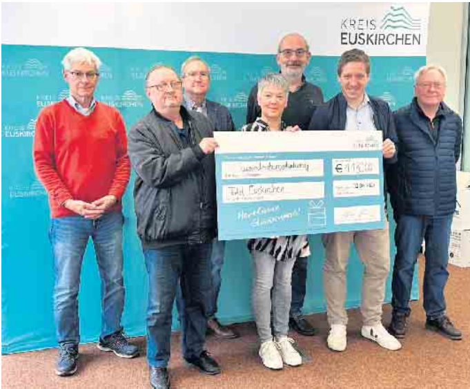
Über eine Spende von je 1.180 Euro durften sich die Tafeln aus Euskirchen, Zülrich, Weilerswist, Mechernich, Kall und Bad Münstereifel freuen.

renamtliche Arbeit der Tafeln unterstützt wird. Sie leisten einen großen Beitrag für bedürftige Menschen in unserer Gesellschaft.“ Die Vertreter der einzelnen Tafeln nutzten den Termin, um einen kurzen Einblick in die aktuelle Situation zu geben. Auch wenn sich die Lage je nach Tafel im Detail unterscheidet, so arbeiten sie doch alle am Limit. Aufgrund des Krieges in der Ukraine werden noch einmal viele zusätzliche Menschen versorgt, was sowohl personell wie auch materiell an Grenzen stößt. Viele Tafeln haben sogar schweren Herzens einen Aufnahmestopp verhängen müssen. Über die unerwartete Spende haben sie sich unisono sehr gefreut. Landrat Markus Ramers dankte ihnen für ihr Engagement. „Sie stellen sich Woche für Woche in den Dienst der bedürftigen Menschen und stehen dabei vor großen Herausforderungen. Dabei leisten die Ta-