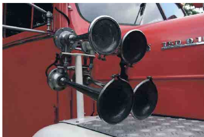
In Deutschland sind kreative Installationen von Schallerzeugern am Privatfahrzeug verboten.

Übrigens: Auch ein unerlaubtes oder mangelhaftes Schallzeichen, wie eine Melodie als Hupsignal, kann ein Bußgeld in Höhe von 15 Euro nach sich ziehen. Die Hupe muss ein akustisches Signal mit gleichbleibender Grundfrequenz erzeugen. Ausgenommen von dieser Regel sind Fahrzeuge mit Blaulicht, wie Polizei- und Rettungswagen und Feuerwehrautos. (mid/ak-o)