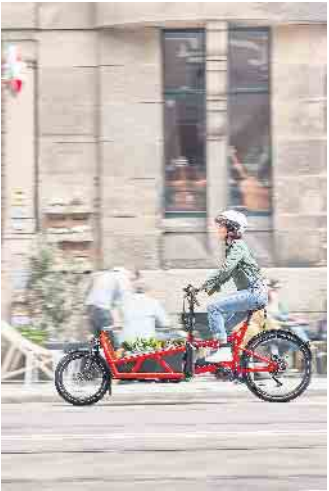
Die Kids zur Kita bringen oder den Einkauf nach Hause transportieren: E-Cargobikes sind eine nachhaltige, umweltfreundliche und kostengünstige Alternative zum Auto.

Genug Energie auch für längere Strecken Wichtig ist gerade bei elektrischen Lastenrädern ein leistungsstarker Akku, um angesichts des Eigengewichts und der transportierten Lasten eine hohe Reichweite zu ermöglichen. Praktisch ist zudem die Navigationsfunktion. Das vernetzte Display navigiert entspannt zum nächsten interessanten Ort, egal ob zu Ausflugszielen oder einem neuen angesagten Café. Praktisch sind dabei die Reichweiten-Hinweise, die automatisch berechnen, ob das Wunschziel mit elektrischer Unterstützung noch bequem erreicht werden kann. (djd)