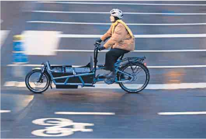
Mit dem E-Cargobike fährt man morgens entspannt am Stau im Berufsverkehr vorbei.

raum hinter dem Sattel befindet, lassen sich größere Kinder noch mitnehmen - das Rad wächst quasi mit dem Nachwuchs. Ebenso bieten die Lastenräder ausreichend Platz für den Wocheneinkauf, dank der elektrischen Unterstützung etwa des Cargo Line-Antriebs von Bosch eBike Systems werden selbst schwere Lasten bequem transportiert. Der Antrieb unterstützt in niedrigen Trittfrequenzen kraftvoll und sorgt so für Schub beim Anfahren oder Beschleunigen.