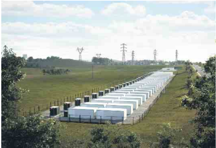
So wird die fertige Speicheranlage im Herbst 2026 aussehen und in Betrieb gehen.