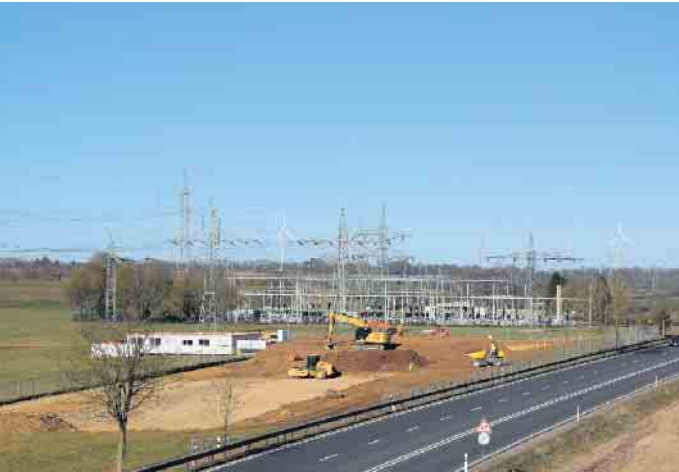
Derzeitiger Stand der Arbeiten von Süden gesehen, im Hintergrund das Umspannwerk, vorne die B 51.