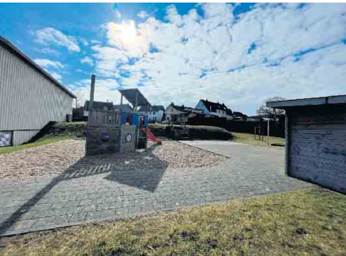
Der Kindergarten Schmidtheim