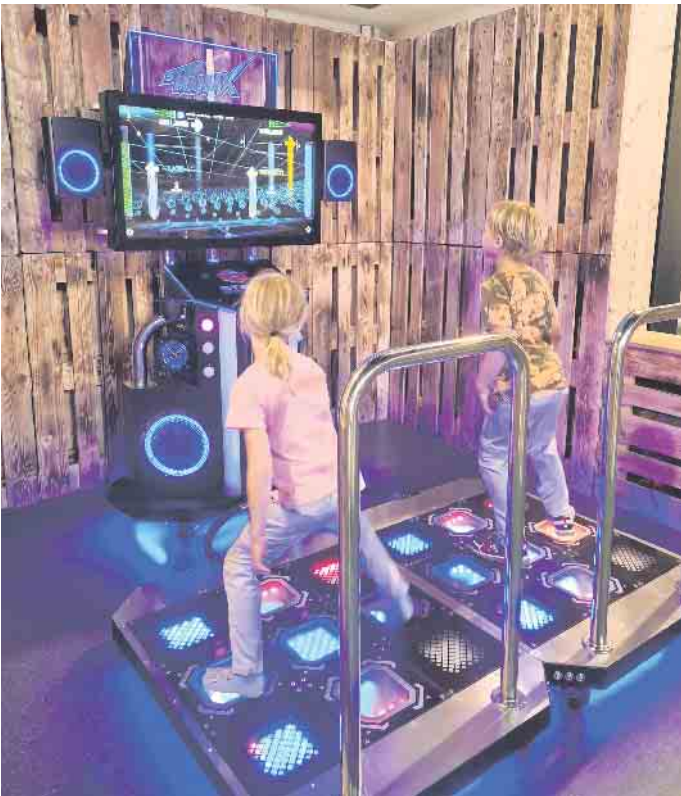
Spiel, Spaß und Bewegung: Kinder tauchen im ZikkZakk Spieleland in die Welt interaktiver Spiele ein. Das Osterferien-Programm bietet flutbetroffenen Kindern eine willkommene Auszeit voller Action und Abenteuer.

Für alle ab 1,30 m Körpergröße geht es am 23. April hoch hinaus: Im Kletterwald Brühl können Kinder und Jugendliche ihre Geschicklichkeit auf spannenden Parcours unter Beweis stellen und Nervenkitzel in luftiger Höhe erleben. Treffpunkt ist um 10.45 Uhr an der Liblarer Straße 183, am Wasserturm in Brühl. Für dieses Event ist der 16. April Anmeldeschluss. Für beide Angebote fällt eine Anmeldegebühr von 10 Euro an, die bei Teilnahme erstattet wird. Interessierte können sich per E-Mail unter fluthilfe@caritas-eu.de anmelden. Der Caritasverband für das Kreisdekanat Euskirchen freut sich auf viele abenteuerlustige Kinder und unvergessliche Erlebnisse in den Osterferien!