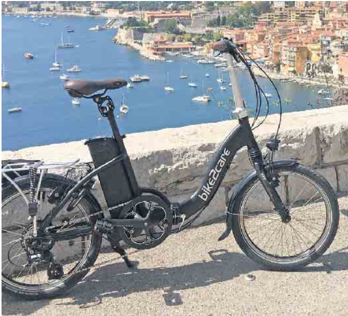
Urlaubsglück mit Ausblick: Auch im Urlaub sorgen die kompakten E-Falträder für viel Bewegungsfreiheit.