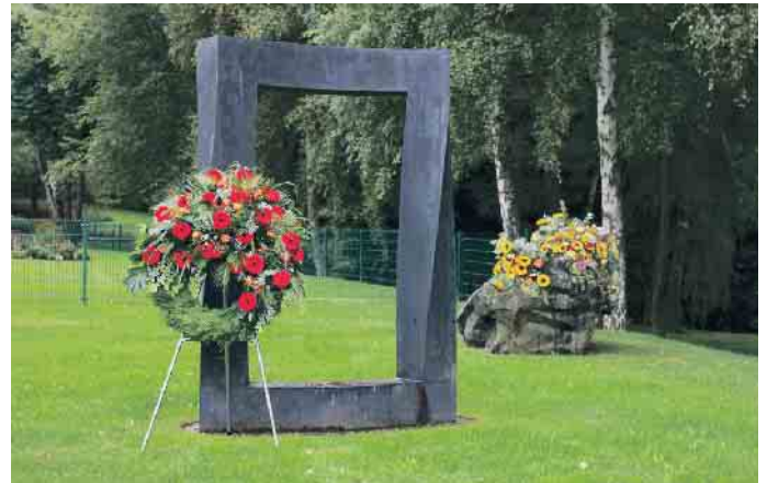
Tor zwischen den Welten.

Früher waren Krankheit, Sterben und Tod in der Großfamilie unter einem Dach vereint, genauso wie Romanze, Heirat und Geburt. Heute haben viele Menschen nie lernen und auch nie erfahren können, was Sterben und Tod bedeuten und wie sie von einem geliebten Menschen Abschied nehmen und richtig trauern können. Hinzu kommt, dass viele Angehörige nicht mehr an einem einzigen Ort leben und kaum einen Bezug zum örtlichen Friedhof haben. Mit der Trauer kommt die schmerzliche Erkenntnis der Endlichkeit. Die Einsicht reift, dass ein Partner, Freund oder Verwandter nach einem Todesfall tatsächlich nicht mehr da ist. Viele Bereiche des täglichen Lebens werden nicht mehr so sein wie bisher. Diese Einsicht ist oft so schmerzhaft, dass Menschen manchmal meinen, im Trauerfall besonders stark sein zu müssen, oder versuchen, sich anders abzulenken. Dabei ist es wichtig, die Trauer und damit auch den Schmerz zuzulassen, um den persönlichen Weg der Trauerbewältigung besser finden können.