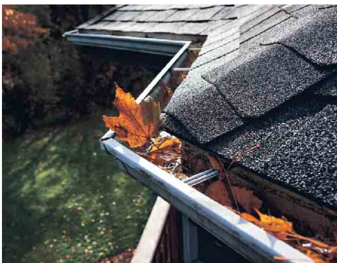
Reinigung der Dachrinne gehört auch zum DachCheck.

Für Eigenheimbesitzer, die eine Photovoltaikanlage auf dem Dach haben, ist eine zusätzliche Wartung besonders wichtig. Solarmodule können durch Schmutz, Laub oder Schnee an Effizienz verlieren. Regelmäßige Überprüfungen und gegebenenfalls eine professionelle Reinigung sorgen dafür, dass die Module den optimalen Stromertrag liefern. Der DachCheck Plus der Fachbetriebe des Dachdeckerhandwerks bietet diese umfassende Überprüfung gleich mit an: So werden neben dem Dach auch die Solaranlage und deren Einzelkomponenten auf Verschleiß oder Defekte geprüft. Mit dem DachCheck und DachCheck Plus sind Bauherren und Hauseigentümer auf der sicheren Seite. (akz-o)