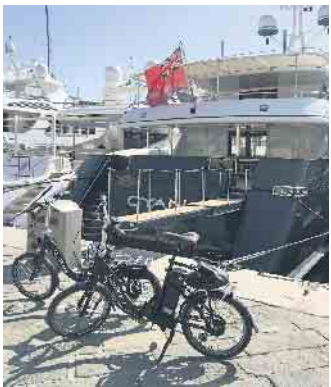
Ein deutliches Plus an bequemer Mobilität vor Ort gewinnt, wer ein kompaktes E-Faltrad am Urlaubsziel nutzen kann.

Auch in den deutschen Großstädten sind E-Falträder die perfekte Lösung für mobile Städter. Im Gegensatz zu Fahrrädern dürfen sie in Bussen und Bahnen überall mitgenommen werden, ein Extraticket ist ebenfalls nicht nötig. Zu Stoßzeiten sind öffentliche Verkehrsmittel ohnehin meist so voll, dass Fahrräder nur mit Mühe transportiert werden können, für das Faltrad findet man immer ein Plätzchen. Das gilt allerdings auch nur dann, wenn das Faltrad qualitativ hochwertig ist und entsprechend schnell und bequem klein gemacht werden kann. (djd)