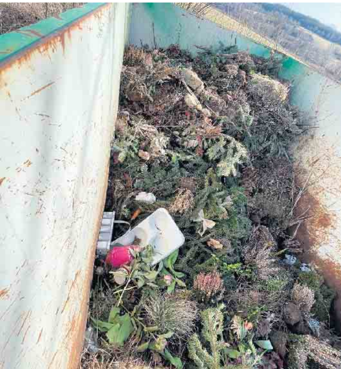
Warum wird dieser Müll in den Grünabfall-Container geworfen?!

Dafür steht eben der Restmüll zur Verfügung. Diese Mülltrennung sollten die Menschen an den Friedhöfen befolgen.