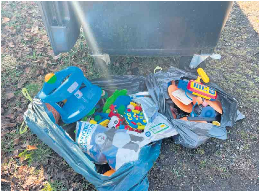
In der letzten Woche wurden gut erhaltene Spielsachen im Restmüllcontainer am Friedhof Schmidtheim entsorgt.