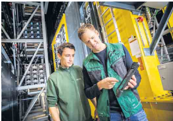
Die Ausbildung zur Fachkraft für Lagerlogistik in der Brauerei dauert drei Jahre, Voraussetzung ist ein Hauptschulabschluss. Foto: DJD/Veltins

Der innerbetriebliche Transport erfolgt mit modernen Flurfördermitteln, die eingesetzten Gabelstapler können sechs Paletten gleichzeitig transportieren. Foto: DJD/Veltins