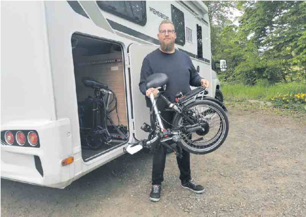
E-Falträder werden durch einen leistungsfähigen Elektromotor angetrieben und lassen sich in der Mitte bequem zu einer handlichen, leicht transportablen Größe zusammenklappen.