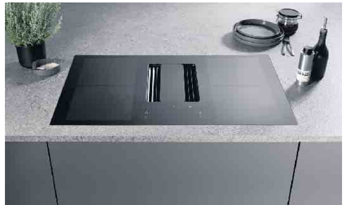
Prämierte, kompakte 2in1-Einheit, z. B. ideal für Kochinseln, ausgestattet mit einem leistungsstarken, energieeffizienten Lüftungskonzept und einem regenerativen Filtersystem. Optional mit schicker Drehknebelsteuerung.

„Die zunehmende Urbanisierung und damit verbundene Verdichtung in Ballungsräumen führt dazu, dass Wohnräume in Zukunft kleiner ausfallen“, konstatiert Volker Irlé. Hier sind platzsparende, funktionale Lösungen gefragt, beispielsweise dezente bis nahezu unsichtbar integrierte Lüftungskonzepte: z. B. vollintegrierte Dunstabzugshauben, die flächenbündig in einen Oberschrank über dem Kochfeld eingebaut werden. Bei geschlossener Möbelfront (mit Schranktür oder praktischem Klappensystem) sind sie