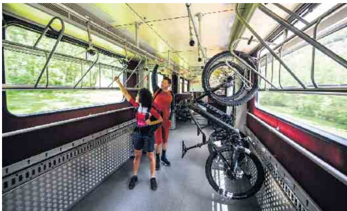
Auch mit der Bahn lassen sich E-Bikes an den Urlaubsort transportieren.

Ein Check von Bremsen, Reifen, Schaltung, Federsystem, Pedalen, Schuhen und Helm vor dem Start sollte selbstverständlich sein. Bei der Kleidung hat sich das Zwiebelprinzip mit mehreren Schichten bewährt: luftig und leicht für bergauf, winddicht für bergab. Ein Rucksack mit Akkufach eignet sich, um einen Zweitakku oder ein Ladegerät sicher zu verstauen. Für kleinere Reparaturen empfiehlt es sich, ein Multitool, einen Ersatzschlauch und eine Luftpumpe im Gepäck zu haben. Bei der Routenwahl sollten Urlauber nicht nur die individuelle Fitness, sondern auch eigene Präferenzen, etwa bei der Tourenauswahl, beachten. Vernetzte Displays wie „Nyon“ von Bosch bieten die Möglichkeit, Routen vorab zu planen und zu navigieren. Für den Transport von E-Bikes zum