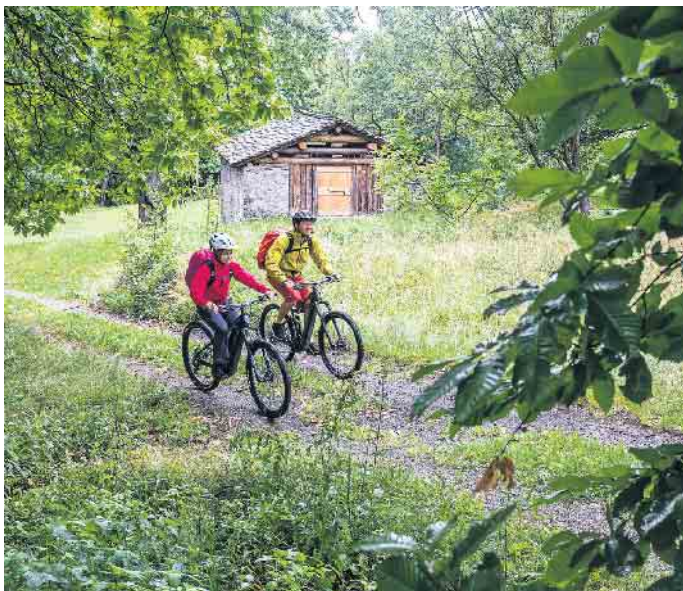
Genug Power für jede Etappe: Vernetzte Bordcomputer helfen bei der Tourenplanung und der Nutzung der Akku-Kapazitäten.