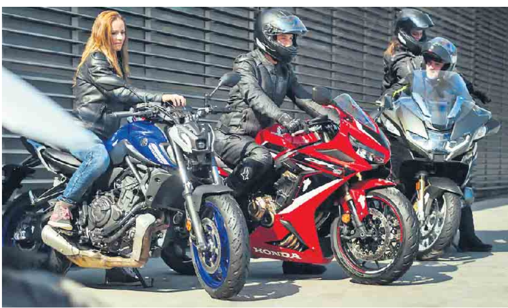
Die Freiheit auf zwei Rädern genießen - hochwertige und gut gepflegte Reifen sorgen dabei für ein sicheres Vergnügen.