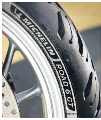
Hochwertige Motorradreifen verbinden eine hohe Laufleistung, Komfort, Handling sowie einen sehr guten Nassgrip miteinander.

Das Gefühl der Freiheit im Sattel genießen, mit jedem Kilometer Straße den Alltag weiter hinter sich lassen: Passionierte Motorradfahrer lieben dieses Gefühl. Bei aller Abenteuerlust darf natürlich die Sicherheit nicht auf der Strecke bleiben. Dafür sorgen Biker, indem sie ihre Maschine regelmäßig warten und pflegen sowie insbesondere auf Bremsen, Beleuchtung und Reifen regelmäßig ein wachsames Auge werfen. Schließlich sollen die Gummis für guten Grip in jeder Situation sorgen und sollten sich daher stets in sehr gutem Zustand befinden.