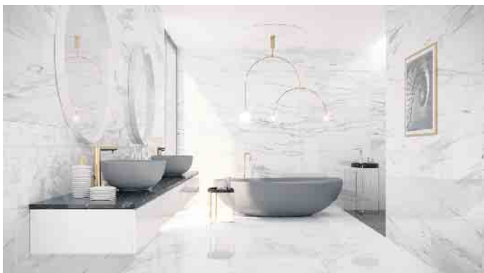
Der persönliche Lebensstil spiegelt sich auch in der Badeinrichtung wider.

Mit zeitlos-schönem Fliesendesign in den Kollektionen deutscher Fliesenhersteller findet sich das passende Design für jeden Geschmack. Sogar höchst individuelle Einrichtungskonzepte lassen sich heute mit Fliesen umsetzen. Denn nicht nur Farben und Dekore, sondern auch Formate und die Haptik sind vielfältig wie nie zuvor. Unter www.deutsche-fliese.de gibt es viele Tipps, Inspirationen zu den aktuellen Fliesentrends und weiterführende Links. Im Trend liegen XXL-Fliesen und neue sogenannte Megaformate, mit denen sich beispielsweise die Wände im Duschbereich fugenlos oder fugenarm gestalten lassen. Fliesen im urbanen Beton- oder Estrichlook unterstreichen architektonisch-minimalistische Einrichtungskonzepte. Wohnlich-gemütlich wirken Fliesen in Holzoptik, die heute mit haptisch ansprechenden, authentischen Maserungen der Oberfläche angeboten werden. So lassen sich die neuen Holzfliesen kaum vom Original unterscheiden. Zugleich sind sie auf Dauer feuchtigkeitsbeständig und rutschhemmend - das ist ideal für die bodenebene Dusche. (djd)