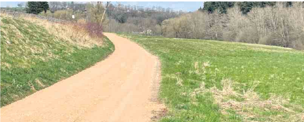
Mit der Sanierung des Fahrradweges Richtung Jünkerath wurde bereits begonnen.

Gemeinde in einen guten Zustand für die nächsten Jahrzehnte versetzt werden.