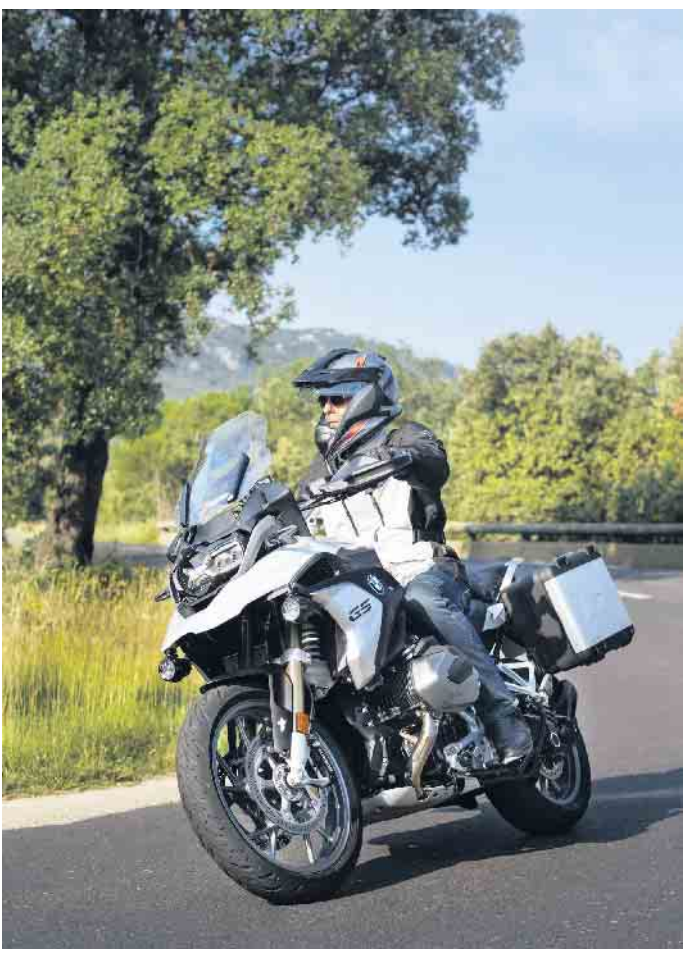
Für genug Grip sollten Biker den Reifenfülldruck alle 14 Tage überprüfen.

Für Biker gibt es kaum Schöneres als eine Tagestour mit Freunden, bei der man besondere Augenblicke teilt. Gute Reifen verbinden dabei Fahrspaß mit Sicherheit und Komfort. Allgemein dürfen Reifen gefahren werden, bis die gesetzliche Verschleißgrenze von 1,6 Millimetern Profiltiefe erreicht ist oder Alterungsspuren sichtbar