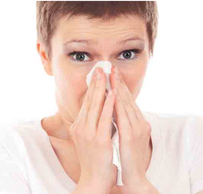
Wer sich mit einer Pollenallergie ans Steuer oder Lenkrad setzt, kann aufgrund von Allergiesymptomen unaufmerksam sein.

Wer besonders stark von Heuschnupfen geplagt ist, sollte sich im Frühjahr und Sommer online mithilfe der Daten des Deutschen Wetterdienstes oder der Stiftung Deutscher Polleninformationsdienst über den regionalen Pollenflug informieren. An Tagen mit besonders hohem Allergierisiko empfiehlt es sich, auf vermeidbare Fahrten im Auto oder auf dem Rad ganz zu verzichten. (mid/ak-o)