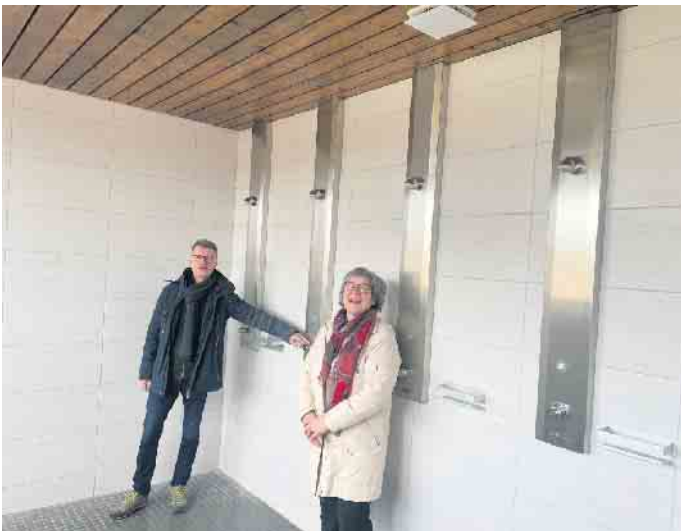
Eine gute Nachricht für die Sportler auf dem Sportplatz Dahlem: Das Duschen im Sportlerheim macht wieder Spaß.

den benachbarten Orten nutzen gerne und umfangreich diese Sportangebote.