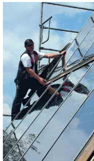
Photovoltaik: Dachdecker wissen, was zu tun ist. Foto: HF. Redaktion Harald Friedrich/akz-o

zen. Dachdecker und Dachdeckerinnen wissen um die Gefahr: Sie führen eine Gefährdungsanalyse durch, sichern sich vor Absturz und gehen keine Risiken ein. Arbeitsschutzmaßnahmen sind daher unerlässlich. Übrigens: Auch Auftraggebende können haftbar gemacht werden. Es häufen sich Fälle, wo Baustellen wegen Nichtbeachtung von Arbeitsschutzmaßnahmen stillgelegt werden. Das kostet Nerven, Zeit und Geld. Dachdeckerfachbetriebe haben die Erfahrung und Routine, all die genannten Punkte umzusetzen. Sie beraten, führen alle Arbeiten fachgerecht durch und bauen in Kooperation mit Betrieben aus dem Elektro-Handwerk sichere und nachhaltige Anlagen ein. Auch kennen sie sich mit den aktuellen Förderprogrammen aus. (akz-o)