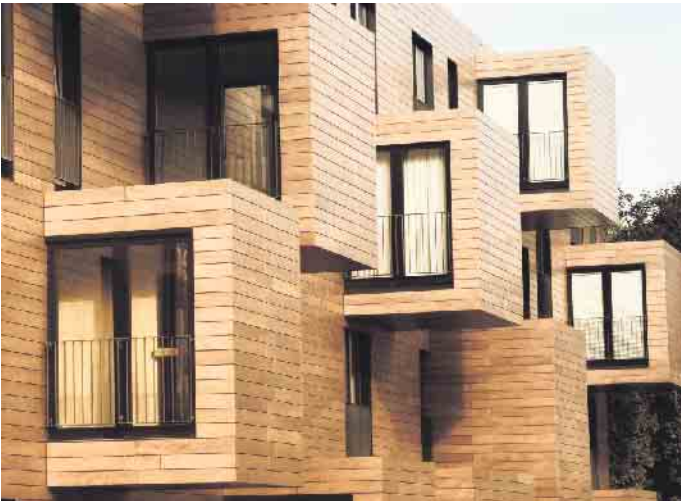
Holz zählt zu den ältesten Baumaterialien, die der Mensch nutzt - und ist unter Aspekten des Klimaschutzes gleichzeitig Rohstoff der Zukunft.

Wichtig für die Klimabilanz ist es zudem, dass das verwendete Holz aus nachhaltiger Waldbewirtschaftung stammt. Dazu sollte man auf die Herkunft und entsprechende Zertifizierungen achten. „Wer Holzprodukte benötigt, sollte zum örtlichen Fachhändler gehen, der garantiert nur Material aus unbedenklichen Quellen verkauft“, rät Thomas Goebel. Die Europäische Holzhandelsverordnung (EUTR) etwa schreibt vor, dass der legale Ursprung des Holzes nachgewiesen werden muss - das gilt sowohl für einheimisches als auch importiertes Holz. Ergänzend sorgen Zertifizierungssysteme wie PEFC und FSC für Transparenz. Unter www.holzvomfach.de gibt es dazu mehr Informationen sowie weitere Tipps zum nachhaltigen und klimaschonenden Bauen. (djd)