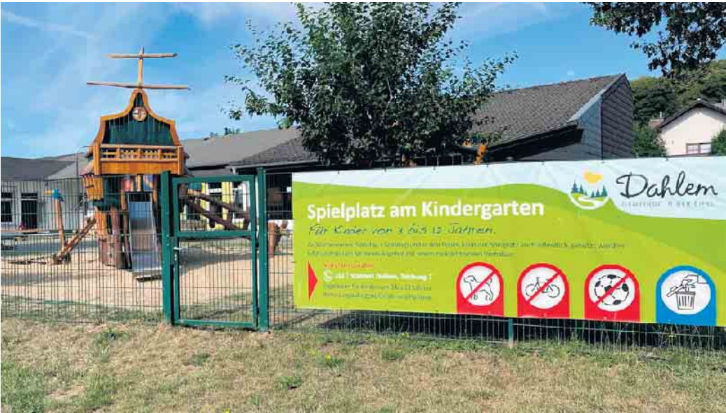
Der Kindergarten Dahlem mit dem tollen Piratenschiff.

Auf den Spielplätzen der Kindergärten wurden und werden immer wieder Erneuerungen und Erweiterungen umgesetzt. Damit möglichst viele Familien diese erlebnisreichen Spielplätze nutzen können, werden diese wie jedes Jahr ab dem 12.04.2025 und bis zum Herbst an Wochenenden (Samstag + Sonntag) und in den Ferien (alle Wochentage) für alle Bürgerinnen und Bürger geöffnet. Die Kinder und die Eltern werden um ein rücksichtsvolles Verhalten gebeten, damit der tolle Spiel-