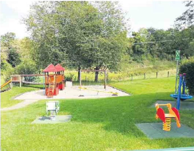
Der erweiterte Spielplatz im Kindergarten Berk