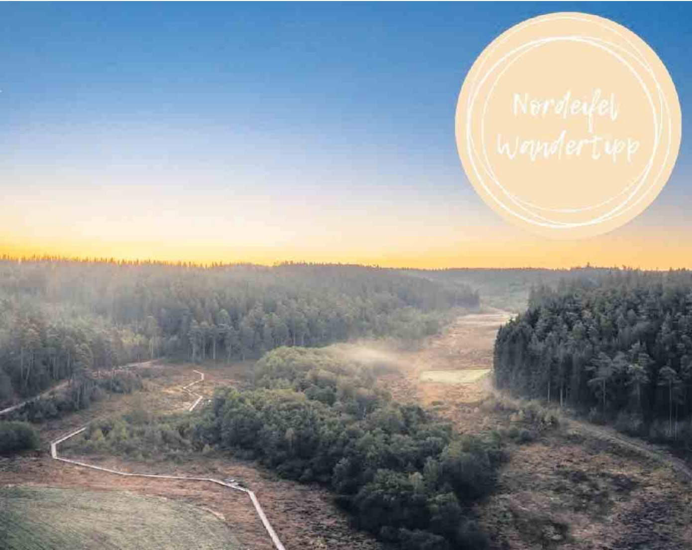
„Moorpfad Dahlem“ - auch zu dieser Jahreszeit eine schöne Wanderung.

kehrsordnung nicht zulässig ist. Bitte helfen Sie aktiv mit, das Bild der Reiter und Pferdehalter in der Öffentlichkeit positiv darzustellen. Ein rücksichtsvolles und vorbildliches Auftreten wird hierbei stets als angenehm empfunden. Jan Lembach Bürgermeister