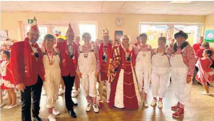
Besuch der Tagespflege St. Anna

gutekommt. Im Anschluss daran konnte die KG den Seniorinnen und Senioren der Tagespflege St. Anna ebenfalls einen jecken Nachmittag beschenken und gemeinsam mit ihnen Karneval feiern. Der Abschluss des Weiberdonnerstags fand auf der Möhnensitzung im Vereinshaus statt, wo in diesem Jahr „Dahlem’s next Top Möhn“ gesucht wurde. Das tolle Programm der Möhnen rundete den Tag perfekt ab.