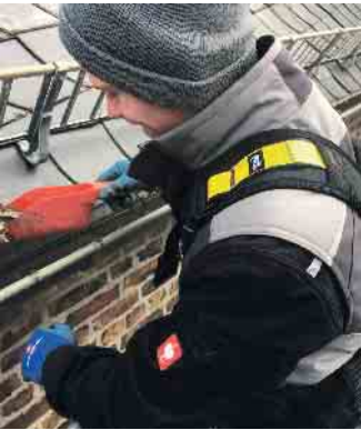
Bei einem Wartungsvertrag können bestimmte Leistungen und Reparaturen beim DachCheck integriert werden.

lungsbedarf. Auch hier sollten Fachbetriebe zu Rate gezogen werden. Die fachgerechte Montage von Solaranlagen auf dem Dach ist entscheidend für Wirkungsgrad und Haltbarkeit, ebenso wie die regelmäßige Überprüfung der Anlage. Innungsbetriebe des Dachdeckerhandwerks sind auf der ZVDH-Verbandsseite zu finden: https://dachdecker.org/hausbesitzer/betriebe/ (akz-o)