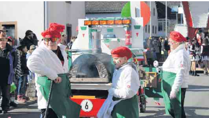
Auf dem Zug wurde sogar frische Pizza gebacken