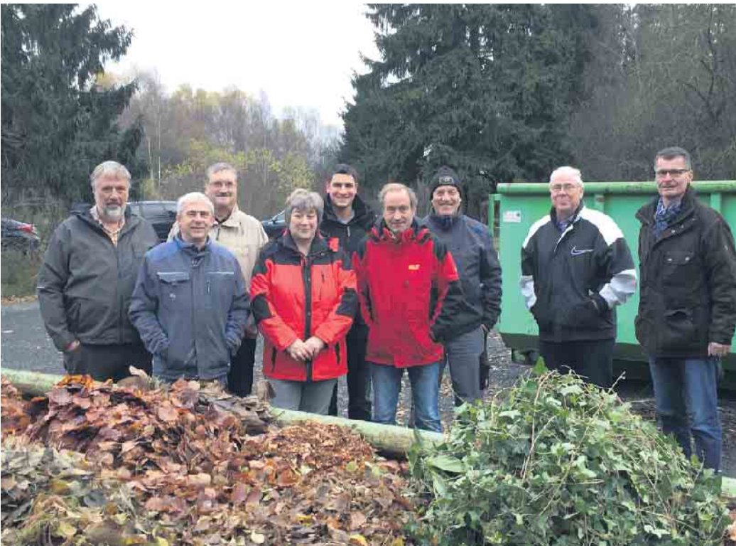
Das Startteam für den Grünabfall-Sammelplatz vor 10 Jahren.

Die Entsorgung des Materials ist für die Bürgerinnen und Bürger denkbar einfach und kostenlos. Es wird seitdem viel weniger Grünabfall in die Landschaft gebracht.