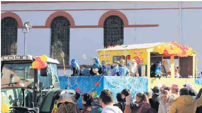
Mottowagen „Dann schwimm doch zu Netto!“