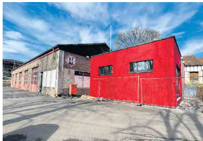
Unübersehbar Feuerwehr, der Anbau am Feuerwehrgerätehaus Schmidtheim.

Urft verbessert. Für das Projekt konnte die Gemeindeverwaltung noch einmal eine NRW-Förderung gewinnen. Aber auch aus dem Gemeindehaushalt ist eine erhebliche Teilfinanzierung erforderlich. Dafür erhält die Feuerwehr Schmidtheim für die Zukunft ein angemessenes Gerätehaus, für das engagierte Feuerwehr-Team und für die gute Ausstattung von Fahrzeugen und Gerätschaften. Die Fertigstellung wird in einigen Wochen erfolgt sein. www.feuerwehr-schmidtheim.de