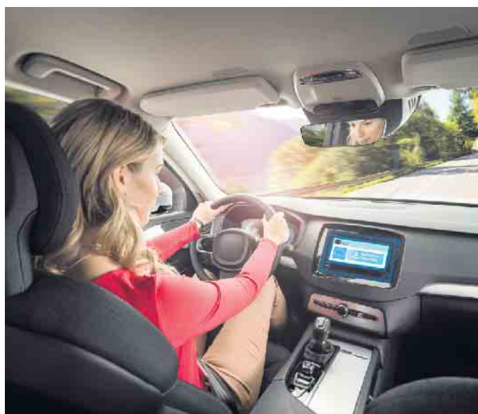
Moderne Software-Systeme und vielfältige Anwendungen machen aus dem Auto einen Computer auf vier Rädern.

Autos entwickeln sich zu digitalen Plattformen, die sich laufend