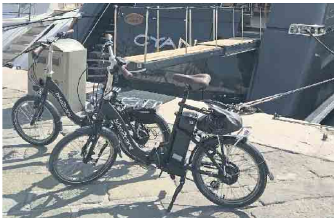
Im Urlaub sind die kompakten E-Falträder ideale Begleiter.

und 80er-Jahren wenig zu tun. Sie lassen sich zwar noch immer in der Mitte zu einer handlichen, leicht transportablen Größe zusammenklappen, nunmehr ist allerdings auch ein leistungsfähiger Elektromotor als Zusatzantrieb eingebaut. Solche E-Falträder lassen sich in jedem Wohnmobil und im Kofferraum der meisten Autos transportieren, ein spezieller Fahrradträger ist nicht nötig. Wichtig ist dabei auch das Gefühl der Sicherheit. Dafür sorgen der tiefe Einstieg der Räder und die Tatsache, dass man mit beiden Füßen sicher auf den Boden kommt. Vom Anbieter bike2care etwa gibt es zudem komfortable und bequeme E-Falträder mit und ohne Rücktrittsbremse. Das Design hat einen Hauch von Retro-Chic, die ver-