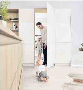
Ganz kurze Wege und 1A versteckt: Mit dieser zwischen zwei Hochschränke geplanten und integrierten Durchgangstür kann die junge Familie schnell zwischen ihrer Wohnküche und dem angrenzenden praktischen Hauswirtschafts- sowie Vorratsbereich hin- und herwechseln.

dezenten Schienensystems schwebelicht daran entlang. Insbesondere kleine Räume profitieren von solchen Lösungen, da keine Grundfläche für aufschwingende Türen freigehalten werden muss. Oder wenn z. B. ein separater Homeoffice- oder Laundry-Bereich in einer Ecke oder Nische in die Wohnküche integriert werden soll. In Kombination mit Hochschränken und/oder Regalsystemen ergeben sich weitere schicke, architektonische Lösungen: wenn beispielsweise ein paar imposante, großformatige Gleitüren so flexibel ver- und übereinander geschoben werden, dass bestimmte Schrank- & Regalbereiche offen, andere dagegen geschlossen oder nur zum Teil einsehbar sind. Raffinierte Gestaltungs- und