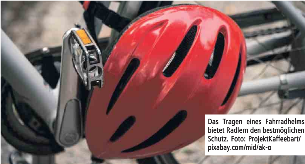
Das Tragen eines Fahrradhelms bietet Radlern den bestmöglichen Schutz.

Hierauf kommt es beim Kauf an: Da Helme in verschiedenen Größen erworben werden können, sollte vor dem Kauf der Kopfumfang gemessen werden. Um den richtigen Umfang zu ermitteln, sollten Sie 2,5 Zentimeter über den Augenbrauen ansetzen und ein Maßband möglichst gerade um den Kopf ziehen. Neben der richtigen Größe ist auch der passende Sitz entscheidend. Der Helm sollte etwa 2,5 Zentimeter über den Augenbrauen sitzen. Achten Sie also darauf, dass der Helm nicht zu weit im Nacken sitzt und die Stirn ungeschützt bleibt. Die meisten Helme können zusätzlich an die Kopfgröße und -form angepasst werden. Neben der Größe bieten Helme weitere Einstellungsmöglichkeiten wie Kopf- oder Kinnriemen. Sie sollten festsitzen, aber kein beengendes Gefühl geben. Vor allem Stirn, Schläfen und Hinterkopf sollten vom Helm gut geschützt sein. Eine Mindestanforderung ist das CE-Kennzeichen, das vom Hersteller selbst vergeben wird und angibt, dass der Helm den geltenden Anforderungen genügt. Wer sich nicht allein auf die Selbsterklärung des Herstellers