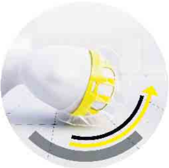
Durch Rotationsbewegungen kann es beim Sturz zu Hirnverletzungen kommen. Eine reibungsarme Schale im Helm soll diese Wirkung reduzieren.

ist der „stärkere“ Verkehrsteilnehmer. Zudem gefragt sind eine besondere Aufmerksamkeit beim Rechtsabbiegen sowie gute Sichtbarkeit durch Licht und Reflektoren, besonders bei Regen und Dunkelheit. (DJD)