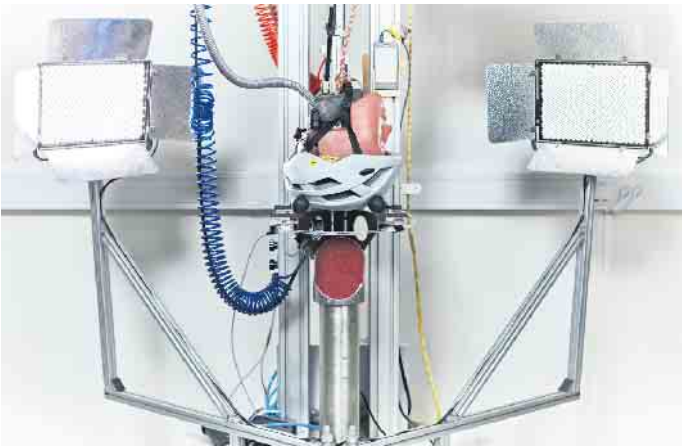
Helme werden in der Regel nur darauf geprüft, ob sie einem geraden Aufprall standhalten. Meist erfolgt der Aufprall jedoch schräg, was gefährliche Rotationsbewegungen verursachen kann.

der Fahrradsaison 2024 auf volle Sicherheit zu setzen. Dazu gehört ein optimal passender Helm, denn immer noch steigen 53 Prozent der Radl-Fans ohne Kopfschutz auf den Sattel. Allerdings ist Helm nicht gleich Helm. Die meisten Helme werden nur für den Fall eines linearen Aufpralls auf ihre Sicherheit getestet. Der Aufprall des Kopfes erfolgt bei einem Sturz aber meist nicht linear, sondern in einem Winkel. Dabei können gefährliche Rotationsbewegungen hervorgerufen und auf den Kopf des Fahrers übertragen werden. Gravierende Verletzungen durch Rotation