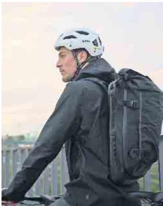
Zertifizierte, optimal passende Helme können schwerere Kopfverletzungen oft verhindern.

Generell sollte man Unfällen und Stürzen bestmöglich vorbeugen. Dazu gehört, sich an die Straßenverkehrsordnung zu halten und sich als Fahrradfahrer eher defensiv zu verhalten, denn das Auto