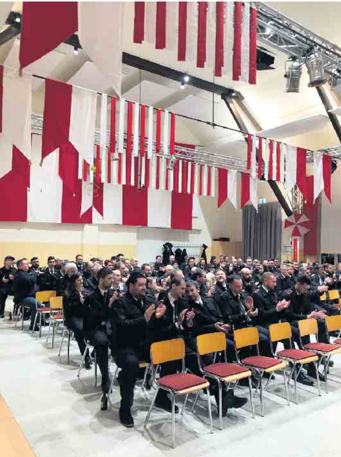
...und die Kameradinnen und Kameraden aus allen 6 Wehren.