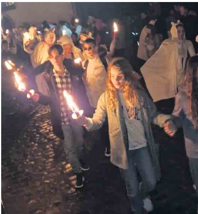
Besuch und Mitwirkung am „Geisterzug“ in Blankenheim war für die jungen französischen Gäste (im Vordergrund) ein eindrucksvolles Erlebnis.