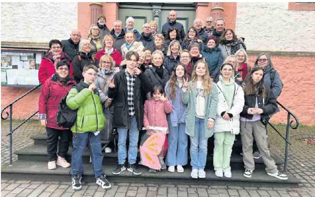
Das Gruppenfoto der Gäste und Gastgeber beim Besuch in Bad Münstereifel.

Am Samstag konnten sich alle von der Wiederaufbauleistung und den noch vorhandenen Spuren der Flut von Juli 2021, aber auch der Schönheit der Stadt Bad Münstereifel überzeugen.