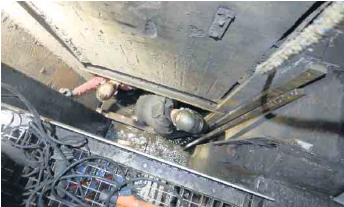
Die tatsächlichen Arbeiten müssen am Grund der Staumauer rund 10 Meter tief und sehr beengt ausgeführt werden.

setzung der aufwendigen Sanierung der Talsperrentechnik. Derzeit befinden sich 12 einzelne Gewerke in der Planung oder in der Abwicklung. Die so genannten Betriebsschütze und die dazugehörigen Antriebe sind derzeit die umfangreichsten Einzelmaßnahmen. Fischer berichtete, dass die Sanierung unter erschwerten Rahmenbedingungen stattfindet: Bei der Errichtung der Hochwasserschutzanlage Anfang der 1970er Jahre wurde offensichtlich nicht genau auf die geplante Bauausführung geachtet. Wichtige Details am Bauwerk stimmen nicht mit den Plänen überein, sodass jedes Maß neu ermittelt werden muss. Darüber hinaus mussten immer wieder weitere Erneuerungen in die Sanierung aufgenommen werden. Inzwischen beläuft sich das finanzielle Gesamtbudget der Sa-