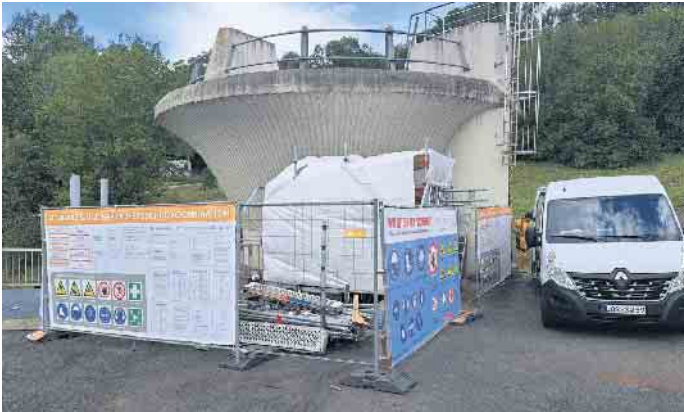
An der Staumauer ist die Sanierungsbaustelle eher unscheinbar.