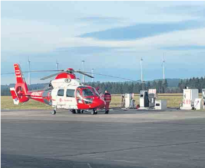
Der Hubschrauber Air Rescue Nürburgring an der Tankstelle auf dem Flugplatz Dahlemer Binz.

Der Flugplatz Dahlemer Binz ist seit mehreren Jahrzehnten genehmigt und ausgewiesen als „Verkehrslandeplatz“ und hat in dieser Kategorie weiterhin eine überregionale Bedeutung im Süden von NRW. Innerhalb von NRW gibt es neben dem Dahlemer Flugplatz 20 weitere Verkehrslandeplätze. Der Platz wird vor allem von den dort tätigen 12 Flugsportvereinen für den Segelflugsport sowie von den Motorfliegern in Freizeitbetrieb genutzt. Weiterhin steuern vielfach Flieger von benachbarten Flugplätzen auf Rund- und Schulflügen oder zum Auftanken ‚die Binz‘ an. Darüber hinaus hat der Flugplatz auch wichtige Funktionen für die Region. Die Bundespolizei übt hier regelmäßig mit Hubschraubern im