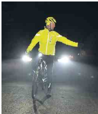
Reflektoren an der Kleidung sind in der dunklen Jahreszeit angesagt.

weise dem Wetter und den Sichtverhältnissen anpassen, langsamer und vorausschauend fahren. Durch saubere Frontscheiben und Scheinwerfer sowie funktionsfähige Wischerblätter kann die Sicht deutlich verbessert werden. (mid/ak-o)