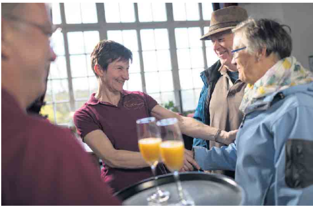
Seniorenmittagstisch in der historischen Villa Kronenburg

Ein neues Angebot für Senioren bereichert Dahlem: Ab dem 13. Februar lädt die Villa Kronenburg jeden Donnerstag von 12 bis 14 Uhr alle Seniorinnen und Senioren zu einem geselligen Mittagstisch ein. Genießen Sie, gerne auch mit Familienangehörigen, ein frisch zubereitetes Hauptgericht (13,90 Euro) und optional eine Suppe vorweg. Im Anschluss kann der Nachmittag bei Kaffee und selbstgebackenem Kuchen gemütlich ausklingen. Die Villa Kronenburg ist das frühere Eifelhaus im Burgbering in Kronenburg gelegen. Um Voranmeldung unter Telefon 06557 295 wird gebeten.