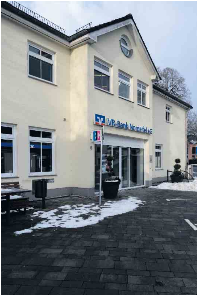
Die Eingangstür wurde komplett erneut und verfügt über eine hochmoderne Verriegelungstechnik. Ab dem 19. Februar können Bank-Kunden hier wieder ein- und ausgehen.