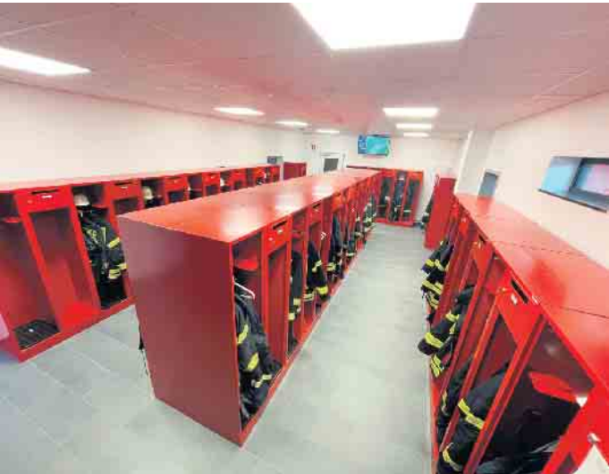
Blick in den großen Umkleideraum...