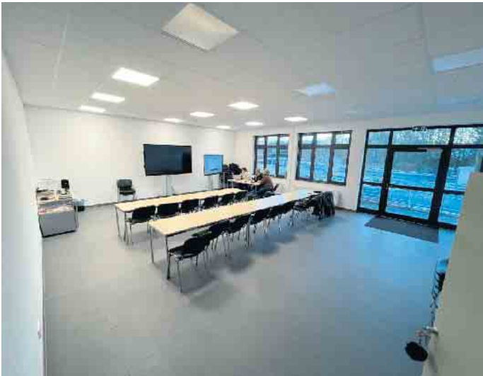
...und den Versammlungs- und Schulungsraum. © Gemeinde Dahlem