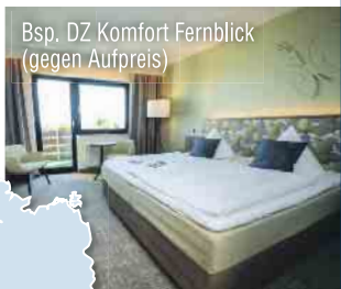
Bsp. DZ Komfort Fernblick (gegen Aufpreis)