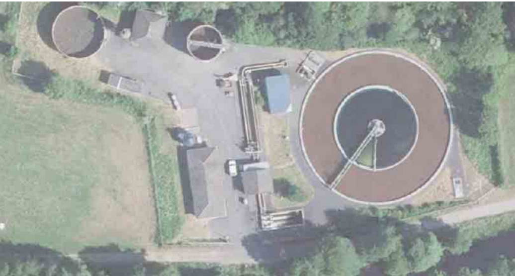
Kläranlage Kronenburg

ten sehr rentabel, da es dort einen konstant hohen Tagesstromverbrauch gibt. Auch für diese Maßnahme hat sich die Gemeindeverwaltung erfolgreich um Fördermittel bemüht und erhält eine 90%ige finanzielle Unterstützung für die Gesamtkosten von rund 150.000€. In diesem Jahr werden auf den Dächern der Betriebsgebäude PV-Module mit einer Gesamtleistung von 60kWp montiert, die jährlich rund 40.000kWh umweltfreundlichen Sonnenstrom für die Stromverbraucher der Kläranlagen liefern sollen. Die gesamte Stromproduktion aus den PV-Anlagen kann vor Ort genutzt werden. Damit hat dieses kommunale Projekt direkte ökologische und wirtschaftliche Auswirkungen. Neben der umweltschonenden Stromerzeugung muss ein Teil der Stromversorgung nicht mehr eingekauft werden.