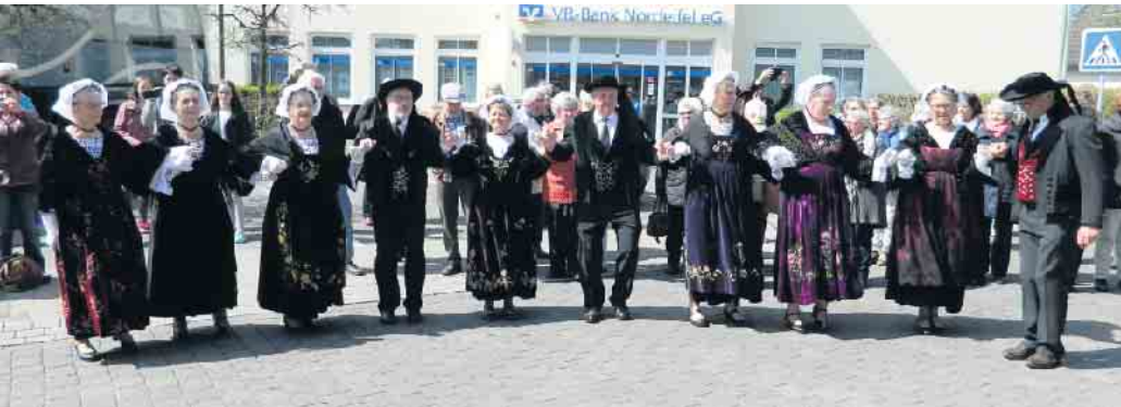
Anlässlich eines früheren Besuches in Dahlem.

und Schüler lernen die Clara-Fey-Schule in Schleiden kennen, Karnevalszüge in der Region können besucht werden und es bleibt Zeit für den Austausch in und mit den Gastfamilien. Dafür konnten auch wieder ausreichend Familien in der Gemeinde gefunden werden, die als Gastfamilien die Partner aufnehmen. In beiden Gemeinden freuen sich die engagierten Menschen dieser Partnerschaft, dass der lange geplante Besuch in Dahlem jetzt stattfinden kann.