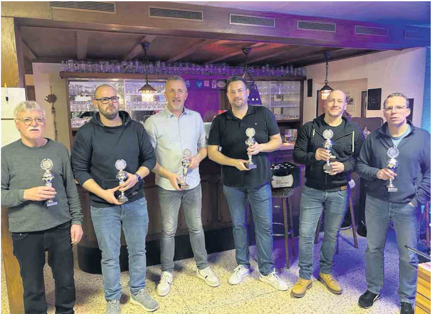
Sieger des Kickerturniers: (v.l.) Platz 3, Platz 1, Platz 2.

gelungene Gelegenheit für die Gemeinschaft um zusammenzukommen und Spaß zu haben. Die TMBW freut sich zudem über den gespendeten Kicker der SG Dahlem-Schmidtheim, der nun von den Ortsvereinen genutzt werden kann. Der Vorstand der TM Blau-Weiß Baasem