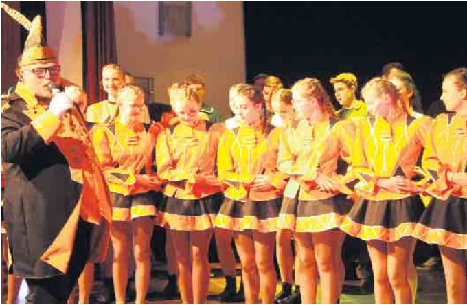
Die WKF-Tanzgarde präsentiert sich dem Publikum.

essener Karnevalsfreunde richtig durch. In der mit rund 450 Besuchern restlos ausverkauften Willebadessener Stadthalle war die Freude zu spüren, endlich wieder Karneval feiern zu dürfen. Für den WKF war dieser Auftakt ein großer Erfolg.