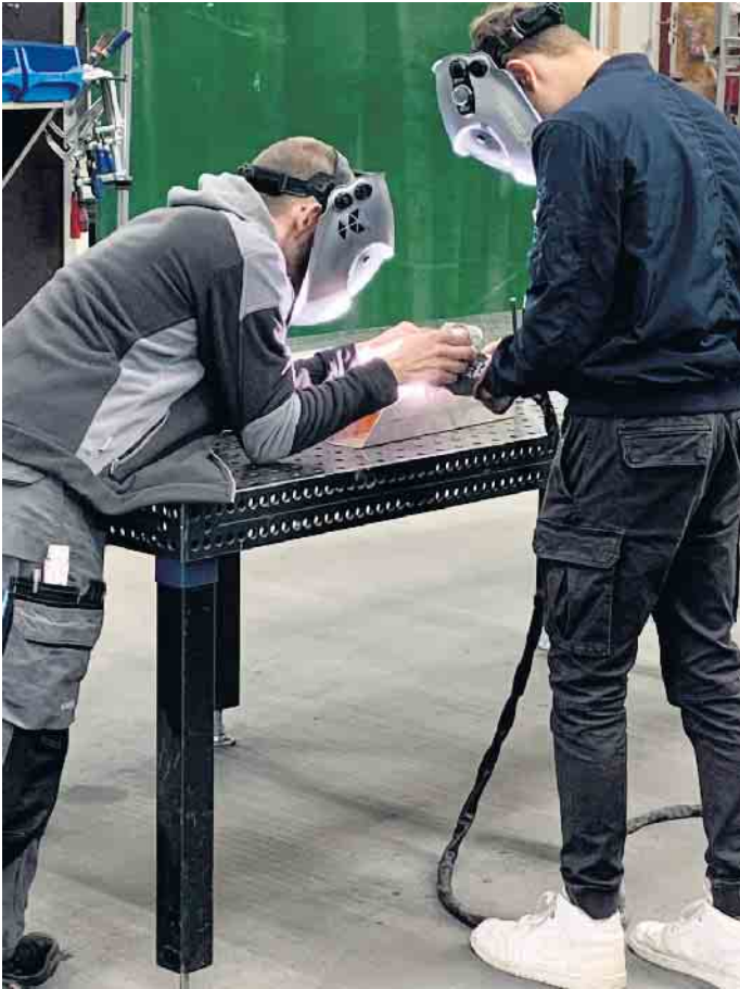
Schweißarbeiten am 3D-Schweiß Tisch

Edelstahl sowie fertige Edelstahlware gezeigt und deren Herstellung erläutert. Zudem durften sie selbst an ein Schweißgerät und sich praktisch ausprobieren. An der letzten Station lernten die SchülerInnen das Material „Schwarzstahl“ kennen. Dabei wurden ihnen verschiedene Arbeitsschritte sowie der Schweißroboter vorgestellt. In Schutzkleidung durften sie anschließend die Arbeiten aus der Nähe anschauen. Am Ende des Besuchs nutzten einige die Gelegenheit, sich über mögliche Praktika zu informieren und so Pläne für das im Frühjahr anstehende dreiwöchige Betriebspraktikum zu schmieden. Das ganze Team der Gesamtschule bedankt sich ganz herzlich bei der Firma Playparc, besonders bei Herrn Neuhaus, Herrn Wildeis und Herrn Lutz für diese tolle Veranstaltung, aus der die Schülerinnen und Schüler eine Menge wichtiger Erfahrungen gewinnen konnten!