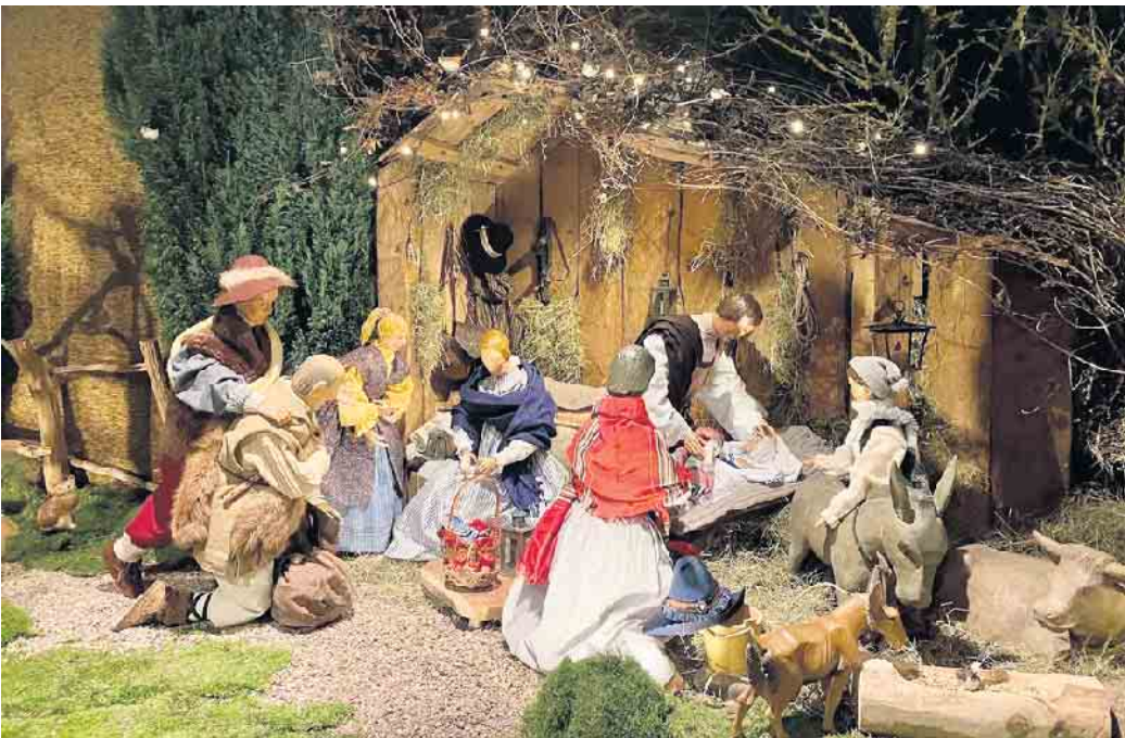
Szene Christi Geburt.

Die Wandelkrippe in der St.-Vitus Kirche Willebadessen vom ersten Advent bis Lichtmess eine Attraktion in der Eggestadt. Die biblische Geschichte wird in