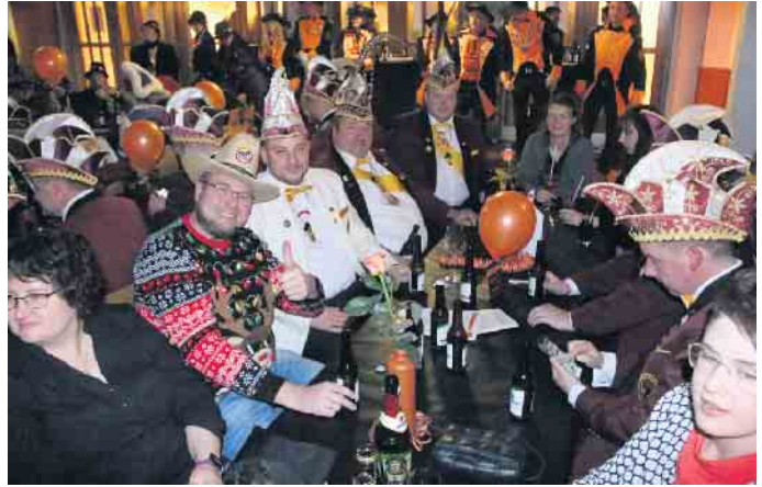
Tolle Stimmung bei der Gala-Sitzung der Willebadessener Karnevalsfreunde.