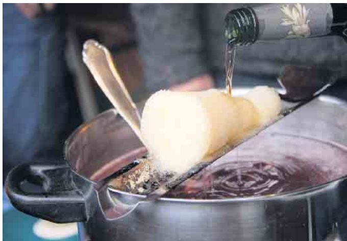
Hier wird die Feuerzangenbowle zubereitet.