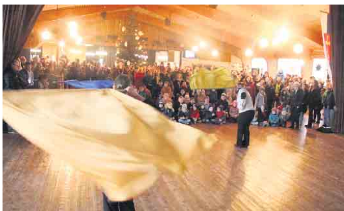
Die Fahnen-schwenker zeigen ihr Können.

Met-Honigwein her. Der Borgentreicher Adventsmarkt findet nur an einem einzigen Tag statt. Entsprechend gut besucht war die Veranstaltung. In der Halle gab es Vorführungen. So zeigte die Jugendgruppe der Fahnen-schwenkerabteilung des Schützenvereins St. Sebastian ihr Können und die Tanzgruppen der