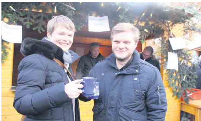
In atmosphärischem Ambiente einen Glühwein genießen.

Vereine der Orgelstadt stehen zusammen. Erlöse helfen, die Schützenhalle zu modernisieren.