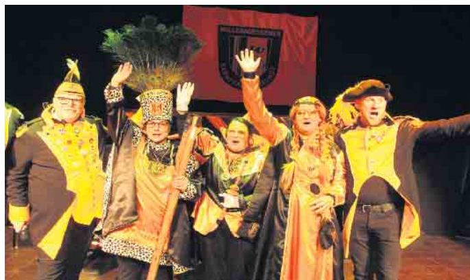
Der Vorstand der Willebadessener Karnevalsfreunde präsentiert das neue Dreigestirn.