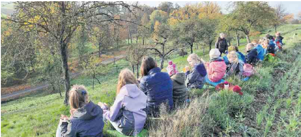
Die Schülerinnen und Schüler der Grundschule Borgentreich erhalten Unterricht zum „Anfassen, Schmecken und Riechen“ in den Streuobstwiesen.

Die Zweitklässlerinnen und Zweitklässler konnten einen Eindruck über die Vielseitigkeit einer Streuobstwiese im Herbst bekommen, auf der nicht nur Obst wächst, sondern eine Vielzahl von Tieren zu Hause sind, das man hier Spiele spielen, persönliche Eindrücke in kleinen Kunstwerken festhalten und den Vormittag mit