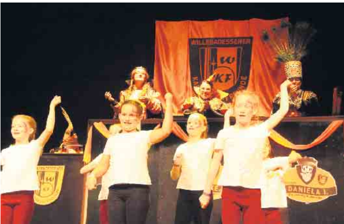
Die Tanzmäuse aus Erkeln sind fester Bestandteil des Willebadessener Karnevals.