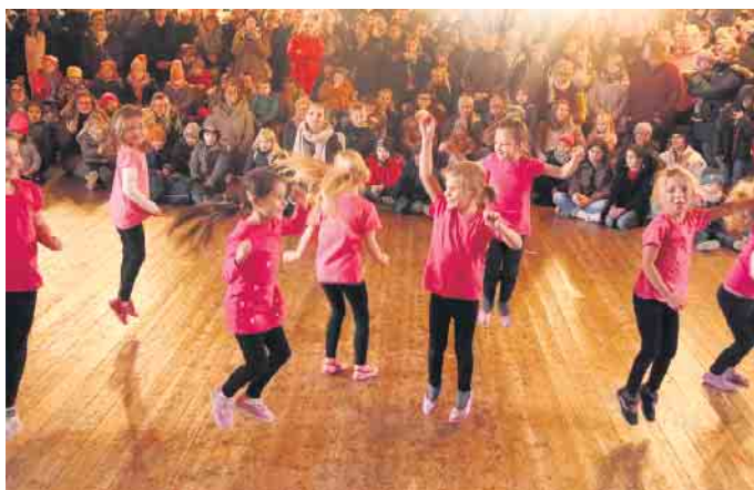
Tanzgruppen der Kolpingsfamilie sorgen für Unterhaltung.

Kolpingsfamilie präsentierten ihre neuesten Choreografien. Die zukünftigen Schulkinder des Familien-Forums führten ein Weihnachtsmusical auf. Für Kinder gab es eine Bastelecke. Der Musikverein und ein kleiner Chor aus der Zentralen Unterbringungseinrichtung unterhielten die Besucher mit Musik und Gesang.