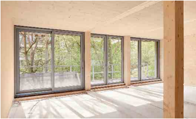
Lichtdurchflutete Räume, eingerahmt von eleganter Metall-Optik: Fensterrahmen aus einem Aluminium-Holz-Verbund bieten viele Gestaltungsmöglichkeiten gerade für großformatige Fenster.

sind besonders leicht zu pflegen und zeichnen sich durch ihre hohe Witterungsbeständigkeit, ihre Schlagfestigkeit und besonders glatte Oberflächen aus. Ein Nachstreichen ist nicht erforderlich, was Folgeaufwand deutlich reduziert. Die Pflege und Wartung beschränken sich überwiegend auf das Ölen und Einstellen der Beschläge, Fetten der Dichtungen und Reinigen der Rahmenprofile. Kunststofffenster werden in einer großen Farbpalette angeboten. Zudem bieten sie gute Wärmedämmwerte. In der Anschaffung sind sie in der Regel preisgünstiger als Holz- oder Aluminiumfenster. Werden Kunststofffenster ausgetauscht, können sie nach jahrzehntelanger Nutzung übrigens nahezu vollständig recycelt werden.