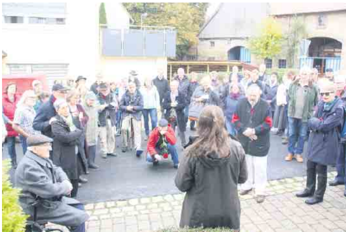
Die Stolperstein-Verlegung in Altenheerse trifft auf eine große Anteilnahme.