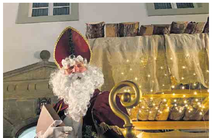
Vor dem Marktplatz erwartet der Nikolaus die Kinder.