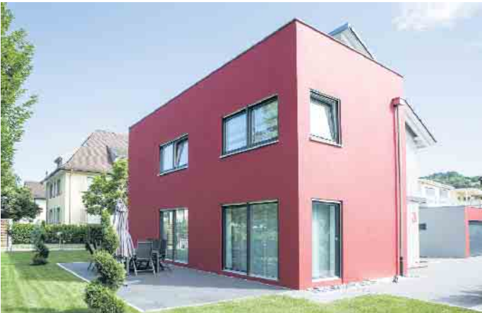
Fassadenfarben setzen markante Akzente und bieten oft weitere Funktionen, wie den Schutz vor dem Ausbleichen oder Aufheizen der Fassade durch die Sonne.

mit Klinkerriemchen prägen das Straßenbild ganzer Regionen beispielsweise im Norden und Westen Deutschlands. Das klassische Material wird heute mit einer noch größeren Vielfalt an Farben und Formaten wiederentdeckt. Die moderne Klinkerf-