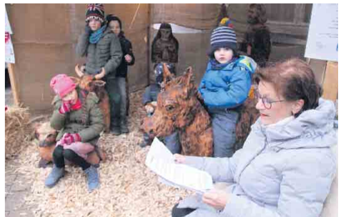
Vorlesezeit in der begehbaren Krippe.

Brakeler Eisstockturnier mit jeder Menge Spannung statt.