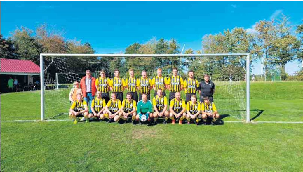
Fachunternehmen Martin Wrede ist neuer Trikot-Sponsor der Spielgemeinschaft.