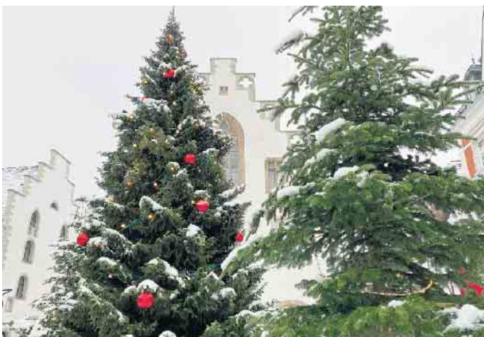
Ob es zum Nikolausmarkt sogar schneit, muss abgewartet werden.