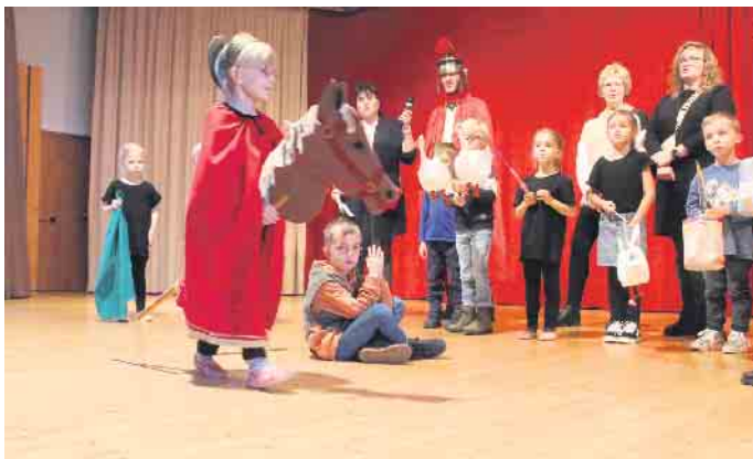
Die Kindergartenkinder führen ein Martinsspiel auf.