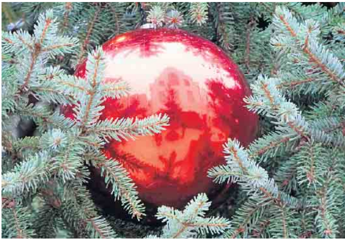
In der Weihnachtskugel spiegelt sich das historische Brakeler Rathaus.