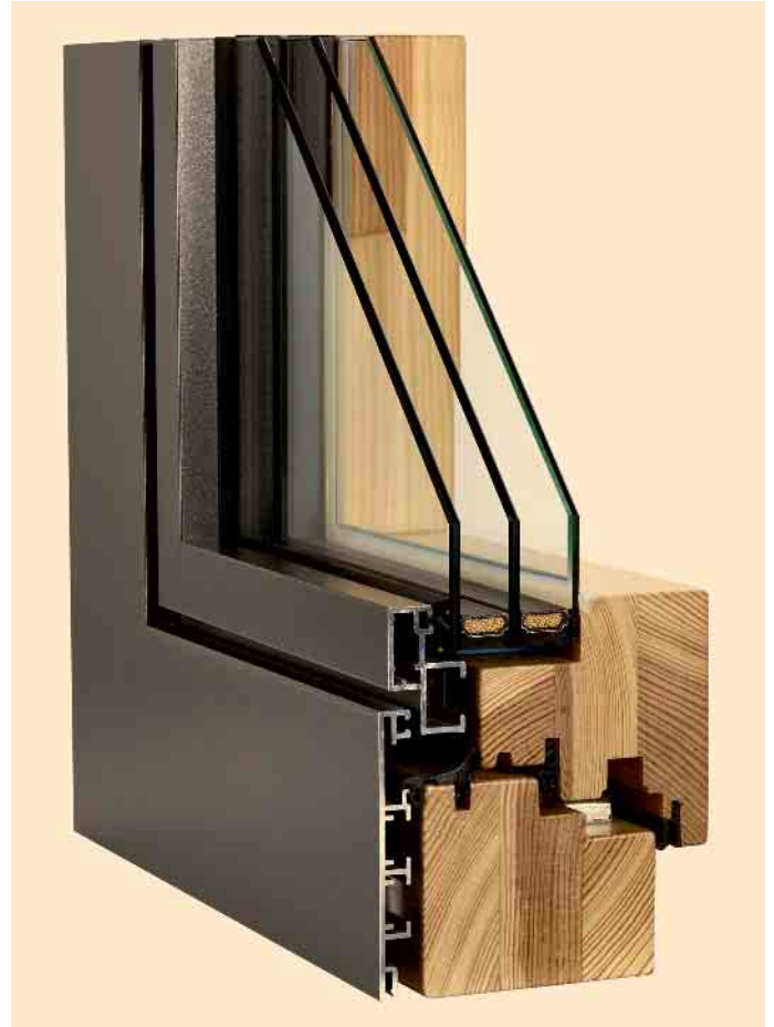
Das Beste zweier Welten miteinander verbinden: Querschnitt durch einen Holz-Aluminium-Fensterrahmen.

Mit Holz als traditionellem und zugleich modernem, natürlichem Rahmenmaterial bietet sich ein nachwachsender Rohstoff an, dessen Verarbeitung mit sparsamem Energieeinsatz einhergeht. Zudem kann Holz als Material für Fensterrahmen hervorragende Produkt- mit ausgezeichneten Umwelteigenschaften verbinden. Fensterrahmen aus Holz sind sehr formstabil und widerstehen damit thermischen Belastungen zu-