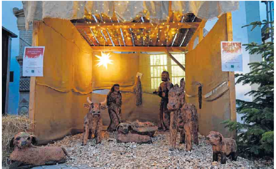
Auf dem Marktplatz steht auch eine begehbare Krippe.