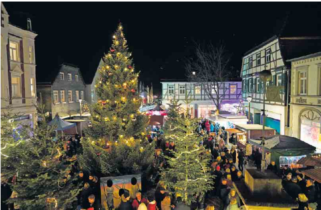
Der Nikolausmarkt aus der Vogelperspektive.

Sonntag, 10. Dezember, ab 15 Uhr Marktbetrieb.