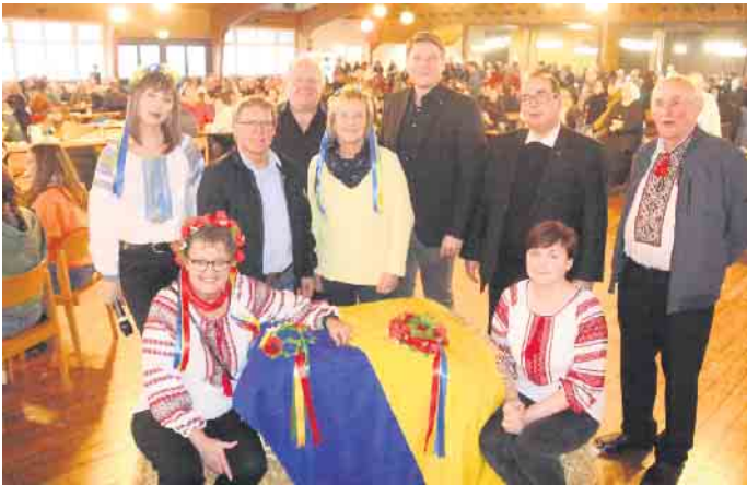
Die Organisatoren freuen sich über die große Resonanz.

Mehr als 300 Bürgerinnen und Bürger engagieren sich beim interkulturellen Tag der Begegnung in Borgentreich.