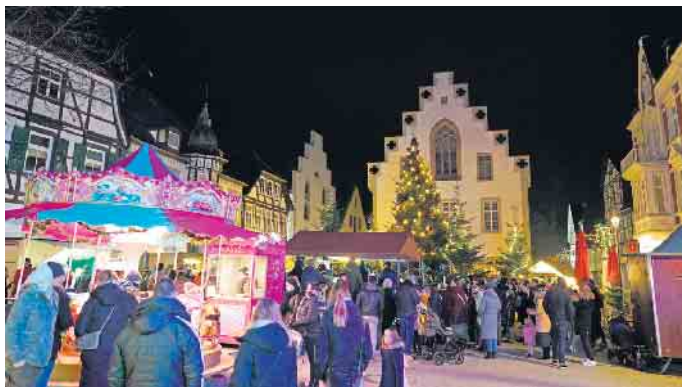
Der Nikolausmarkt mit dem Rathaus im Hintergrund