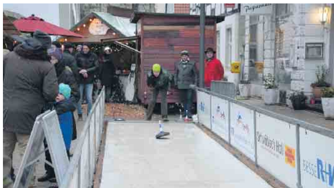
Der sportliche Vergleich steht beim traditionellen Eisstockschießen im Vordergrund