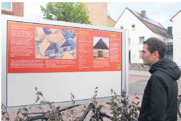
Eine Tafel informiert über die Geschichte des Platzes.

Auf der Freifläche schräg gegenüber der Kirche in Borgentreich ist ein Ort der Begegnung geschaffen worden. Kosten von 150.000 Euro wurden komplett gefördert.