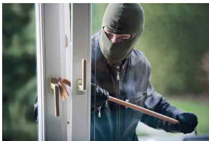
Gekippte Fenster bieten Einbrechern ideale Einstiegshilfen.