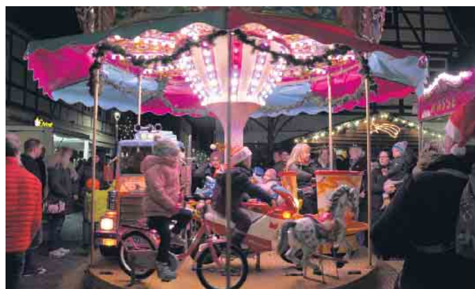
Zur Freude der kleinen Besucher bietet der Nikolausmarkt auch ein Kinderkarussell