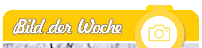
Bild der Woche