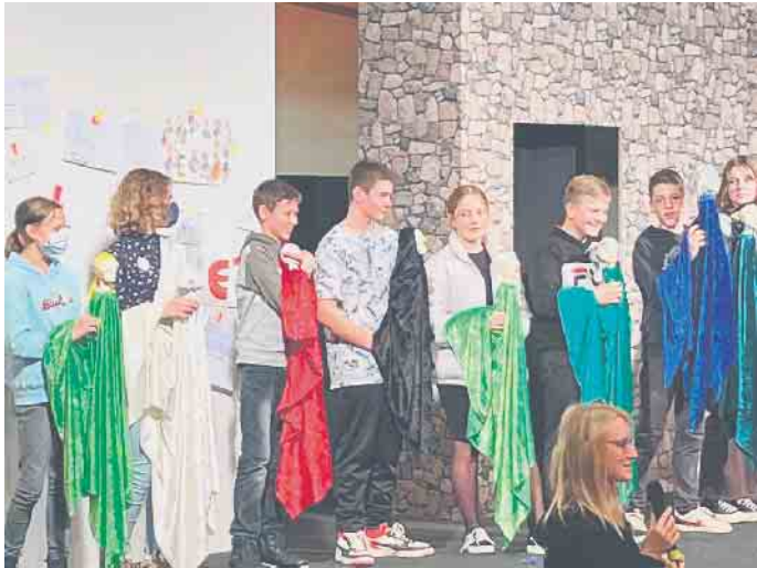
Diese Gruppe hat sich mit Figurenbau beschäftigt und präsentiert die Ergebnisse.

Peckelsheim (bb). Zum zweiten Mal fand jetzt im Kreis Höxter das Festival „Junges Theater“ statt. Nach der Premiere 2019 in Brakel fand die zweite Auflage im Schulzentrum der Stadt Willebadessen in Peckelsheim statt. 190 Schülerinnen und Schüler haben mitgewirkt. „Die vielen positiven Rückmeldungen haben gezeigt,