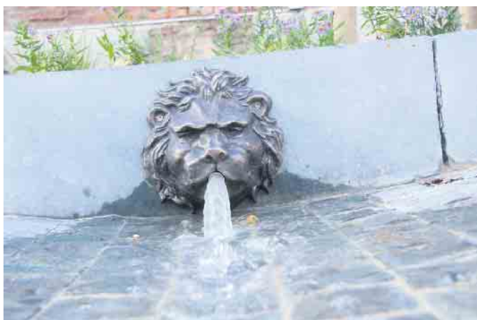
Das Wasserspiel wird ausschließlich mit Regenwasser gespeist.