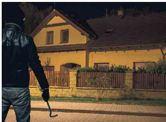
Einbrecher werden auf unbeleuchtete Häuser schnell aufmerksam. Licht täuscht Anwesenheit vor.