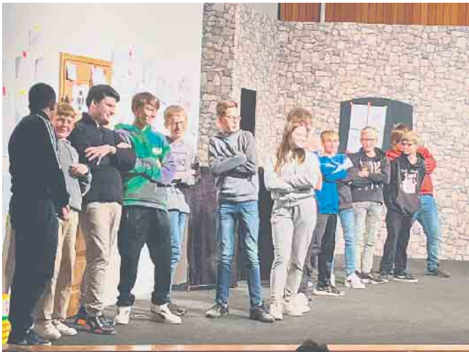
Das Kreativfestival hat allen Teilnehmern viel Spaß gemacht.

Großes Festival „Junges Theater“ im Schulzentrum in Peckelsheim. 190 Schülerinnen und Schüler machen mit.