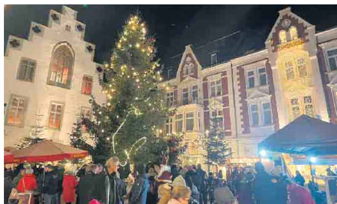
Viele große und kleine Besucher waren zu Gast beim Nikolausmarkt im vergangenen Jahr