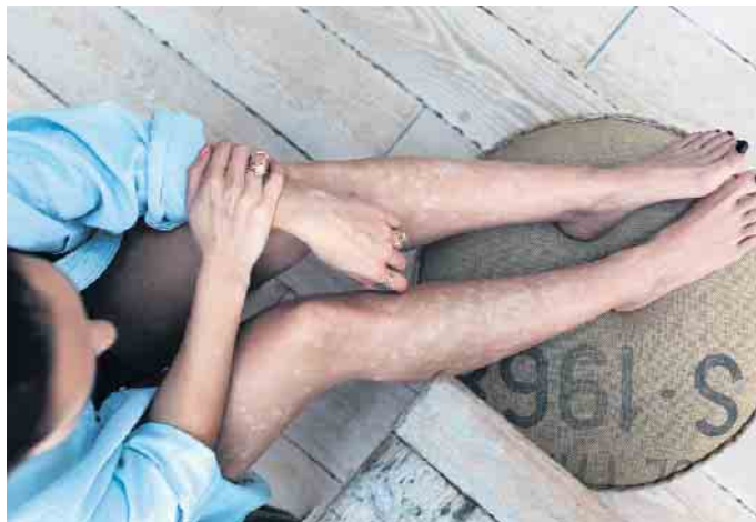
Flecken und Schuppen auf der Haut belasten die Betroffenen meist ganz erheblich.

Vieles kann man selbst tun Neben einer gezielten Therapie ist auch der persönliche Umgang mit der Hauterkrankung entscheidend für eine verbesserte Lebensqualität. Dazu trägt etwa eine gesunde Ernährung bei - Rezepte gibt es ebenfalls auf der Website. Zudem sollte man die psychische Gesundheit im Blick behalten. So kann regelmäßige Bewegung das Stressempfinden reduzieren, denn Stress führt nicht selten zu erneuten Krankheitsschüben und Juckreiz. Die Hilfe eines Psychologen und der Austausch mit anderen Betroffenen - zum Beispiel in Selbsthilfegruppen - können der Seele und damit auch der Haut guttun. (djd)