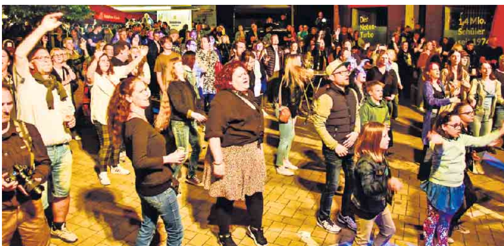
Klein und Groß ließen sich von der Musik vor der Bühne mitreißen.