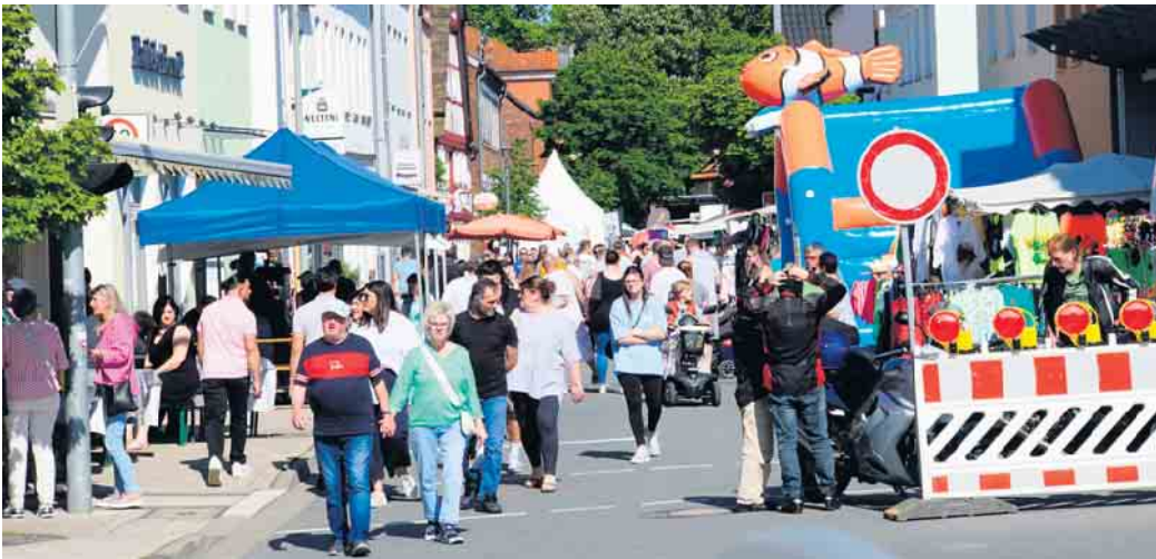
Viele Besucher auf dem Stadtfest in Brakel.