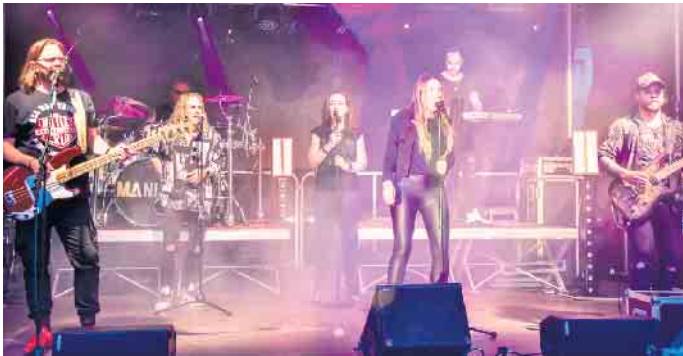
MANIAC covern das Beste aus 40 Jahren Rock und Pop-Musikgeschichte.