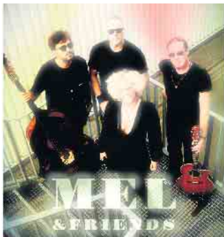
Mel & Friends animiert auf dem Bad Driburger Winzerfest zum Mitsingen, Mitmachen und Genießen

Lippe“ ihre Türen. Neben dem Gräflichen Park und dem Buddenberg-Arboretum freuen sich der