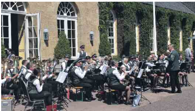
Musikalische Highlights setzen die Stadtkapelle Bad Driburg und das Junge Blasorchester „VORLAUT“, die für mitreißende Klänge sorgen.