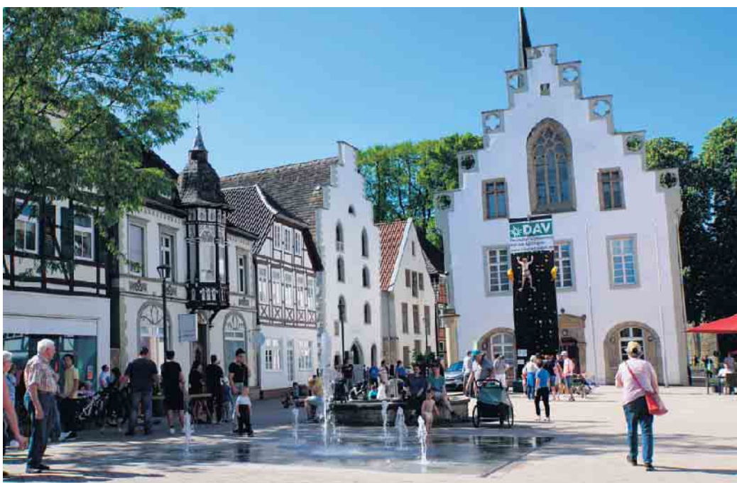
Die Kletterwand vom DAV (Deutscher Alpenverein Sektion Göttingen) stand im Jahr 2024 vor dem historischen Rathaus.

Auch der Kinderflohmart und ein mobiler Klettergarten auf dem historischen Marktplatz (Samstag und Sonntag) sowie der Kölsche Fanclub Menschenkicker (Samstag von 9 bis 18 Uhr) bereichern das Brakeler Stadtfestprogramm.