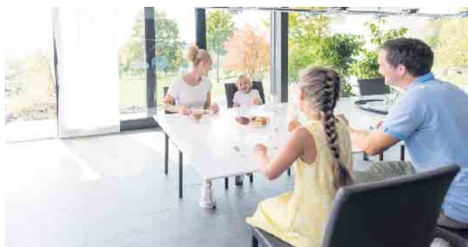
Wohnen mit Durchblick: Glas ist aus der modernen Architektur nicht wegzudenken - auch als Gestaltungsmittel im Innenausbau.

sen sich einfach reinigen und behalten dauerhaft ihr attraktives Erscheinungsbild. In der Küche wiederum kann Glas als bedruckte Rückwand oder als leicht zu reinigende Arbeitsplatte dienen. Und nicht in jedem Fall muss das Material komplett durchsichtig sein: Lackierungen, Sandstrahlungen und Ornamente ermöglichen Designs ganz nach eigenem Geschmack. Glasschiebetüren, Glasrückwände und Raumteiler lassen sich zum Beispiel auch mit einem persönlichen Fotomotiv bedrucken. (DJD)