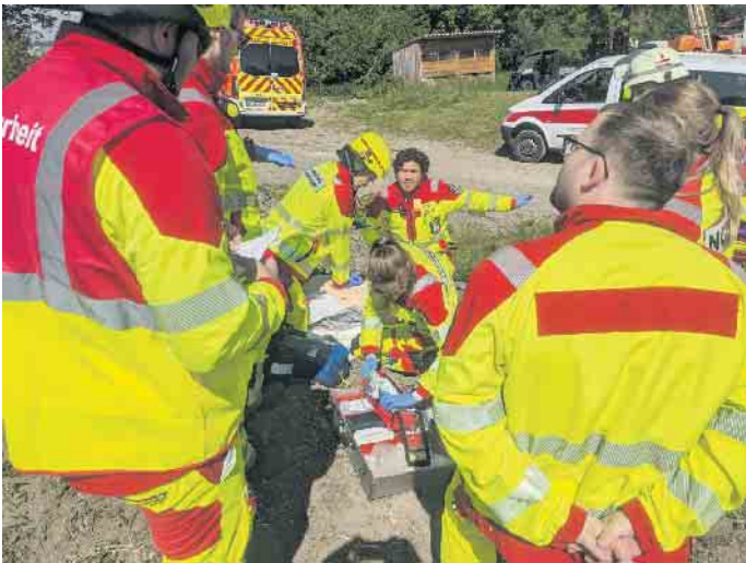
21 angehende Notfallsanitäter üben in realistischen Szenarien.