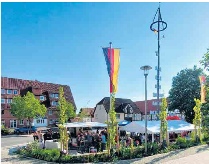
Borgholzer feiern den 1. Mai.