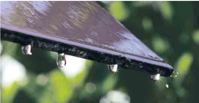
Ein großer Vorteil von Regenwasser ist dessen gute Grundqualität.

Sammlung und Nutzung von Regenwasser erzielt werden. Je nach Gebührenmodell der Gemeinden kann sich eine solche Anlage sogar finanziell amortisieren. „Aufgrund der immer länger anhaltenden Trockenperioden sollten die Regenwasserzisternen allerdings ausreichend groß geplant werden“, rät Ringstein. (akz-o)