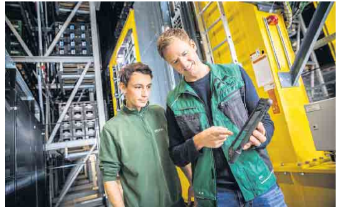
Die Ausbildung zur Fachkraft für Lagerlogistik in der Brauerei dauert drei Jahre, Voraussetzung ist ein Hauptschulabschluss.