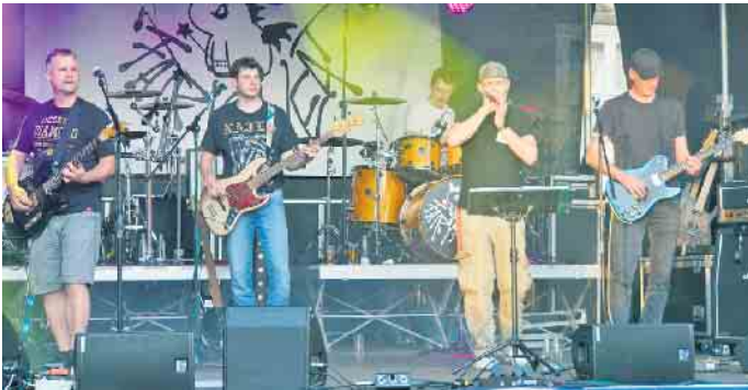
Die Band Fairysweat rockt die Bühne.