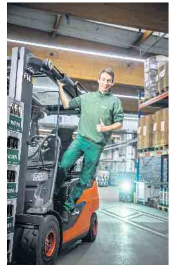
Der innerbetriebliche Transport erfolgt mit modernen Flurfördermitteln, die eingesetzten Gabelstapler können sechs Paletten gleichzeitig transportieren.