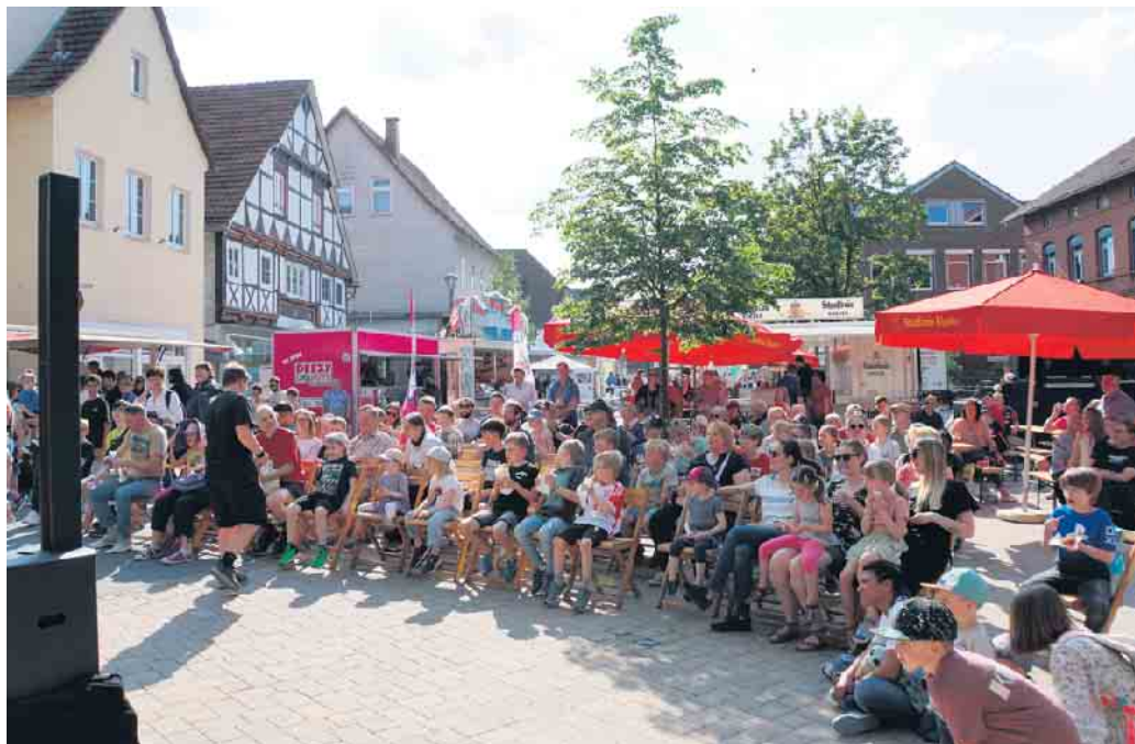
Viele verschiedene Auftritte sorgten für Begeisterung bei den Besuchern des Stadtfestes 2024.

In den Straßen „Hanekamp“ und „Am Thy“ sowie auf dem Marktplatz und der Show-Bühne „Am Thy“ werden wieder vielseitige Aktionen für kleine und große Gäste geboten, so der Ausblick des Werberingvorsitzenden, Bernhard Fischer. Mit der offiziellen Eröffnung durch den Bürgermeister und Werberingvorsitzenden auf der Bühne „Am Thy“ beginnt das Brakeler Stadtfest