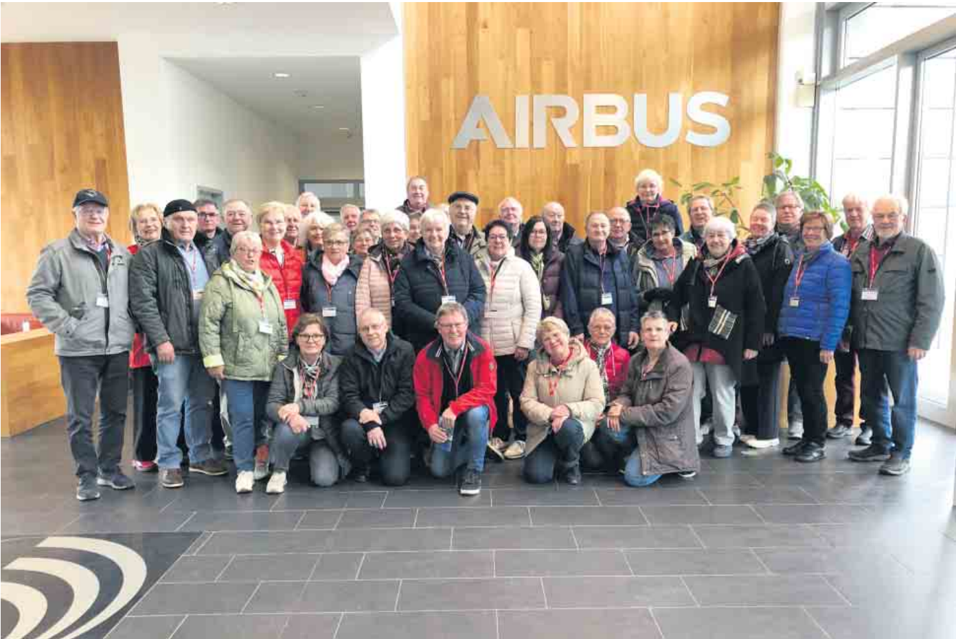
Die Teilnehmerinnen und Teilnehmer erleben eine spannende Führung durch das Luft- und Raumfahrtunternehmen Airbus.

Jahresfahrt der ehemaligen Bundeswehrangehörigen Borgentreich und Auenhausen