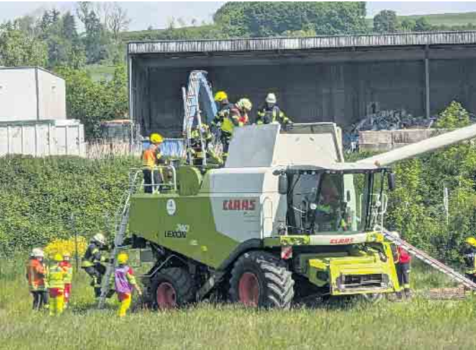
Einem Landwirt muss vor Ort auf dem Feld ein Arm abgetrennt werden, der sich in der großen Maschine verklemmt hat.

Feuerwehren aus Peckelsheim, Borlinghausen, Borgentreich und Körbecke unterstützen besondere Notfallübung des Kreises.