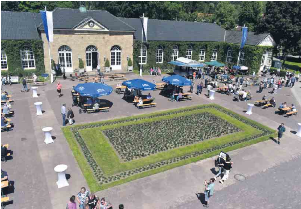
Der Platz vor den Brunnenarkaden wird zum Mittelpunkt des Parkfestes.

Zum Tag der Gärten und Parks in Westfalen-Lippe lädt der Gräfliche Park in Bad Driburg am Sonntag, den 15. Juni 2025, zu seinem beliebten Parkfest ein. Das Team vom Gräflichen Park hat auch in diesem Jahr wieder ein buntes Rahmenprogramm für Jung und Alt zusammen-