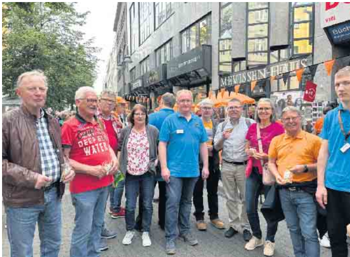
Mitglieder der Kolpingsfamilie Borgentreich und des Bezirksverbandes Warburg beim Jubiläumsfest in Köln.