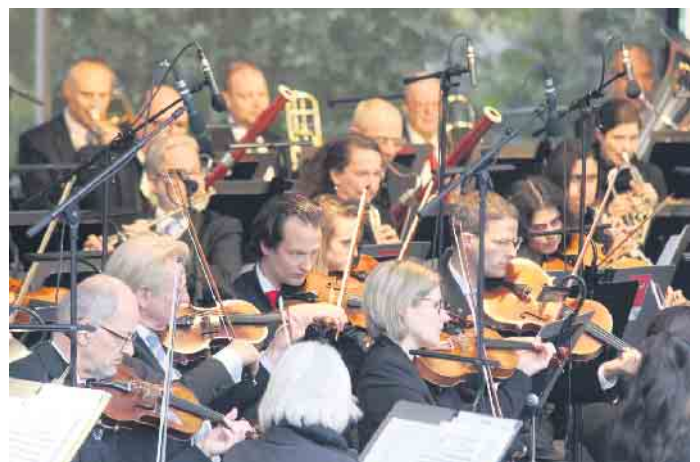
Die Herforder Philharmoniker wollen erneut mit einem beschwingten Programm überzeugen.

Zwar beginnt das Konzert erst um 18 Uhr, aber bereits ab 15 Uhr können die Besucher im weitläufigen Schlosspark flanieren, die Kulinarik genießen oder einfach ein gemütliches Familienpicknick auf der Wiese machen. „Im letzten Jahr war eine Familie beim Konzert, die noch nie klassische Musik live er-