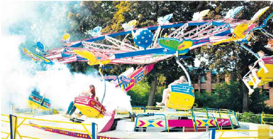
Auch ein Treffpunkt für Familien: Die Frühlingskirmes am Feuerteich.

11 bis 18 Uhr: Junior-Wissenschafts-Forum mit Bildungseinrichtungen und