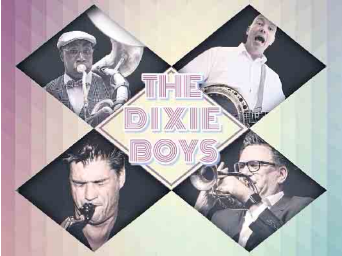
Die vier professionellen Musiker der Dixieboys sorgen auf dem Bad Driburger Winzerfest für gute Laune

Bibelgarten der Stiftung Senfkorn sowie die Privatgärten „Hausgarten Eggweg“ und „Hortus Im Iburgtal“ auf interessierte Besucher. Und am Sonntag lädt der Gräfliche Park zum bunten Parkfest mit tollem Rahmenprogramm ein. Manchmal liegt das Gute so nah wie das Festwochenende in Bad Driburg mit tollem Programm. Wer gerne sein Auto stehen lassen möchte, der findet ausreichend Übernachtungsmöglichkeiten in Bad Driburg oder kann direkt die Winzerfestpauschale inklusive 3 Übernachtungen buchen. Weitere Infos: Bad Driburger Touristik GmbH, Lange Str. 87, 33014 Bad Driburg, Telefon 05253 98940 sowie unter www.bad-driburg.com