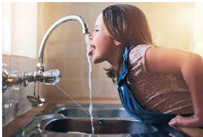
Wie selbstverständlich läuft bei uns das Wasser aus dem Hahn. Doch angesichts der Klimaveränderungen wird es nicht ewig so weitergehen.