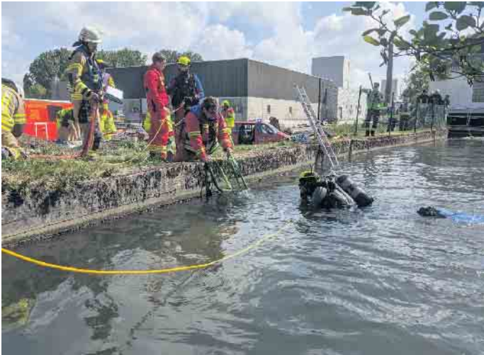
Feuerwehr, DLRG und Sanitäter handeln Hand in Hand.