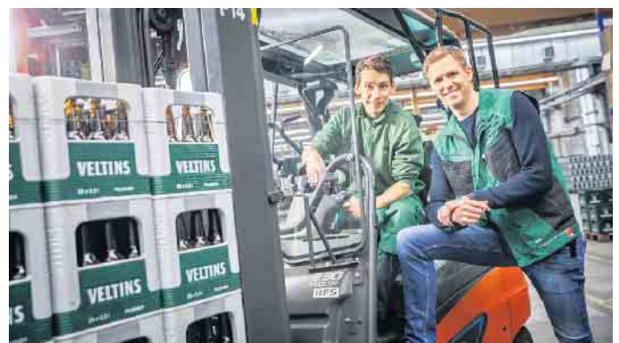
Fachkräfte für Lagerlogistik sollten über räumliches Vorstellungsvermögen verfügen, sie sollten organisatorisches und praktisches Geschick besitzen und Interesse und Spaß an Technik haben.