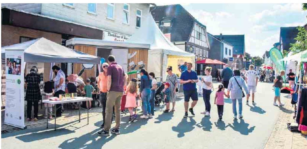
Verschiedene Stände schmückten die Straße „Am Thy“.