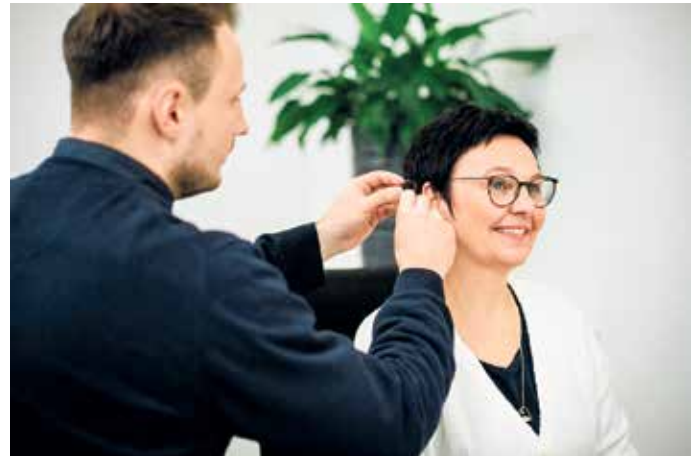
Hörgeräte, sorgfältig auf Ihre Bedürfnisse abgestimmt

auf Ihren Eigenanteil. Bei zwei Hörgeräten sind bis zu 800 € möglich. Ausgenommen ist die Kategorie Premium Plus. Nicht kombinierbar mit anderen Rabatten und Aktionen.