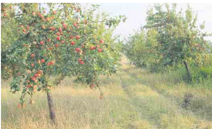
Zum Herbst bringen die Streuobstwiesen reiche Ernte hervor.