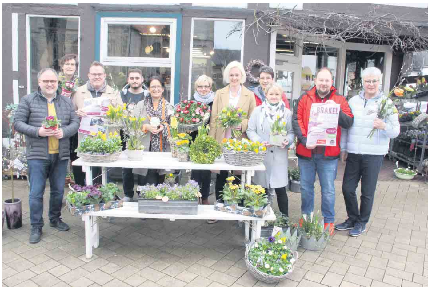
Die beteiligten Akteure stellen das Programm der diesjährigen Frühlingsaktion „Brakel blüht auf“ vor