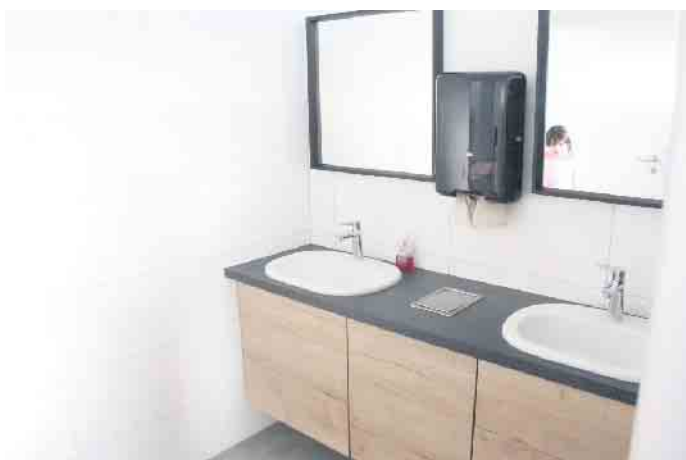
Auch die sanitären Anlagen wurden saniert und ganz neu auch eine Behindertentoilette eingebaut.

Organisiert wird die Dorfwerkstatt vom Bürgerverein. Kaffee und Kuchen sowie kalte Getränke stehen für die Teilnehmer kostenfrei bereit.