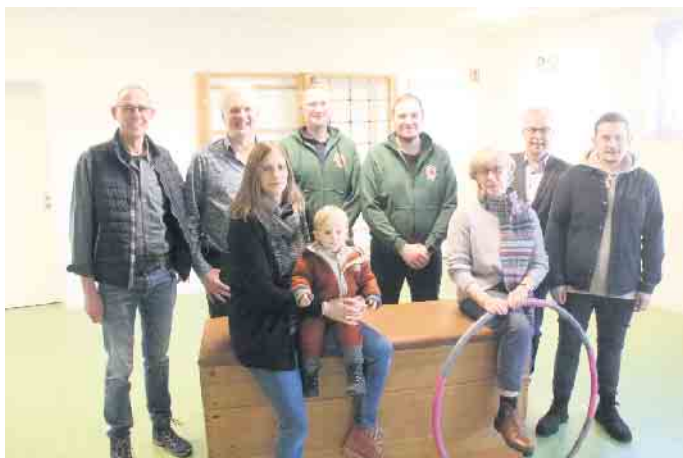
Vereins- und Ortsvertreter freuen sich über die Fertigstellung des neuen Gymnastikraums in Untergeschoss der Hüssenberghalle.

„Der Raum ist bereits sehr gut ausgelastet und vor allem stehen die oberen Räumlichkeiten für Versammlungen und Feiern zur Verfügung und es kommt nicht