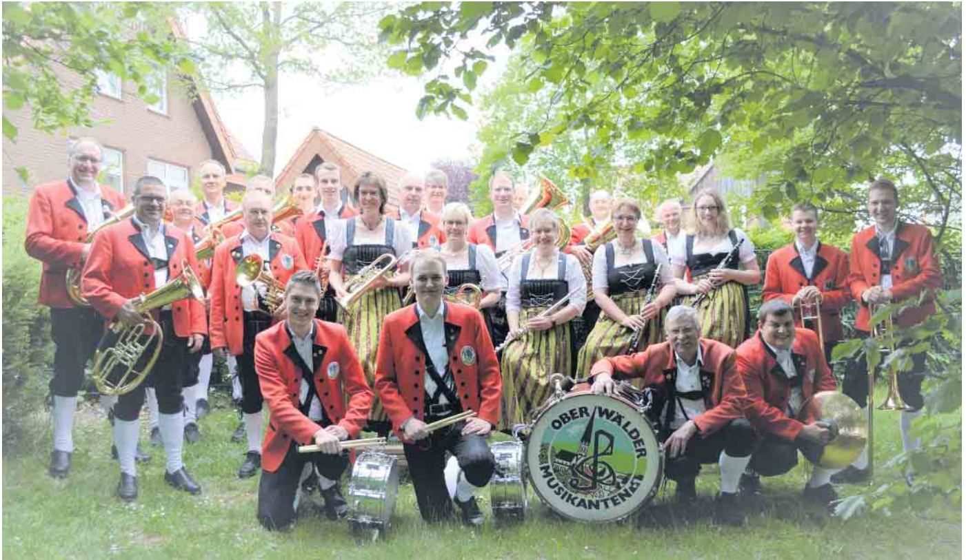
Die Besetzung der Oberwälder Musikanten im Jahr 2020.