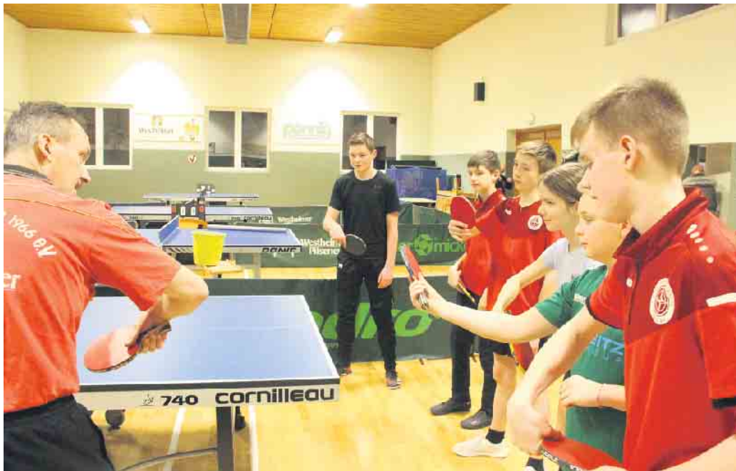
Beim Jugendtraining sind alle motiviert dabei.