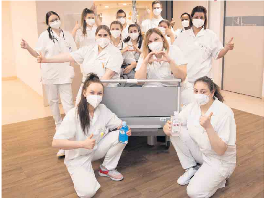
Das Bildungszentrum der KHWE beteiligt sich am „Boys’ and Girls’ Day“ am Donnerstag, 27. April.

Darüber hinaus können sich die Teilnehmer an diesem Tag über die Ausbildung zum Pflegefachmann oder zur Pflegefachassistentin informieren. Das Bildungszentrum der KHWE arbeitet mit allen Standorten des Klinikum Weser-Egge in Brakel, Höxter, Bad Driburg und Steinheim zusammen, das heißt mit insgesamt 25 Fachkliniken und Instituten, außerdem mit stationären und ambulanten Pflegeeinrichtungen im Kreis Höx-