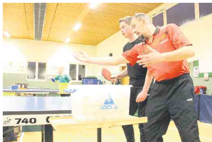
Die gute Jugendarbeit ist eine Säule des Erfolgs der TTG Ikenhausen.