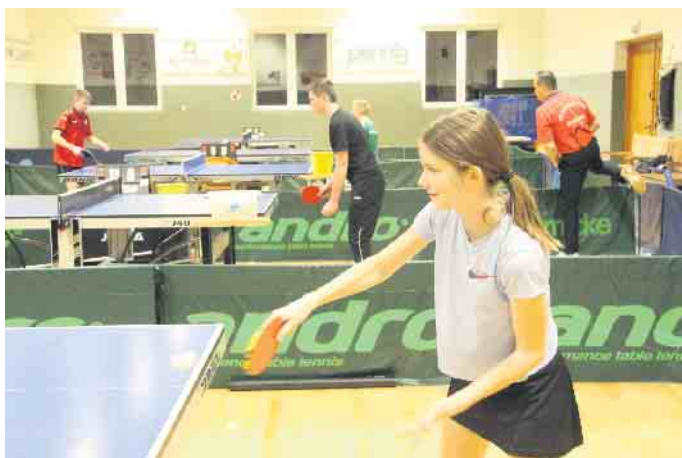
An fünf Tischen wird bei in der Freizeithalle parallel trainiert.

Es nicht ratsam, zu früh mit dem Tischtennis anzufangen. „Es mag Ausnahmen geben, aber erfahrungsgemäß ist neun Jahre