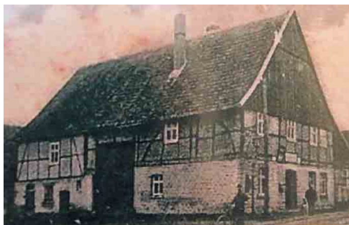
Die älteste Abbildung des Post-Gasthofes aus dem Jahr 1898 auf einer historischen Postkarte.