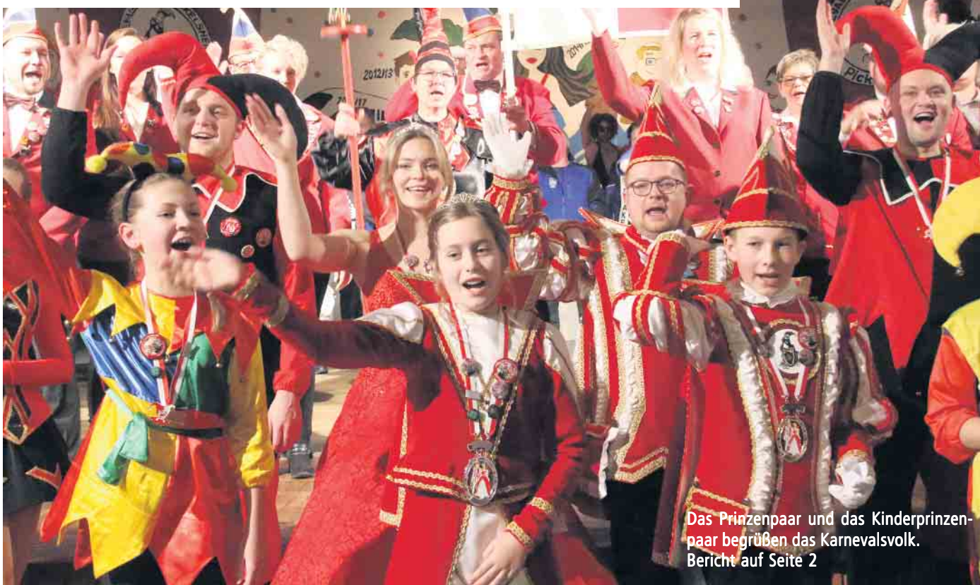
Das Prinzenpaar und das Kinderprinzenpaar begrüßen das Karnevalsvolk. Bericht auf Seite 2

Zum 25. Mal steigert der Höhepunkt im Peckelsheimer Saalkarneval die Vorfreude auf den traditionellen Rosenmontagsumzug