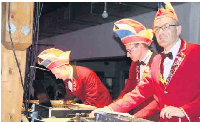
Karnevalisten können auch Mischpult.