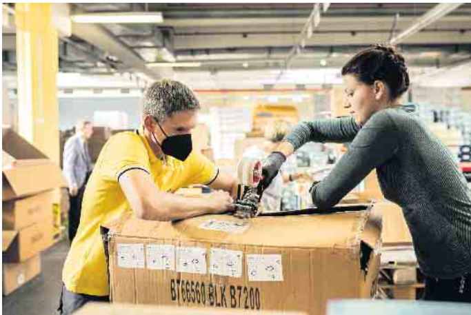
Kurz vor dem Winter organisierten Jehovas Zeugen in Deutschland in einer Hilfsaktion über 35.000 warme Kleidungsstücke für die Ukraine.

den. Die Religionsgemeinschaft leitete erneut rechtliche Schritte ein, damit Annemarie Kusserows letztem Willen entsprochen wird und das historische Erbe in das Eigentum der NS-Opfergruppe geht. Es besteht weiter die Hoffnung, dass dieser Kampf erfolgreich sein wird. Nähere Details dazu auf JW.ORG.