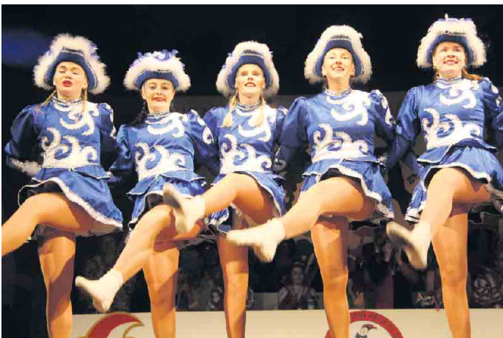
Die Rösebecker Tanzgarde ist immer ein Stimmungsgarant.

Im närrischen Fahrplan des Peckelsheimer Karnevalsvereins Pickel-Jauh ging es weiter mit dem