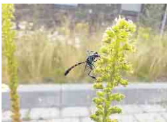
Schmalbauchwespen sind zugleich Verwandte und Feinde von Wildbienen.