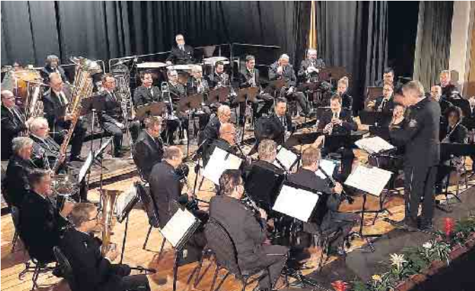
Konzertieren am Sonntag, 7. Januar, im Gemünder Kursaal zum zwölften Mal für die Hilfsgruppe Eifel: Das „Landespolizei-Orchester NRW“.