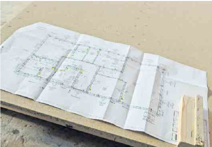
Der maßstabsgetreue Grundriss ist eine wichtige Planungsgrundlage für Bauherren sowie bei der Herstellung von Fertigbauteilen im Werk.

nicht nur das Wohlbefinden und die Konzentration der Bewohner, sondern reduziert gleichzeitig ihren Energieverbrauch und damit die Stromkosten. Bauherren sollten bedenken, dass sie womöglich Stellfläche für hohe Möbel vor fensterlosen Wänden brauchen und dass die Sonne tages- und jahreszeitlich bedingt unterschiedlich licht- und wärmeintensiv ins Haus gelangt. „Daher ist es sinnvoll, spätere Alltagsabläufe und Einrichtungsideen schon bei der Grundrissplanung vorzudenken“, empfiehlt Tews. Denn wer vorab die neue Küche oder Einbaumöbel plant, kann seinen Grundriss im Feintuning noch umso gezielter darauf abstimmen und etwa die Fenster exakt so ausrichten und platzieren, dass in der Küche, aber zum Beispiel auch im Homeoffice effizientes, Tageslicht-helles Arbeiten möglich ist. Ebenso macht die Platzierung von Steckdosen, Licht- und Rollladenschaltern sowie Thermostaten eine weitsichtige Planung erforderlich. „Immer häufiger entfallen Wand-schalter im Neubau sogar gänzlich,