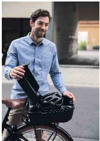
Die robuste und regendichte Box ist ein sicheres Depot für Helm, Regenjacke und Co.

Im Fachhandel gibt es eine Vielzahl an Fahrradtaschen, -boxen und -körben, die direkt am Fahrradrahmen, am Lenker, an der Sattelstütze oder am Gepäckträger befestigt werden können. Gute Modelle zeichnen sich