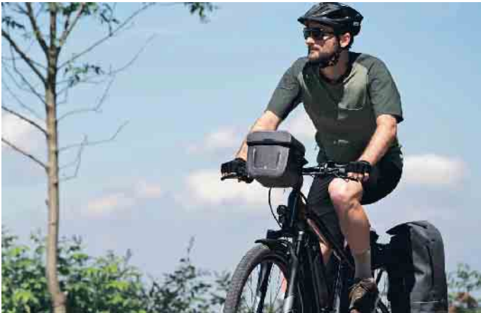
Gute Lenkertaschen zeichnen sich dadurch aus, dass sie mit einem Befestigungssystem, wie etwa Klickfix, ausgestattet sind.

schen Luft zu bewegen, Radfahren trainiert auch die Kondition, kurbelt den Stoffwechsel an und