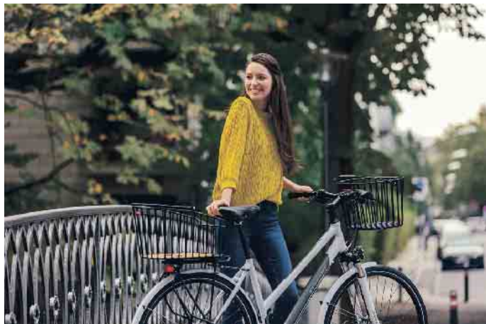
Lenker- und Hinterradkorb werden sicher und sekundenschnell angeklickt und wieder abgenommen.

kräftigt die Muskeln. Zudem spart man Benzinkosten und entlastet die Umwelt. Jetzt, wo die Temperaturen wieder angenehmer werden, macht es Sinn, das Auto öfter mal stehen zu lassen, um kürzere oder längere Strecken mit dem Drahtesel zurückzulegen. Wer das Fahrrad häufiger in den Alltag integrieren möchte, sollte allerdings auf die richtige Ausstattung achten. Schließlich wollen Einkäufe, Arbeits- und Freizeitutensilien sicher transportiert werden.