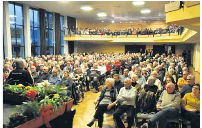
Alle bisherigen Hilfsgruppen-Konzerte des Orchesters waren ausverkauft.

Blick in die Nachbarschaft: Am Sonntag, 7. Januar, gastiert das beliebte Orchester der Landes Polizei im „Großen Kursaal“ in Gemünd - Erlös kommt wieder der Kaller Hilfsgruppe Eifel zugute - Landrat Markus Ramers ist Schirmherr - Kartenvorverkauf ab 1. Dezember