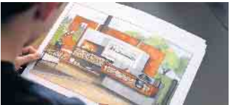
Als Ofen- und Luftheizungsbauer baut man nicht nur Öfen, sondern übernimmt auch handwerkliche Arbeiten eines Maurers, Schweißers, Dachdeckers, Malers, Gas- und Wasser-Installateurs sowie Elektrikers.

öffnet weitere Karrierechancen. Einen #ofenhelden Infotalk findet man kostenfrei unter https://wir-sind.ofenhelden.info . Ofenbauer informieren hier über ihren abwechslungsreichen Beruf. Wer ihn kennenlernen möchte, sollte sich nach einem ein- oder mehrwöchigen Praktikum bei einem Ofenbauerbetrieb in der Nähe erkundigen, unter www.ofenhelden.info gibt es dazu mehr Informationen. (DJD)