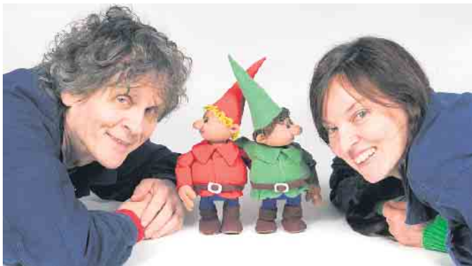
Himpelchen Pimpelchen und ihre beiden „Lehrlinge“

Rücksicht zwei ganz wichtige Elemente für das Miteinander sind. Und so können Himpelchen und Pimpelchen am Ende beruhigt und zufrieden in die Weihnachtszeit hineinschlummern. Karten gibt es an der Tageskasse; es wird empfohlen, unter 0 22 57 - 44 14 oder unter kulturhaus@theater-1.de zu reservieren. Reservierungswünsche, die erst am Tag der Veranstaltung eingehen, können möglicherweise nicht mehr berücksichtigt werden.