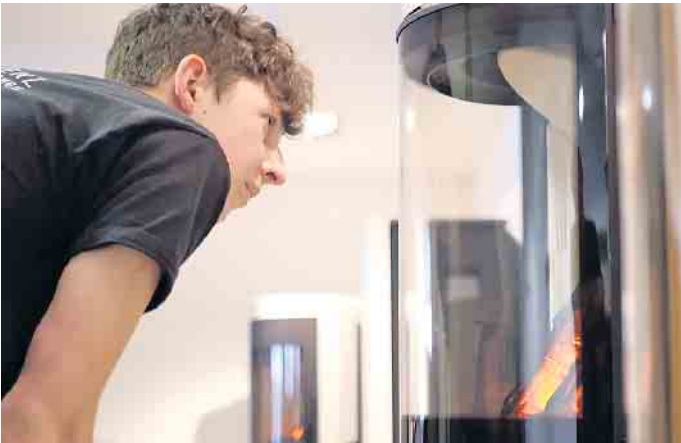
Die Ausbildung zum Ofen- und Luftheizungsbauer bietet ausgezeichnete Zukunftsperspektiven.

mit einem Haupt-, Mittel- oder Realschulabschluss, andere steigen nach dem Abi ein. Die Ausbildung dauert in der Regel drei Jahre im dualen System, pro Halbjahr stehen sechs Wochen Berufsschule und eine Woche überbetriebliche Ausbildung auf dem Programm. Eine Verkürzung der Ausbildung ist möglich. Nach der Gesellenprüfung stehen viele Türen offen: Ofen- und Luftheizungsbauer arbeiten sowohl für Industriebetriebe, die Öfen in Serie herstellen, als auch in Kleinbetrieben, die Kachelöfen individuell nach Kundenwünschen errichten. Mit etwas Berufserfahrung kann man seinen Meister machen, Fach- und Führungsaufgaben übernehmen und im Betrieb aufsteigen. Oder man wagt mit dem Meistertitel die Selbstständigkeit. Eine Weiterbildung als Techniker in der Fachrichtung Heizungs-, Lüftungs-, Klimatechnik ist ebenso möglich. Und ein nachfolgendes Bachelor-Studium im Studienfach Versorgungstechnik er-