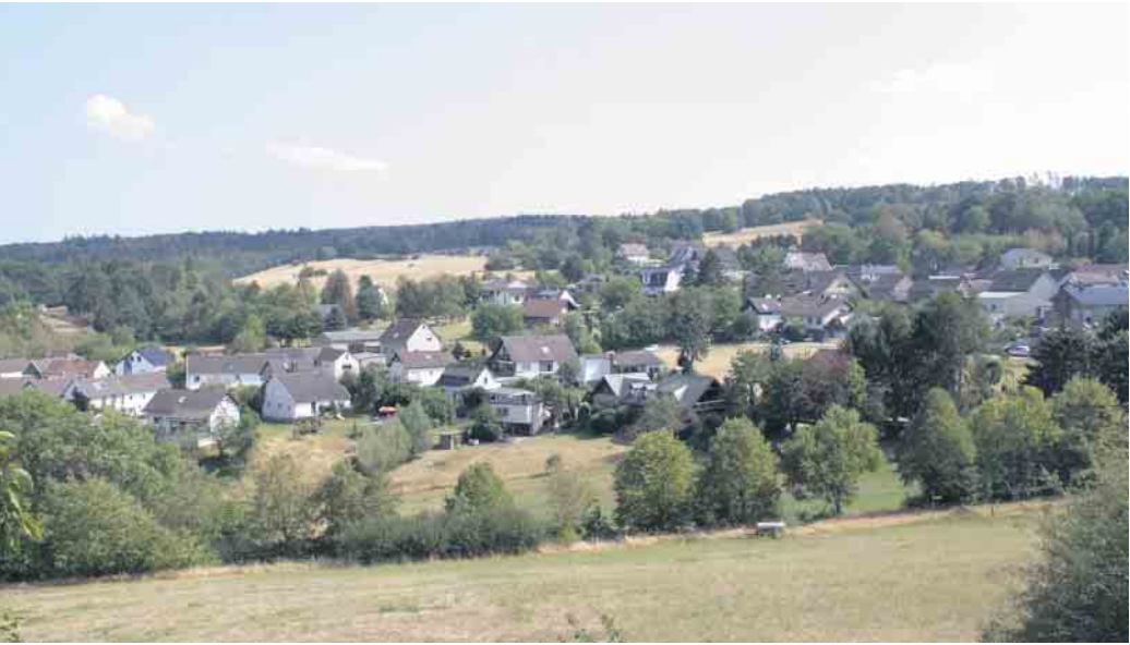
Im Kreis Euskirchen gibt es viele lebendige Dörfer und engagierte Dorfgemeinschaften. Sie alle können am Wettbewerb „Unser Dorf hat Zukunft“ teilnehmen.