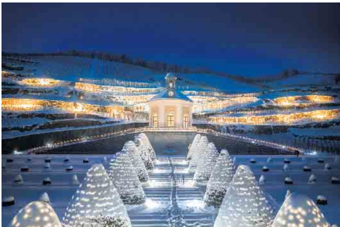
Europas erstes Erlebnisweingut leuchtet im Winter im Lichterglanz.

Wie ein Raugraf den Glühwein in Sachsen erfand