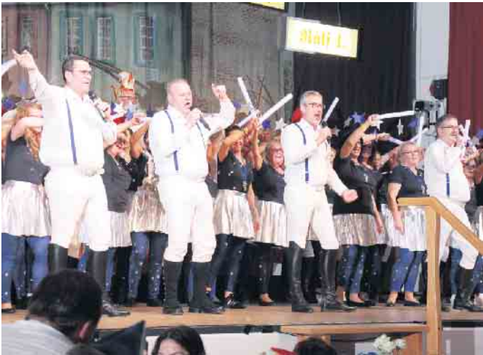
Bei der Sondernummer wurden die Hoppemötzjer wiederaufleben gelassen und eigens vier junge Tenöre verpflichtet