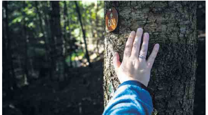
Der letzte Fußabdruck kann auch naturnah und damit umweltfreundlich sein.

Schon der menschliche Körper ist nicht unbedingt „bio“. Während des Lebens sammeln sich in ihm viele Schadstoffe und Fremdkörper an - sei es in Form von Medikamentenrückständen, ausgetauschten Hüftgelenken oder Zahnprothesen. Reste davon können beim Begräbnis im Boden zurückbleiben oder bei der Kremation trotz hochmoderner Filteranlagen in die Luft gelangen. „So wie im Leben, möchten viele Men-