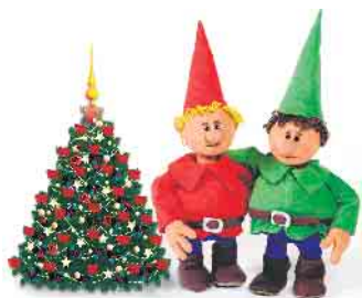
Auch Himpelchen und Pimpelchen feiern Weihnachten

Wie jedes Jahr an Heiligabend zeigen Christiane Remmert und Jojo Ludwig vom „theater 1“ wieder ein Stück für die jüngsten Theaterbesucher, damit die lange Zeit bis zur