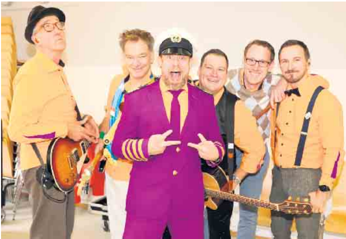
Den karnevalistischen Reigen eröffnete die Musiker von „Tacheles“, die auch in dieser Session die anwesenden Damen so richtig in Stimmung brachten