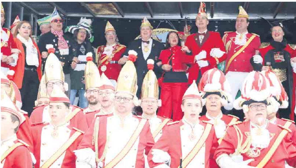
So war die Sessionseröffnung in Zülpich

Die Prinzengarde Zülpich 1910 e.V. lud ein zur großen Sessionseröffnung. Zum 42. Mal eröffnete die Prinzengarde Zülpich die Session in der Römerstadt. Endlich ist es wieder soweit, die fünfte Jahreszeit ist offiziell eingeläutet. Die Prinzengarde Zülpich feierte mit allen Jecken am 9. November ab 11.11 Uhr in die Session 2025/2026. Wie auch bereits in den letzten Jahren fand die Veranstaltung im Rathausinnenhof statt. Bei freiem Eintritt hatten alle Närrinnen und Narren die Möglichkeit, den Start der närrischen Jahreszeit gebührend zu feiern. Früh da sein, war also erste Jecken-Pflicht. Was mit einer kleinen Veranstaltung 1984 begann, ist bis heute aus dem karnevalistischen Kalender der Stadt nicht mehr wegzudenken. Zuerst feierte man auf dem Marktplatz, später auf dem Josef-Peiffer-Platz, im Rathausinnenhof und wieder vor dem Rathaus, zwischen Rathaus und Marktplatz, dem Gardeplatz am Münstertor, bis man zum heutigen Veranstaltungsort, dem Innenhof des Rathauses zurückfand. Hier hat die Prinzengarde mit dem Zülpicher Rathaus, welches für einen herrlichen Rahmen sorgt, einen wunderschönen Veranstaltungsort gefunden. Das Programm der Sessionseröffnung war bunt wie die Kostüme der zahlreichen Besucher. Den ganzen Tag über erwartete die Zülpich