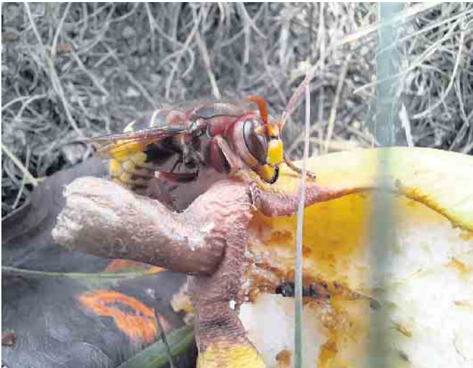
Imposantes staatenbildendes Insekt - die Europäische Hornisse (Vespa crabro).

zur Versklavung fremder Völker gehören zu ihrem Repertoire. Zudem leben auch andere Tiere von und in diesen Insektenstaaten: die harmlosesten sind noch die Abfallverwerter, doch auch Betrüger und Killer sind hier unterwegs. Zu letzteren gehören zum Beispiel schlichte Schmetterlinge oder unbewehrte Käfer und Fliegen. Mit welchen Methoden diese es schaffen, in einem wehrhaften Wespen- oder Ameisenstaat zu überleben und sich sogar dort erfolgreich fortzupflanzen, gehört zu den verblüffenden und faszinierenden Phänomenen dieses besonderen Kosmos. Arbeitskreis „Pflanzen und Tiere“: Soziale Aculeaten Termin: Samstag, 29. November Uhrzeit: 14 bis 17:30 Uhr Ort: Naturschutz-Bildungshaus Eifel-Ardenne-Region, Vogel-sang 90, 53937 Schleiden-Vogel-