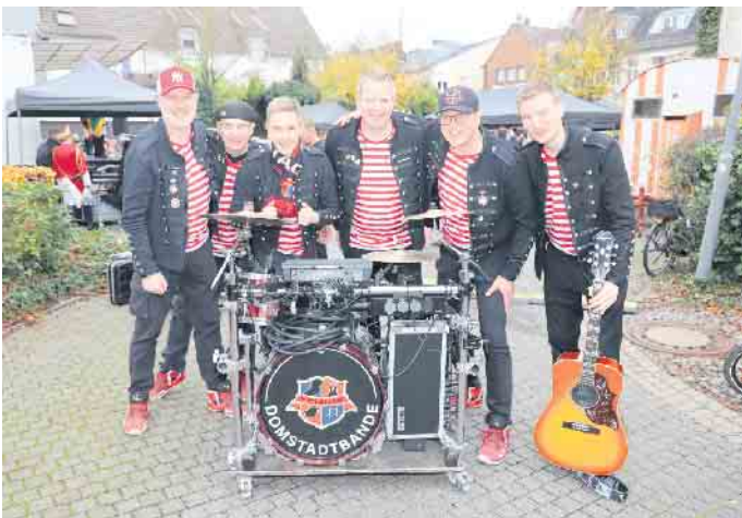
Musikalisch kam aus Köln die Band „Domstadtbande“ nach Zülpich. Mit ihren Stimmungshits und dem diesjährigen Sessionstitel „Zeppelin“ heizte die Band die Gäste an