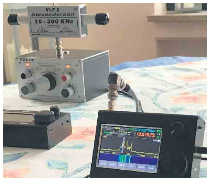
Ein digitaler Kurzwellenempfänger und eine Ferrit-Spezialantenne machen den Empfang auf 17,2 kHz möglich.

ereitung auf die Lizenz-Prüfung an. Willkommen sind Interessentinnen und Interessenten aus allen Altersgruppen. Vorkenntnisse sind nicht erforderlich. Wer sich direkt zum Kurs anmelden möchte, wendet sich bitte an Peter Schmücking, der unter der Telefonnummer 02471-3105 oder per E-Mail an df3ed@darc.de erreichbar ist.