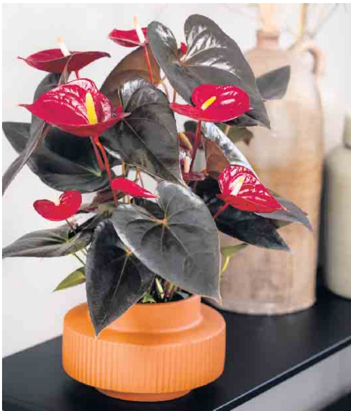
Ausreichend Licht und im Idealfall 18 bis 25 Grad Celsius, dann fühlen sich die Anthurien im Topf rundum wohl.