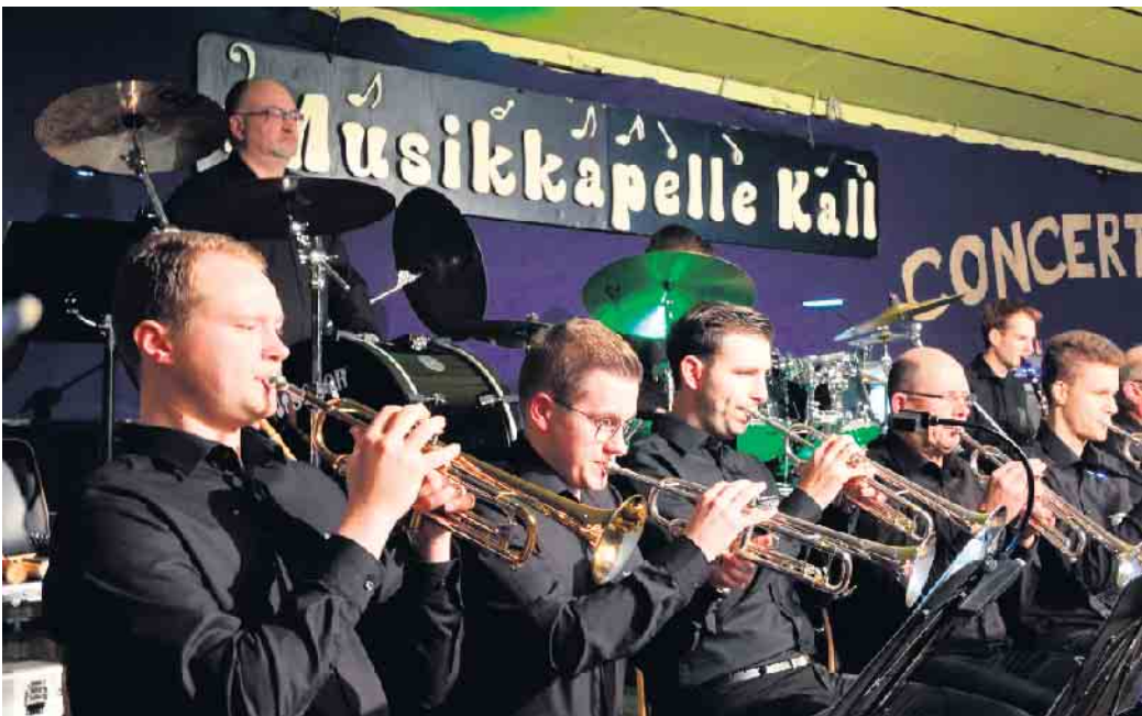
Zuletzt im Jahr 2019 konnte die Musikkapelle Kall ihr Konzert in der Bürgerhalle spielen. Nun geht's zurück in „d'r Hött“.