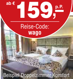
Beispiel Doppelzimmer Komfort

Preise ggf. zzgl. Wochenendzuschlag. Einzelzimmerzuschlag 2024: 30 €/Nacht, 2025: 35 €/Nacht Kurtaxe: ca. 2,30 € p. P./Nacht