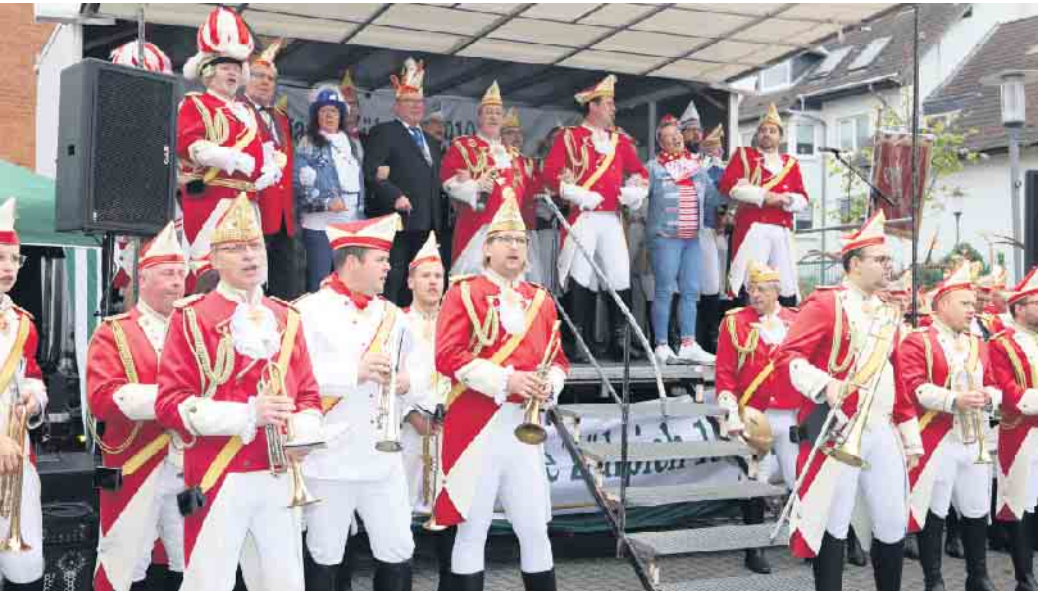
Jeck in der Römerstadt: hier feiern die Narren in die fünfte Jahreszeit