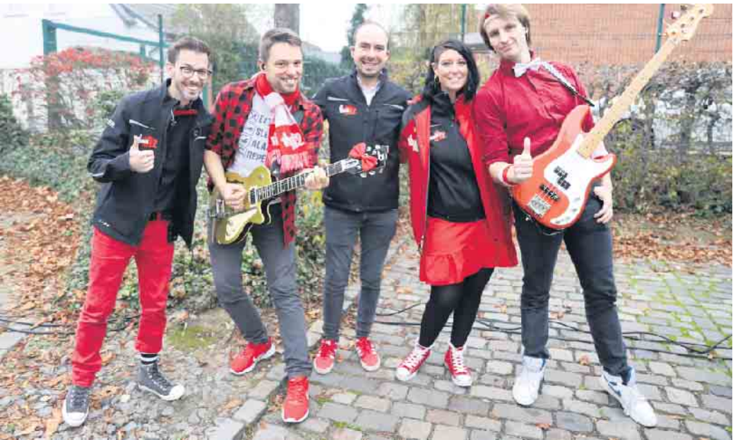
Musikalisch kam die Stimmungsband „Veedel for 12“ nach Zülpich. Mit ihren Songs heizte die Band die Gäste ein