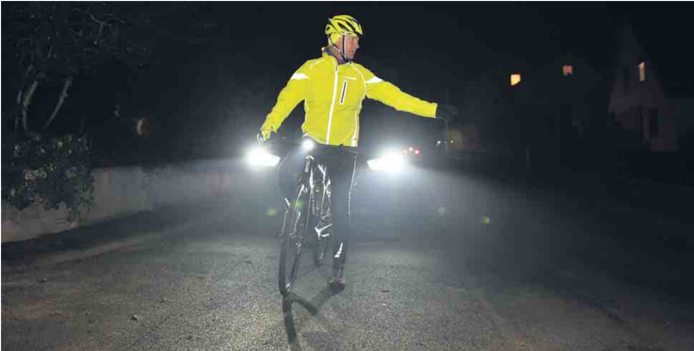
Reflektoren an der Kleidung sind in der dunklen Jahreszeit angesagt.