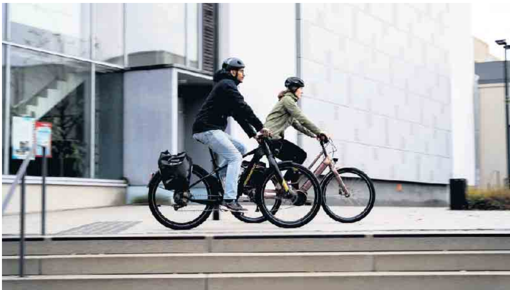
Dienstrad statt Dienstwagen: Viele Arbeitgeber bieten mittlerweile Leasingmodelle an.

Einfach zum Dienstrad kommen Wer sich für ein Dienstrad interessiert, findet zum Beispiel unter www.bike24.de Modelle für jeden Bedarf - vom Urban Bike über das MTB bis zum Lastenrad. Hier kann man zwischen acht renommierten Leasing-Anbietern wie JobRad, Bike-Leasing, BusinessBike oder anderen wählen. „Die Voraussetzung ist, dass man einen Arbeitgeber mit Sitz in Deutschland hat, der Fahrrad-Leasing anbietet“, so Martin-Birner. Das gewünschte Bike wird dann als Leasingfahrzeug bestellt, der Kundenservice leitet durch die weiteren Schritte. Am Ende der Leasingzeit kann das Rad entweder zurückgegeben oder günstig erworben werden. (DJD)