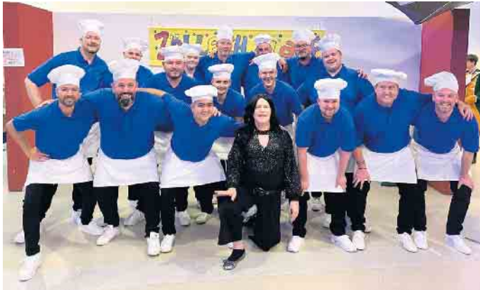
In diesem Jahr wählten die „Blue Funkys“ das Thema „Bella Italia - eine Liebesreise nach Italien“. Sie waren allesamt als Pizza-Bäcker verkleidet