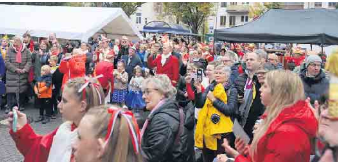
Wie auch bereits in den letzten Jahren fand die Veranstaltung im Rathausinnenhof statt