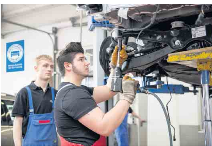
Der Kfz-Mechatroniker liegt bei jungen Männern auf Platz 1 der beliebtesten Ausbildungsberufe.

Ein typischer Einstieg in technische und kaufmännische Automobilberufe führt über den klassischen dualen Bildungsweg mit betrieblicher Ausbildung und Berufsschule. Unter www.wasmitautos.de gibt es eine Vielzahl von Informationen zu den Berufsbildern und ihren Anforderungen sowie einen Betriebsfinder zur Suche nach Ausbildungsplätzen. Auch die Karrierechancen durch Spezialisierungen und Höherqualifizierung werden beleuchtet.