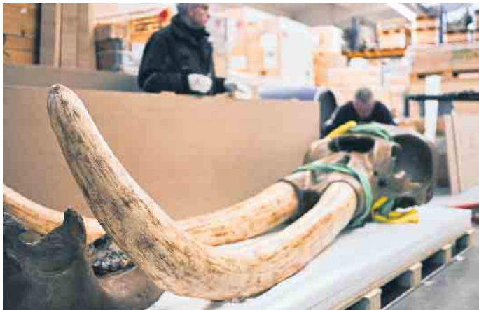
Das Amerikanische Mastodon war eine Art der Rüsseltiere aus der ausgestorbenen Gattung Mammut. Der Transport der kostbaren Zähne stellt auch für spezialisierte Kunstlogistiker eine Herausforderung dar.