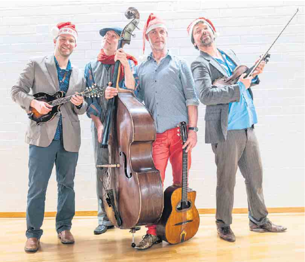
Monsieur Pompadour sorgt für swingende Weihnachtsstimmung.

Das multinationale Ensemble „Monsieur Pompadour“ gastiert in Bad Münster-eifel