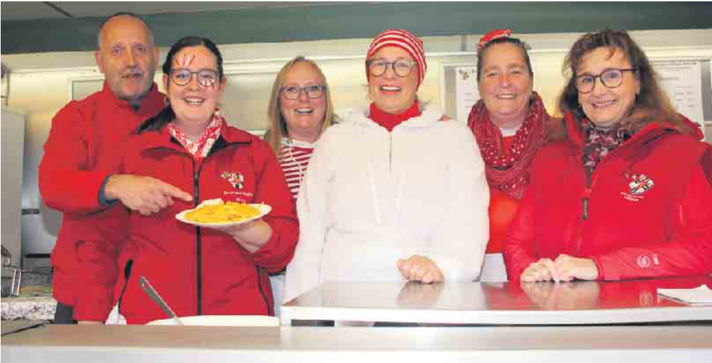
Das Team der Futterkrippe war für das leibliche Wohl der Jecken zuständig - hier gab es leckere Bratwürste und Fritten