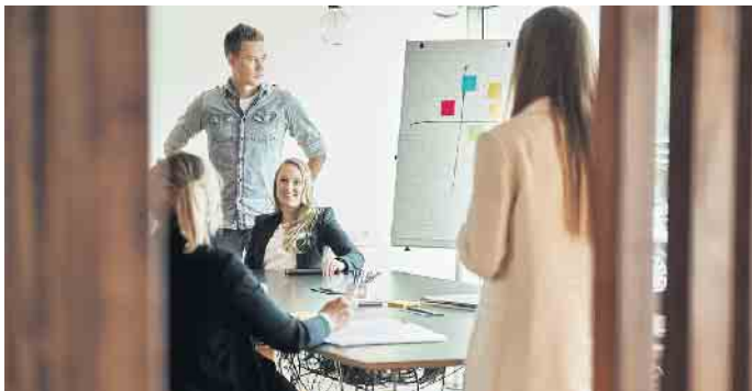
Abwechslung ist Trumpf: Beim Speziallogistiker kann jeder und jede Mitarbeitende permanent das Jobprofil verändern und nach einer internen Schulung quasi ‚horizontal‘ wechseln.