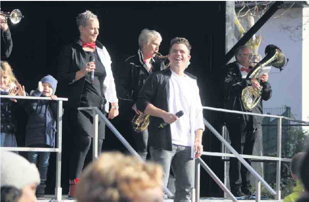
Musikalisch kam aus Eschweiler bei Aachen die Stimmungsband „Brass on Spass“ nach Zülpich. Mit ihren Stimmungshits heizte die Band die Gäste an