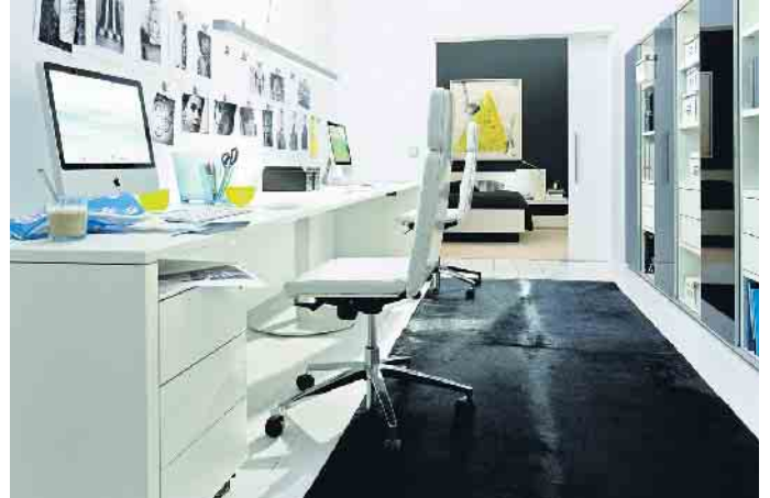
Rückenfreundliches Arbeiten bringt im Homeoffice und im Büro mehrere Anforderungen bei der Möbelauswahl mit sich.

Zur Standardausstattung der meisten Büro-Arbeitsplätze zählt der höhenverstellbare Schreibtischstuhl. Aber auch höhenverstellbare Schreibtische sind verstärkt im Kommen und besonders ergonomisch, denn Arbeiten im Stehen ist noch rückenfreundlicher als im optimierten Sitzen. Die optimale Sitzposition ist erreicht, wenn die Knie 90 Grad oder etwas mehr abgewinkelt sind, während die Füße gerade auf dem Boden stehen. Der Winkel zwischen Oberkörper und Oberschenkel sollte dabei mehr als 90 Grad betragen. Eine bewegliche Rückenlehne und Sitzfläche kommen