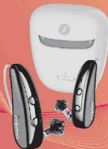
Pure Charge&Go IX