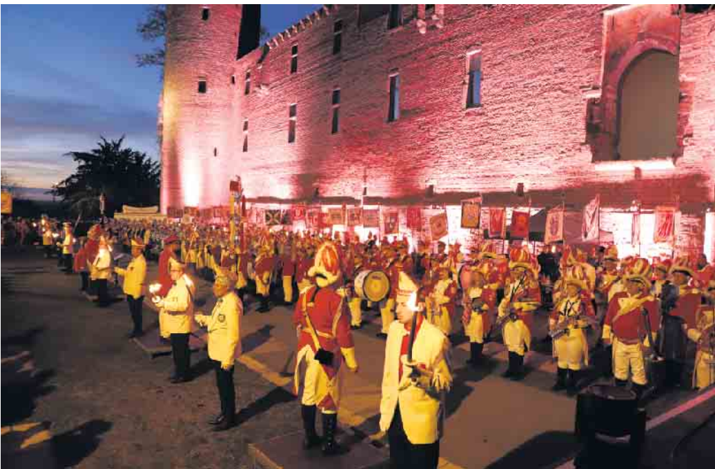
Der karnevalistische Zapfenstreich fand vor eindrucksvoller Kulisse statt