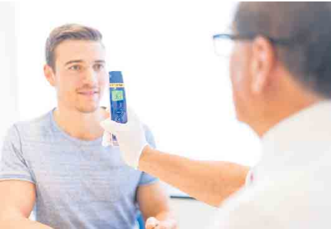
Auch eine persönliche Beratung gehört beim Blutspenden mit dazu.

zur Verfügung gestellt. Bei den letzten Terminen hat die Spendenbereitschaft in HELLENTHAL wieder zugenommen. Die DRK-Mitglieder des Ortsvereins sind froh, damit der angespannten Lage bei den Blutspenden entgegenzutreten zu können. Mit der Möglichkeit der Blutspenden vor Ort wie in der Hauptschule in HELLENTHAL will das DRK den Spendern auch kurze Wege zu einem solchen Termin ermöglichen.