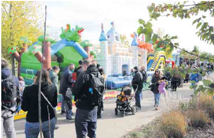
Das Drachenfest fand nun bereits zum neunten Mal in Zülpich statt. Ein vielfältiges Familienprogramm wurden im Seepark geboten