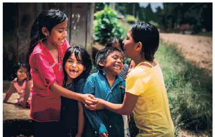
Tipps zur Nachlassgestaltung von den SOS-Kinderdörfern weltweit.