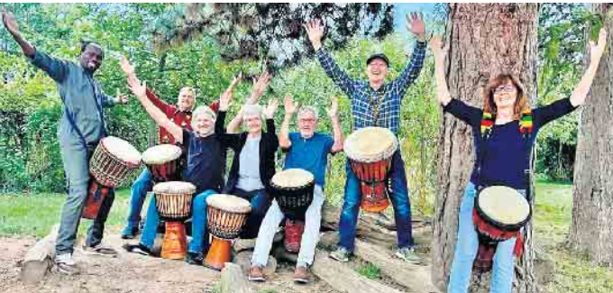
Als Vorgruppe spielt Pape Samory Secks Trommelgruppe „Kalebasse“.

Reservierungswünsche, die erst am Tag der Veranstaltung eingehen, können möglicherweise nicht mehr berücksichtigt werden.