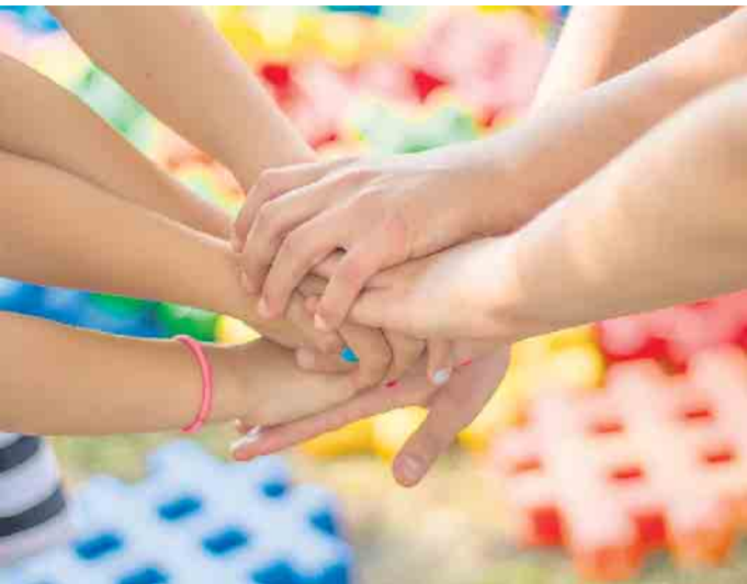
Das 33. unicef-Konzert der Musikschule Schleiden findet am 24. November im Clara-Fey-Gymnasium statt.

ser 33-jährigen Tradition möchten die Schülerinnen und Schüler der Musikschule Schleiden festhalten und laden herzlich zu ihrem jährlichen Wohltätigkeitskonzert ein. Statt findet das musikalische Spektakel zugunsten des Kinderhilfswerkes der Vereinten Nationen am Sonntag, 24. November, um 18 Uhr im Clara-Fey-Gymnasium Schleiden. Eintritt frei. „Diesmal wollen wir den Betrag mit einem interessanten Konzert nochmals erhöhen“, so Voeller weiter: „Traditionsgemäß wird kein Eintritt erhoben. Vielmehr appellieren alle Mitwirkenden an die Großherzigkeit, also die Spendenbereitschaft der Konzertbesucher.“ Weitere Infos gibt es unter www.musikschule-schleiden.de . pp/Agentur ProfiPress