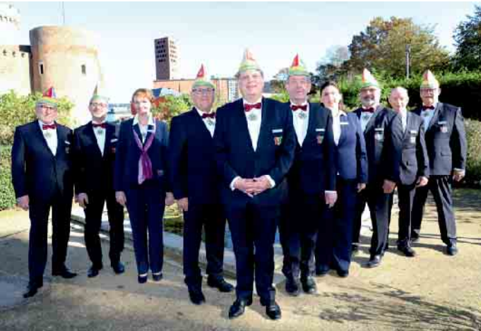
Das Präsidium des Regionalverbandes Düren freute sich auf die Feierlichkeiten in Zülpich