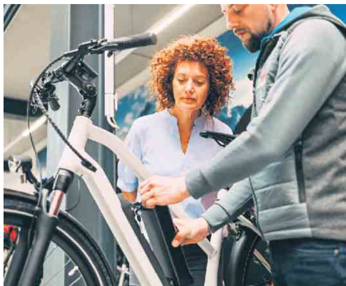
Vor der Winterpause sollte das E-Bike gründlich gewartet werden. Tipp: Den Akku abnehmen und separat an einem trockenen Ort ohne große Temperaturschwankungen lagern.