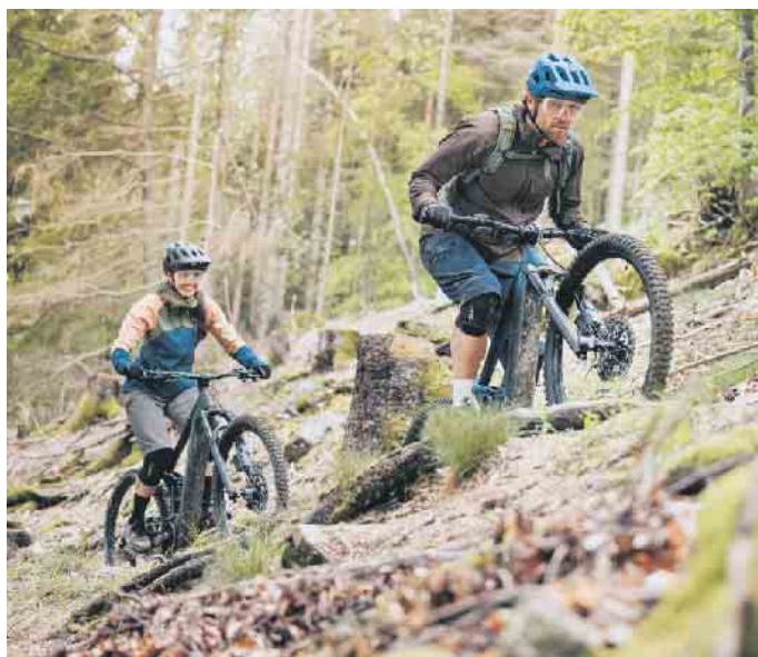
Aktiv etwas gegen den Winterblues tun und gleichzeitig die Fitness verbessern: Das geht mit dem E-Bike besonders gut.

kombiniert, ist das E-Biken: Dabei ist man an der frischen Luft unterwegs und profitiert von mehr Bewegung und Fitness im Alltag. Bereits eine tägliche Fahrt von rund 15 Kilometern kann das Herzinfarktrisiko um 40 Prozent senken, so eine Studie des Bundesverkehrsministeriums, der Leibniz-Universität Hannover und der Medizinischen Hochschule Hannover. Für viele ist das E-Bike inzwischen zum Personal Trainer geworden. Kein Wunder, denn bei Rädern mit elektrischer Unterstützung können Freizeitsportler sämtliche Fahrmodi an die eigenen Ansprüche anpassen. Das geht zum Beispiel mit dem Bosch-Antrieb und dem smarten System, das die Antriebseinheit, den Akku, das Display, die Bedieneinheit und das Smartphone samt der zugehörigen „eBike Flow App“