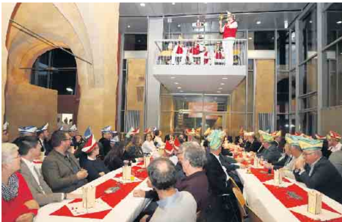
Vorstellung des Prinzen im Rat der Stadt Zülpich

Geschichte des Zülpicher Karnevals eingehen. Die Inthronisierung findet am Samstag, 23. November im Rahmen der großen Proklamationssitzung der „Zölleche Öllege“ im „Forum Zülpich“ statt. FH