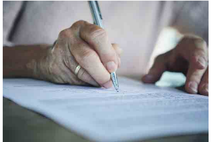
Tipps zur Nachlassgestaltung.

Wenn das engste Umfeld in die Überlegungen einbezogen wird, fördert das nicht nur Klarheit in Bezug auf die letzten Wünsche, sondern eröffnet auch einen Raum für den Dialog über Werte, die wichtig sind.