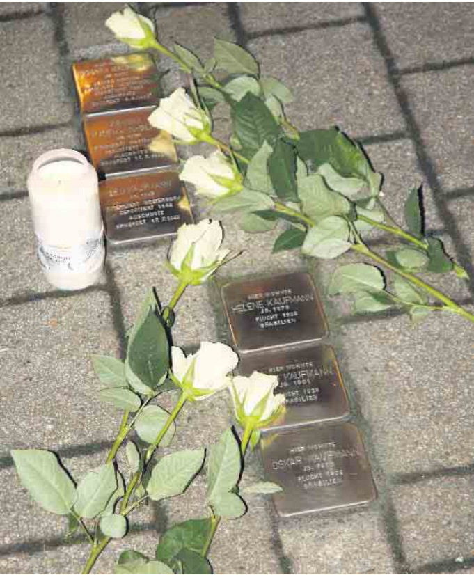
Auch beim diesjährigen Gedenkweg werden wieder Rosen und Kerzen an den Stolpersteinen niedergelegt.

Stolpersteine als Mahnmal gegen das Vergessen sind ein europaweites Projekt des Künstlers Gunter Demnig. Nachdem im letzten Jahr der Gedenkweg zum Jahrestag der Reichspogromnacht am 9.