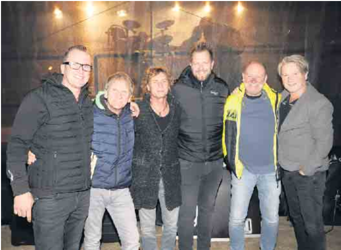
Am Abend rockten keine Geringeren als die „Paveier“ die Bühne