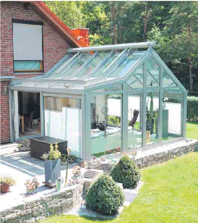
Ein Wintergarten in Wohnraumqualität erfordert sorgfältige Planung und muss auf die Nutzungswünsche der Bauherrenfamilie abgestimmt sein.