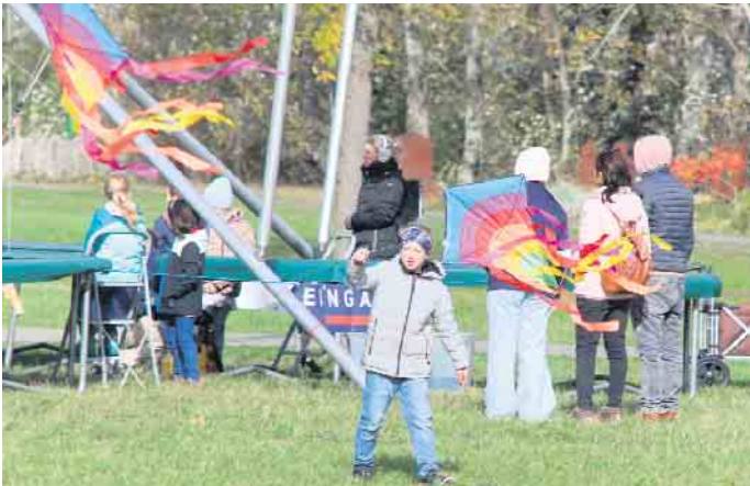
Beim gemeinsamen Drachensteigen auf der großen Wiese konnten gebastelte oder mitgebrachte Drachen in die Höhe steigen gelassen werden

Aber keine Angst, der Abstand zum letzten lebenden Drachen der Welt wurde eingehalten. „Die feurige Drachenshow steht ganz klar im Mittelpunkt der Veranstaltung, dennoch lohnt sich ein Besuch auch dank der vielen anderen Aktionen an diesem Tag: besonders das Kürbisschnitzen und die Hexenflugschule haben sich zu Publikumsbeliebten etabliert.“ be-