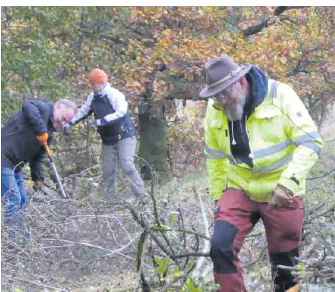
Ein Trupp des Bergwaldprojektes e.V. bei der anstrengenden Entbuschungsarbeit.

Gemeinde Blankenheim gehört ein Teil des alten Bahndamms dazu. Der Bahndamm mit dem alten Gleisbett ist seit Jahren ohne Nutzung. Nach Stilllegung der Bahnlinie war hier ein „Magerrasen aus 2. Hand“ entstanden: Trockentolerante Blütenpflanzen lockten insbesondere Insekten an, das offene, nur schütter bewachsene Gleisbett bot Lebensraum für Reptilien und Amphibien. Diese Maßnahme war nur so möglich, weil verschiedenste Partner sich einig waren: Die EifelStiftung, die sich auch bestimmte Naturschutzziele als Stiftungszweck gesetzt hat, hat als Eigentümerin dieses Bahndammabschnitts diesen kostenfrei zur Verfügung gestellt, „LIFE helle Eifeltäler“ hat die Maßnahme geplant und notwendige Genehmigungen eingeholt und das