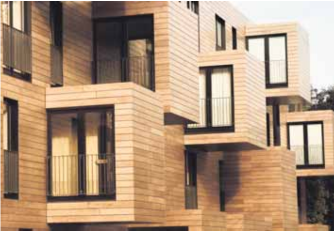
Holz zählt zu den ältesten Baumaterialien, die der Mensch nutzt - und ist unter Aspekten des Klimaschutzes gleichzeitig Rohstoff der Zukunft.

Ökologie und Vielseitigkeit sprechen für den nachwachsenden Rohstoff