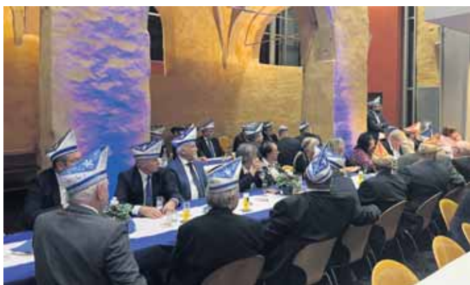
Vorstellung der neuen Tollität der Stadt Zülpich in den Räumlichkeiten der Marienkirche