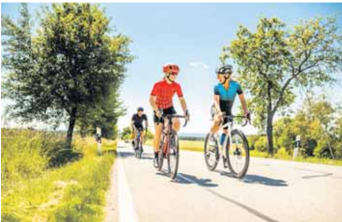
Alles Typsache: Für sportliches Fahren mit hoher Geschwindigkeit ist ein Rennrad das Richtige.

über die Verwendung im Klaren zu sein: Möchte man das Fahrrad im Alltag oder eher sportlich nutzen? Je nach Einsatzzweck gibt es unterschiedliche Fahrradtypen. Sport, Einkauf oder Arbeitsweg Für sportliche Aktivitäten abseits der Straße empfiehlt sich aufgrund der guten Geländegängigkeit und Federung ein Mountainbike. Wer hingegen lange Strecken mit höherer Geschwindigkeit fahren möchte, sollte sich ein Rennrad zulegen. Es ist leicht und auch dank der sportlichen Sitzposition besonders aerodynamisch. Eine