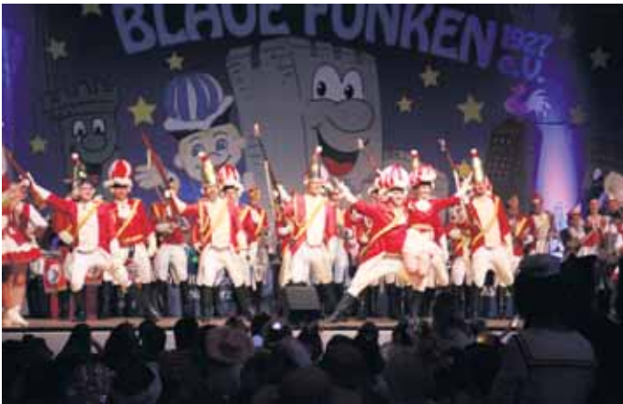
Prinzengarde Zülpich 1910 e.V.