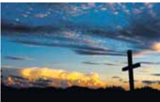
Die Bestattungskultur wandelt sich zunehmend.