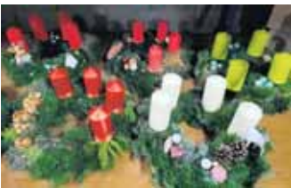
Die vielen Kränze (Archivfoto 2020) werden erst wenige Tage vor dem Basar aus frischem Grün gebunden

Der Basar, den Stefan nach überstandener Leukämie mit seiner Familie ins Leben rief, ist mittlerweile im Bad Münstereifeler Stadtgebiet