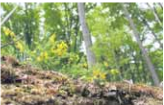
Nachwachsender und klimafreundlicher Rohstoff: Holz speichert während seines Wachstums große Mengen an Kohlendioxid.

Holz zählt zu den ältesten Baumaterialien, die der Mensch nutzt - und ist gleichzeitig Rohstoff der Zukunft. Unter dem Aspekt des klimafreundlichen und nachhaltigen Bauens gewinnt Holz erneut an Bedeutung. Rund ums Haus kommt viel Holz zum Einsatz: vom Dachstuhl über Fußböden und Verkleidungen hin zu Türen und Möbeln. Neben Fenstern, Fassaden und Außenbereichen aus Holz finden aber auch ganze Holzhäuser, wie