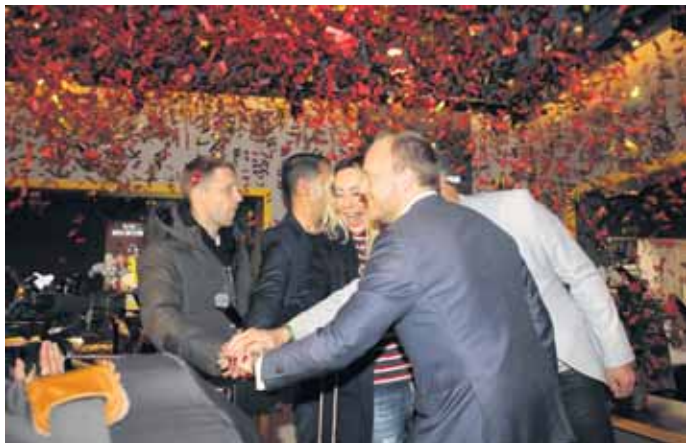
Zur Eröffnung wurde ein Buzzer gedrückt der Glitter und Konfetti spektakulär auslöste