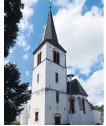
Sankt Barbara, Rescheid