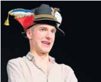
Sein Hut, der hat vier Ecken