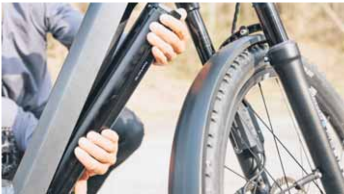
Der Akku bildet das Herzstück des E-Bikes. Mit dem richtigen Laden, Lagern und einigen Tipps zur Pflege lässt sich die Lebensdauer des Energiespenders verlängern.

Tipps für ein sicheres und nachhaltiges Handling des Energiespenders