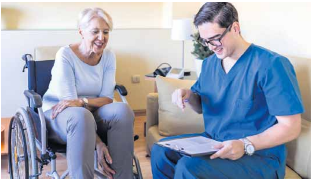
Ein Pflegeberuf bringt viel Kontakt mit anderen Menschen mit sich.

Jobs in der Pflege sind sinnvoll und gut bezahlt