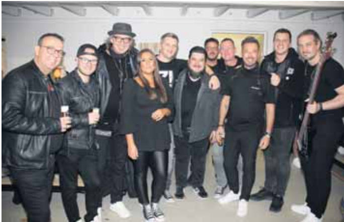
Rockten die Mädchensitzung: die Räuber und die Band Zack! Rocking Fastelovend