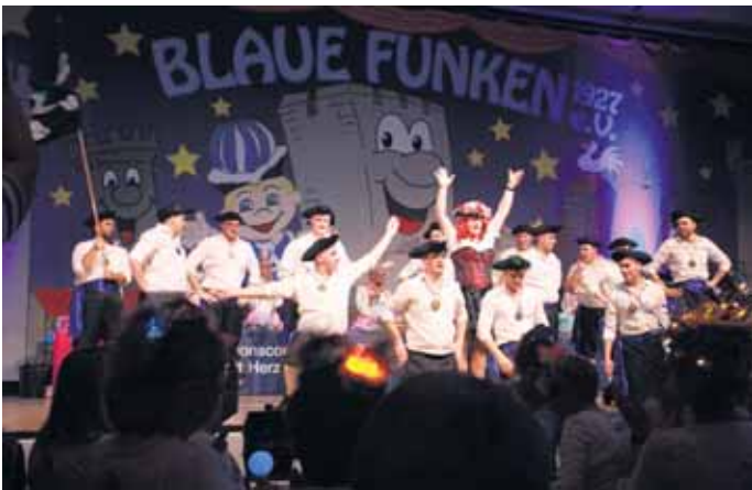
Mit den Mädels im Forum gingen die Freibeuter der Blue Funkys tänzerisch auf Beutezug durch die Gassen der Stadt

men im ausverkauften Forum mit den Songs „Wigga digga“, „Für die Ewigkeit“ oder den aktuellen Sessiontitel „Oben, unten“ verdient ergattert. Den Abschluss der Sitzung ließen sich die Blauen Funken nicht nehmen. Das Traditionscorps mit Herz zog mit allem auf die Bühne was der Corps an diesem Tag zu bieten hatte. Doch hier war noch