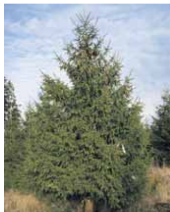
Die Bäume werden erst kurz vor dem Verkauf frisch geschlagen.

Wer sich über die Tätigkeiten und Inhalte des Projekts „Arbeit Teilen mit Menschen mit Behinderung“ informieren möchte, kann gerne dienstags, mittwochs und donnerstags, in der Zeit von 9 bis 12 Uhr in unserem Möbellager, Karl-Kaufmann-Straße 8 in Schleiden vorbeischauchen. Wir freuen uns auf Ihren Besuch!