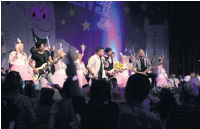
Stürmten musikalisch die Bühne: die Domstürmer

lange nicht Schluss. Bis in die frühen Morgenstunden feierte man mit dem DJ von K-B Eventtechnik bei der After-Show-Party im Foyer des Forums weiter. Stolz konnten die Blauen Funken bereits zu Beginn der Sitzung verkünden, dass die Jubiläums-Mädchensitzung am Samstag 9. November 2024 schon jetzt ausverkauft ist. FH