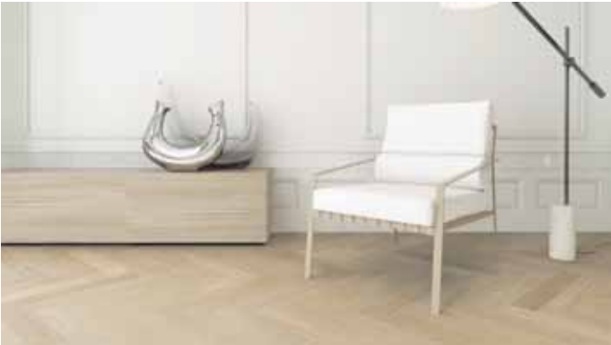
Beim feuchten Wischen gilt es, immer ein zur Oberfläche passendes Reinigungsmittel zu verwenden.

Mit der richtigen Pflege glänzt Parkett auch noch nach Jahrzehnten