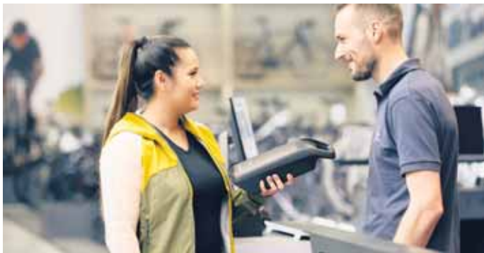
Rat vom Profi: Fahrradfachhändler können den Zustand des Akkus überprüfen, zudem nehmen sie verbrauchte oder defekte Energiespenders zurück.

de und schützt die Zellen vor Überlastung. Erkennt das System ein Problem, schaltet es den Akku automatisch zum Schutz des E-Bikers ab. Beim Fahrradfachhändler können E-Biker den Zustand des Akkus fachgerecht überprüfen lassen. Übrigens sollten defekte, alte oder „verbrauchte“ Akkus aus Sicherheitsgründen nicht repariert oder aufgefrischt werden. Händler nehmen den alten oder defekten Akku kostenlos zurück und führen ihn dem Recycling zu. (DJD)