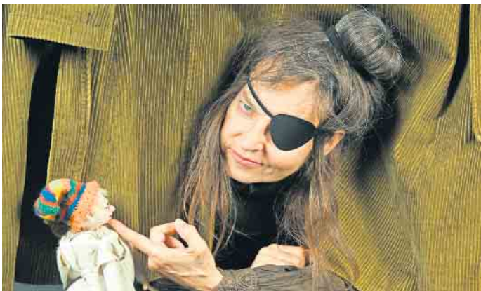
Glückskind Felix begegnet der Räubermutter

dem die Habgier des Menschen thematisiert ist. Das „theater 1“ gibt der Geschichte einen zeitgemäßen Rahmen: Ilse Müller ist anders und so sieht sie auch aus: „Strange“ würde man auf Neudeutsch sagen. Sie mag alte Sachen, repariert gern und bewahrt Dinge vor dem Mülleimer. Hin und wieder führt sie Selbstgespräche, denn dabei