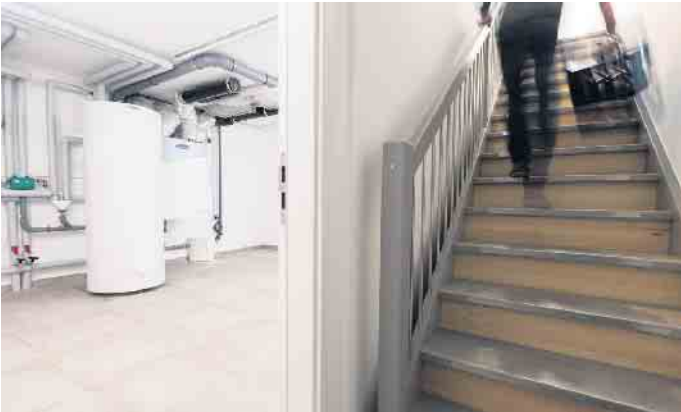
Ein kleiner Keller kann die oberen Stockwerke gut und effizient entlasten.

Bodenplatte. Ein passgenaues Zusammenspiel aus Haus, Keller und Bodenplatte sei bei den qualitätsgeprüften Keller- und Bodenplattenherstellern mit dem RAL-Gütezeichen „Fertigkeller“ sichergestellt, so Wetzel. Ein weiterer Vorteil: Teilkeller sind mehr oder weniger flexibel unter dem Haus platzierbar. Eine praxistaugliche Anbindung ans Versorgungsnetz des Hauses sowie eine hinreichende Be- und Entlüftung sind allerdings zu beach-