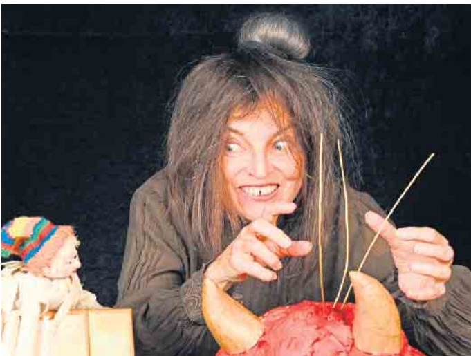
Das Glückskind bei des Teufels Großmutter

wird ihr vieles klarer. Gemeinsam mit ihrem Mann arbeitete sie einst in einer Mühle. Es war die schönste Zeit in ihrem Leben, obwohl ihr größter Wunsch ihnen verwehrt blieb, nämlich eigene Kinder zu bekommen. Aber dann kam eines Tages eine kleine Schachtel über den Bach zu ihnen geschwommen, darin lag ein winziges Baby. Noch wusste niemand, dass dieses Kind sich in