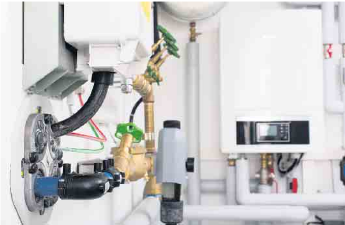
PM-2022-GUEF-Teilkeller-3[1].jpg „Haustechnik ist nirgends besser aufgehoben als im Keller.“

ten. Praktischerweise schließt zudem die Kellertreppe an die Erdgeschossstreppe an. „Die Kellerexperten arbeiten im Zuge der individuellen Planung verschiedene Möglichkeiten aus“, sagt der GÜF-Vorsitzende und schließt: „Die Haustechnik ist nirgends besser aufgehoben als unter dem Erdgeschoss. Wer sich also gegen eine Vollunterkellerung entscheidet, sollte wenigstens einen kleinen Keller einplanen statt gar keinen Keller.“ GÜF/FT