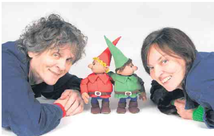
Himpelchen Pimpelchen und ihre beiden „Lehrlinge“

Karten gibt es an der Tageskasse; es wird empfohlen, unter 02257/4414