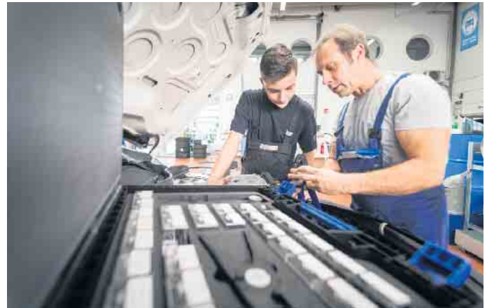
Eine Ausbildung im Kfz-Gewerbe eröffnet vielfältige Berufsbilder und Karriereoptionen.

Dazu werden die Perspektiven aufgezeigt, die sich für die Berufseinsteiger nach dem erfolgreichen Ausbildungsabschluss eröffnen. So bringt bereits eine zweijährige Weiterbildung Spezialisierungen innerhalb des gewählten Ausbil-