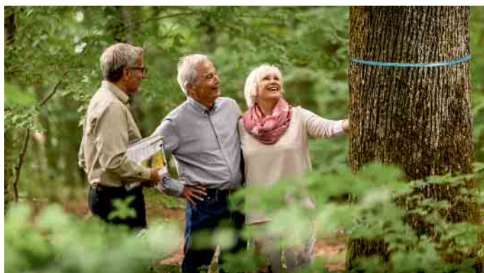
Ein freier Baum, der als Ruhestätte infrage kommt, ist mit einem farbigen Band markiert.

Kostenlose Waldführungen informieren über mögliche Arten einer Grabstätte