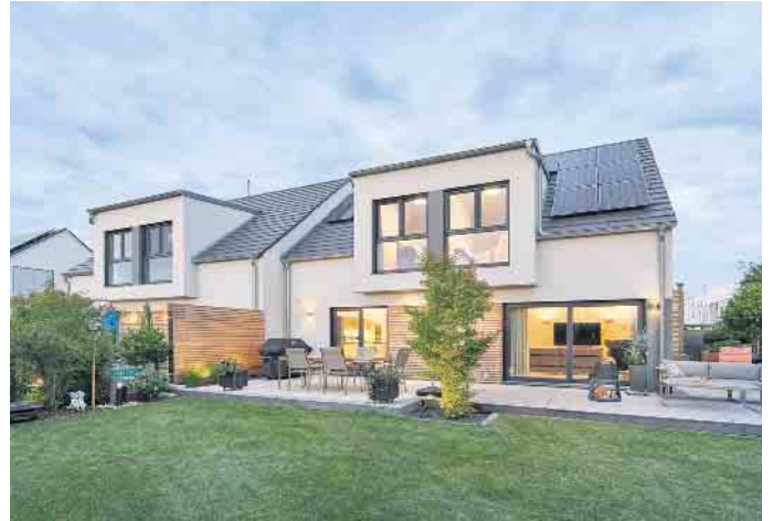
PM-2022-BDF-Doppelhaus-1[1].jpg Doppelhaus in Fertigbauweise - das geht achsensymmetrisch oder auch grundverschieden.

Gute Gründe für einen Hausbau gibt es viele - auch oder gerade in unsicheren Zeiten, in denen das Eigenheim ein zukunftssicherer Rückzugsort, eine inflations-sichere Kapitalanlage und rentenunabhängige Altersvorsorge ist. Auf dem Weg ins Eigenheim müssen Baufamilien allerdings auch Herausforderungen bewältigen wie die Grundstückssuche oder die Hausfinanzierung. Achim Hannott, Geschäftsführer des Bundesverbandes Deutscher Fertigbau (BDF), bringt das Doppelhaus ins Spiel: „Beim Doppelhaus verhelfen sich zwei bauinteressierte Parteien gegenseitig zu einem eigenen Haus mit all seinen Vorzügen: Denn die Bau- und Grundstückskosten sind durch zwei geteilt günstiger und der Energiebedarf ist im Doppelhaus fast immer niedriger als bei zwei