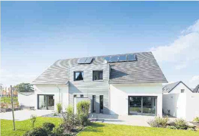
Fertighäuser sind besonders energieeffizient - als Doppelhaus umso mehr.

Haushälften mit der jeweils gewünschten Hausausstattung“, erklärt der BDF-Geschäftsführer. So entstehen unter einem Dach zwei verschiedene Wohneinheiten, bei denen auch die Fassadengestaltung und die Dachform voneinander abweichen können, sofern es der Bebauungsplan erlaubt. Was sind die Vorteile eines Doppelhauses? Wand an Wand mit Freunden, Familie oder Bekannten - das bietet schon beim Hausbau einen großen Vorteil: Die Planungs- und Baukosten werden durch zwei Parteien geteilt und sind dadurch geringer als bei zwei getrennt voneinander stehenden Einfamilienhäusern. Zudem lässt sich durch ein Doppelhaus wertvolle Grundstücksfläche einsparen, denn nur die Außenwände müssen den gesetzlich vorgeschriebenen