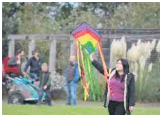
Beim gemeinsamen Drachensteigen auf der großen Wiese konnten gebastelte oder mitgebrachte Drachen in die Höhe steigen gelassen werden