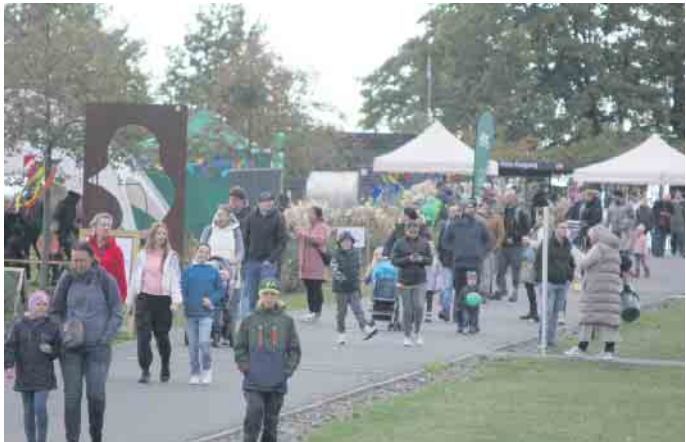
Buntes Familien-Programm rund um den feuerspeienden Drachen mit Drachensteigen, Kürbisschnitzen und vieles mehr wartete Ende Oktober auf die Besucher im Zülpicher Seepark