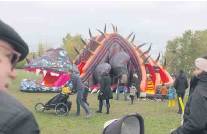
Hoch hinaus ging es auf der Drachen-Hüpfburg