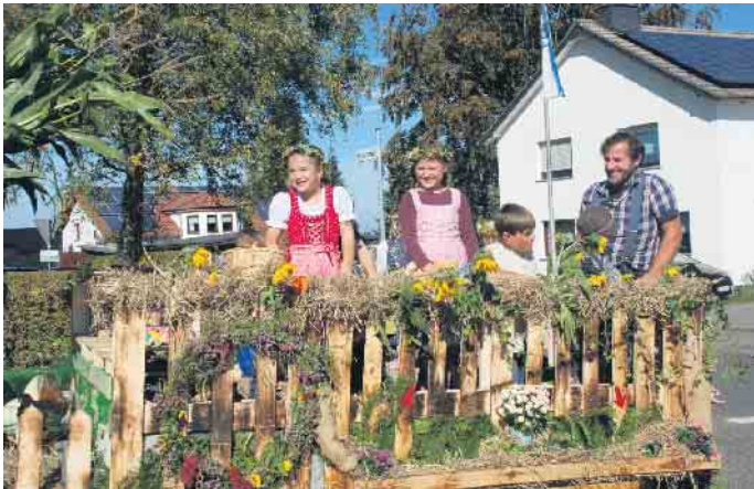
Die Freude unter den Zugteilnehmern war groß

Auch in diesem Jahr fand wieder der traditionelle Erntedankumzug von Harperscheid nach Schönesseiffen statt. Bei herrlichem Sonnenschein zogen am 1. Oktober die Bürger der beiden Schleiden Stadtteile froh gelaunt durch die Straßen ihrer Heimatdörfer und präsentierten stolz die mannigfaltige Ernte der Früchte aus Feld und Garten. Neben den viel-