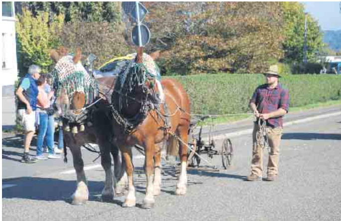
Auch Tiere durften nicht fehlen

fach in alten Bauerntrachten gekleideten Fußgruppen fanden auch alte Traktoren, die sowohl die liebevoll dekorierten Hänger als auch landwirtschaftliche Geräte aus grauer Vorzeit zogen, das rege Interesse der zahlreichen Zuschauer an den Straßenrändern. Mit großem Eifer waren auch die Kinder aus den beiden Nachbarorten bei der