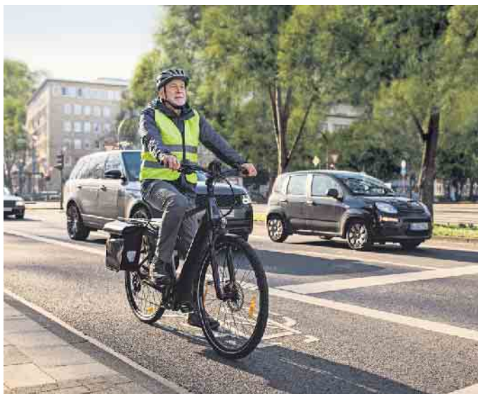
Die bundesweite Kampagne „Tour de Freude - sicher unterwegs mit dem Pedelec“ will Unfällen mit dem Pedelec vorbeugen.

Mit der zunehmenden Verbreitung von Elektrofahrrädern stiegen in den vergangenen Jahren auch die Unfallzahlen: Im Jahr 2021 verunglückten laut Statistischem Bundesamt 17.045 Men-