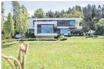
Flaches Dach, kubische Baukörper - das kommt bei vielen Bauherren gut an.

bandes Deutscher Fertigbau (BDF). Aber warum ist gerade die Bauhausarchitektur bei Bauherren wieder so beliebt? „Weil sie zeitlos ist“, glaubt Tews. Zum einen könnten reduzierte kubische Gebäudeformen einen willkommenen Gegenpol zur Reizüberflutung und Komplexität einer schnelllebigen sowie weitreichend digitalisierten und globalisierten Gesellschaft darstellen. Zum anderen sei die sachliche Bauhaus-Architektur für viele Menschen Ausdruck von Individualität und Stilsicherheit. „Auch bei anderen Alltagsgegenständen wie Autos, Möbeln oder Smartphones sind funktionale, möglichst schnörkellose Designs beliebt“, so der BDF-Sprecher. Wenn gewünscht hätten Bauherren von Fertighäusern zudem alle Freiheiten, gezielt Akzente zu setzen mit individueller Ausstattung, mit Formen, Farben und Materialien oder mit architektonischen Ergänzungen wie einem Erker, einer Dachterrasse oder einem Carport. Besonders einfach und komfortabel sind Fertighäuser für den Bauherren, wenn er sich für eine schlüsselfertige Bauausführung entscheidet. Laut einer Umfrage un-