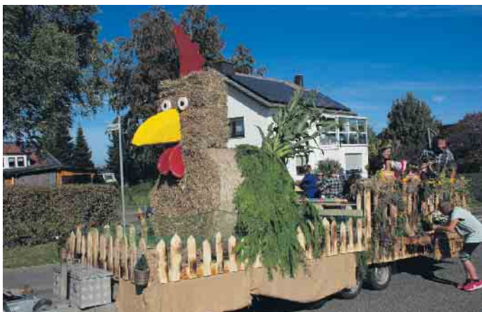
Viel Liebe fürs Detail