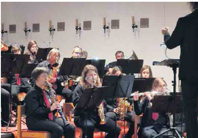
Konzert 2022 in Hellenthal

Eifelblasorchester Rescheid in Rescheid und Hellenthal