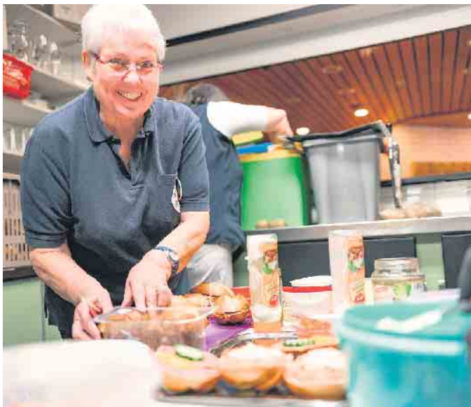
Ein gute Stärkung nach der Blutspende gehört wieder mit dazu. Die Mitglieder des DRK-Ortsvereins Hellenthal bereiten dazu alles vor.