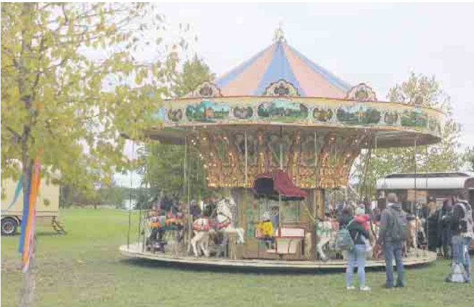
Etwas gemütlicher konnten es die kleinen Drachenzähmer auf dem Pferdekarsussell angehen lassen

schminken lassen oder bei einem Flug auf dem Flying Fox Kletter- und Seilrutschenpark mit rund 40 km/h über den See rasen. Für das leibliche Wohl ist beim Drachenfest bestens gesorgt gewesen. Für die ganze Familie gab es gleich an mehreren Stationen köstliche Angebote, darunter Kaffee und Kuchen im Seehaus. FH