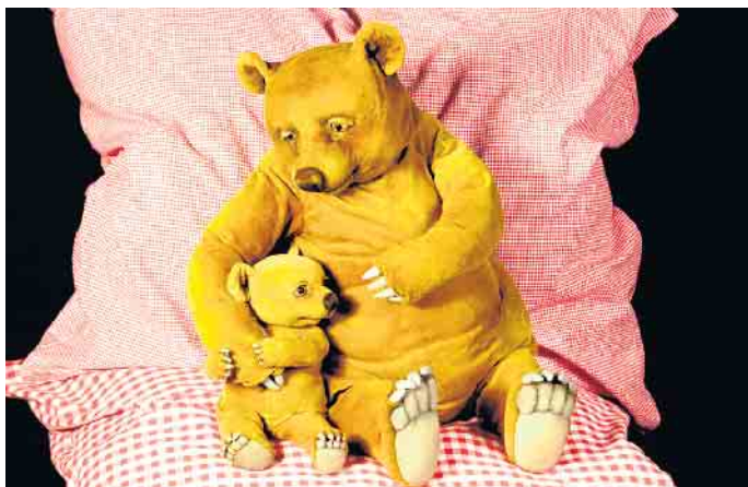
Kleiner Bär und großer Bär.

Kuscheliges Figurentheater im „Kulturhaus theater 1“, für Kinder ab 4