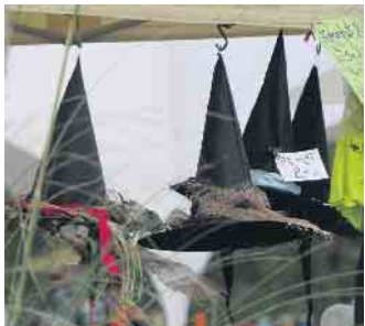
Wer noch auf der Suche nach der richtigen Kopfbedeckung war, wurde im Seepark bestimmt fündig