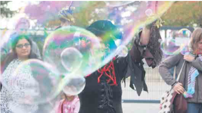
Diese freundliche Hexe zauberte für die großen und kleinen Besucher Riesenseifenblasen