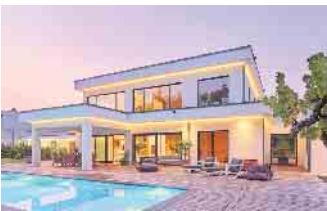
„Die Bauhausarchitektur ist Ausdruck von Individualität und Stilsicherheit.“

Fertighäuser zeigen Merkmale der Bauhausarchitektur