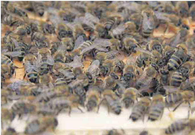
Honigbienen auf Wabe