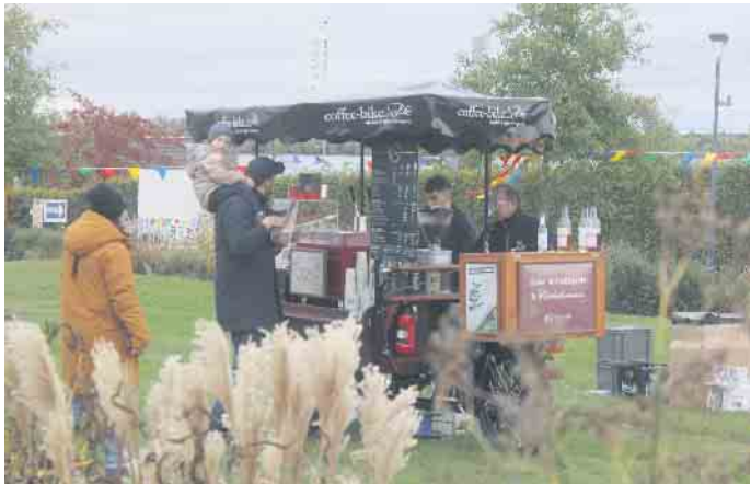
Für die ganze Familie gab es gleich an mehreren Stationen köstliche Angebote