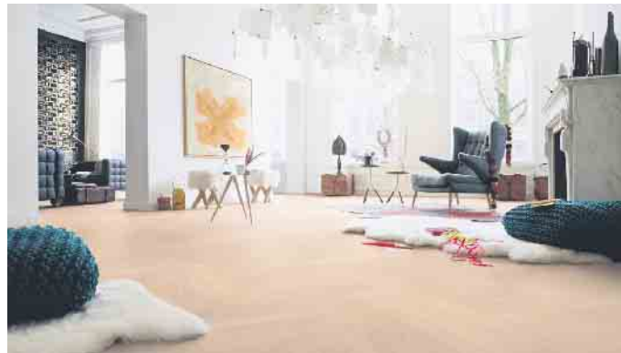
Parkett im Fischgrätmuster gibt weitläufigen Räumen Struktur.

Helle Holzarten lassen kleine Räume großzügiger und offener wirken. Auch Zimmer mit wenig Tageslicht profitieren von einem hellen Bodenbelag, der den Raum freundlicher erscheinen lässt. In großen Räumen ent-