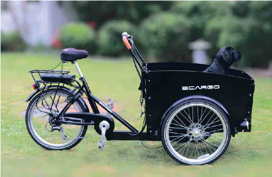
Grundsätzlich ist das Lastenrad eine sichere Methode, nicht nur Güter, sondern durchaus auch Kinder oder Tiere zu befördern.