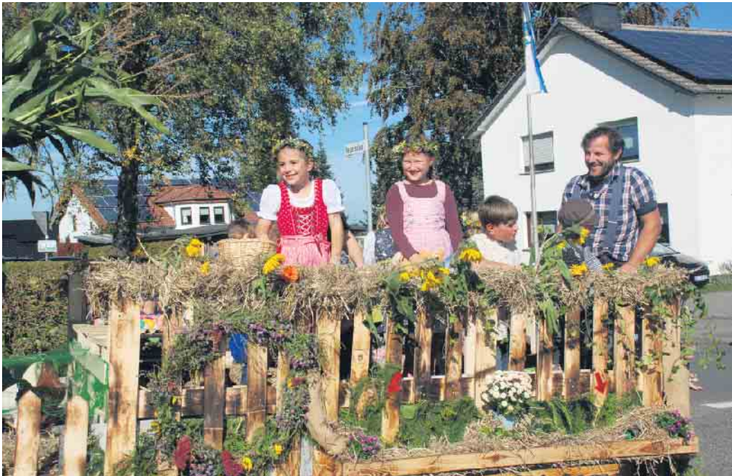
Die Freude unter den Zugteilnehmern war groß

Auch in diesem Jahr fand wieder der traditionelle Erntedankumzug von Harperscheid nach Schöne-seiffen statt. Bei herrlichem Sonnenschein zogen am 1. Oktober die Bürger der beiden Schleiden-er Stadtteile froh gelaunt durch die Straßen ihrer Heimatdörfer und präsentierten stolz die mannigfaltige Ernte der Früchte aus Feld und Garten. Neben den vielfach in alten Bauerntrachten gekleideten Fußgruppen fanden auch alte Traktoren, die sowohl die liebevoll dekorierten Hänger als auch landwirtschaftliche Geräte aus grauer Vorzeit zogen, das rege Interesse der zahlreichen Zuschauer an den Straßenrändern. Mit großem Eifer waren auch die Kinder aus den beiden Nachbarorten bei der Sache und verteilten selbstgebackenen Kuchen oder Eier an die Schaulustigen. Ziel des von der Feuerwehr geleiteten und vom Musikverein Schöne-seiffen sowie dem Tambourcorps Dreiborn musikalisch unterstützten Zugs war das Vereinshaus in Schöne-seiffen. Dort hatten einige Aussteller ihre Verkaufsstände mit zum Anlass passenden Waren aufgebaut. Selbstverständlich durften auch die