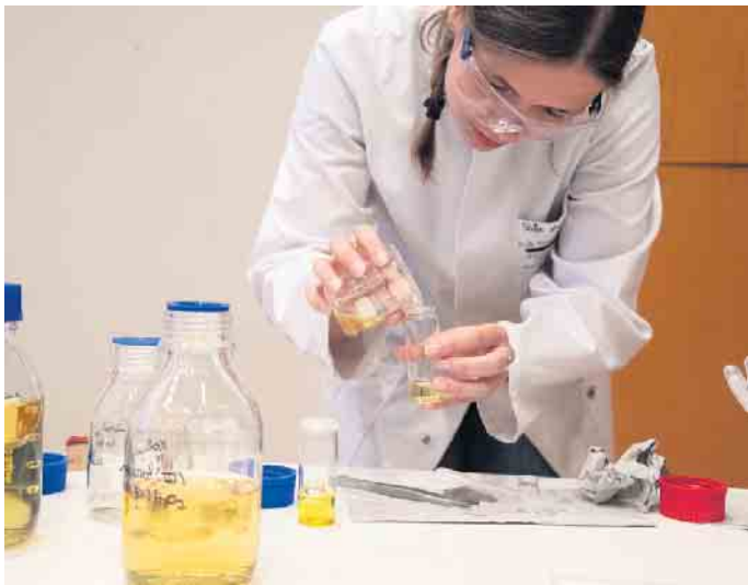
Da steckt der Pfiff im Knick: Chemie der Knicklichter.

lichter im Dunkeln? Nur zwei von vielen spannenden Fragen, mit denen sich an Schulen die MINT-Fächer (Mathematik, Informatik,