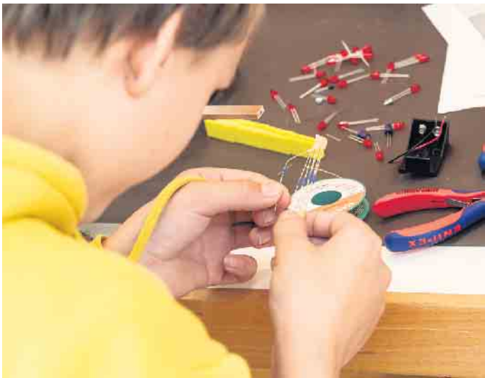
Vom Widerstand ohne Widerstand bei den JSG-lern

JSG-Schülerinnen und Schüler werden zu MINT-Forschern bei der ANTalive Jubiläumsfeier