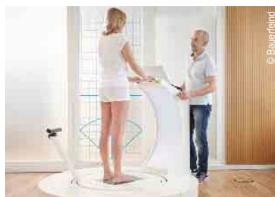
3D-Vermessung für Kompressionsstrümpfe und orthop. Einlagen