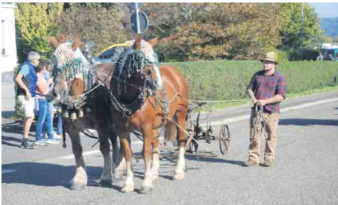
Auch Tiere durften nicht fehlen