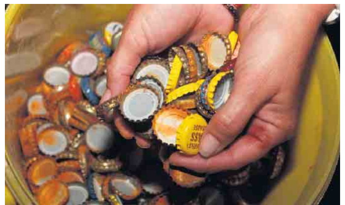
Weißblech-Verschlüsse für den guten Zweck: Bevor diese in den Müll kommen, ist jeder herzlich eingeladen diese aufzubewahren, so sind im letzten Jahren 17 Tonnen zusammengekommen.