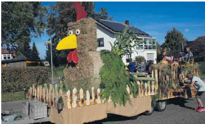
Viel Liebe für's Detail