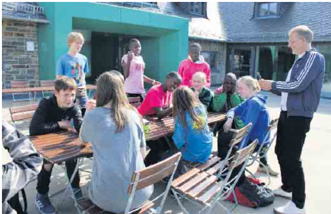
Mittagspause auf Vogelsang