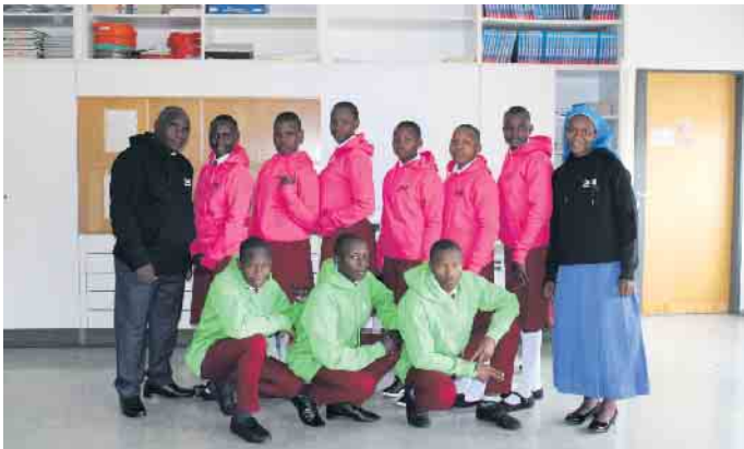
Unsere Gäste ausgestattet mit JSG Merch.