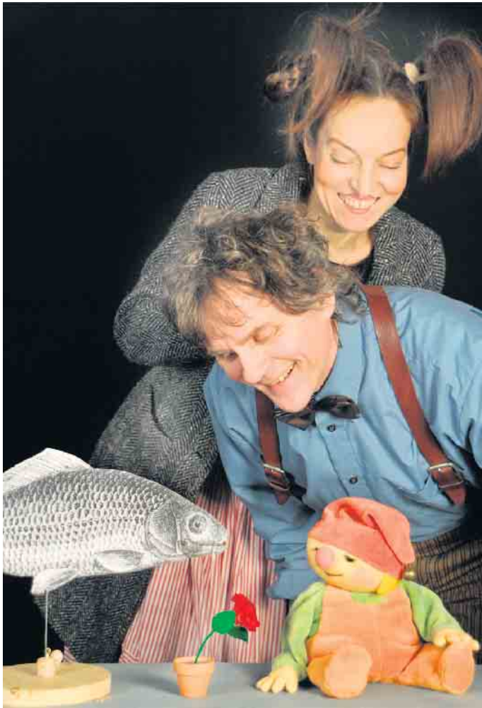
Goethe, Wassermäus und Kröte.

Das Stück bietet zudem die überaus seltene Gelegenheit, Jo-