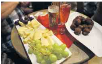
Bei gekühlten Getränken und gutem Essen verging der gesellige Abend wie im Flug. Was ein herrliches Ambiente. Ein rundum gelungener Abend im Zeichen der Traditions- und Brauchtumspflege im Gardequartier Münstertor der Prinzengarde Zülpich 1910 e.V.

tränken und gutem Essen verging der gesellige Abend wie im Flug. Was ein herrliches Ambiente. Ein rundum gelungener Abend im Zeichen der Traditions- und Brauchtumspflege im Gardequartier Münstertor der Prinzengarde Zülpich 1910 e.V. FH