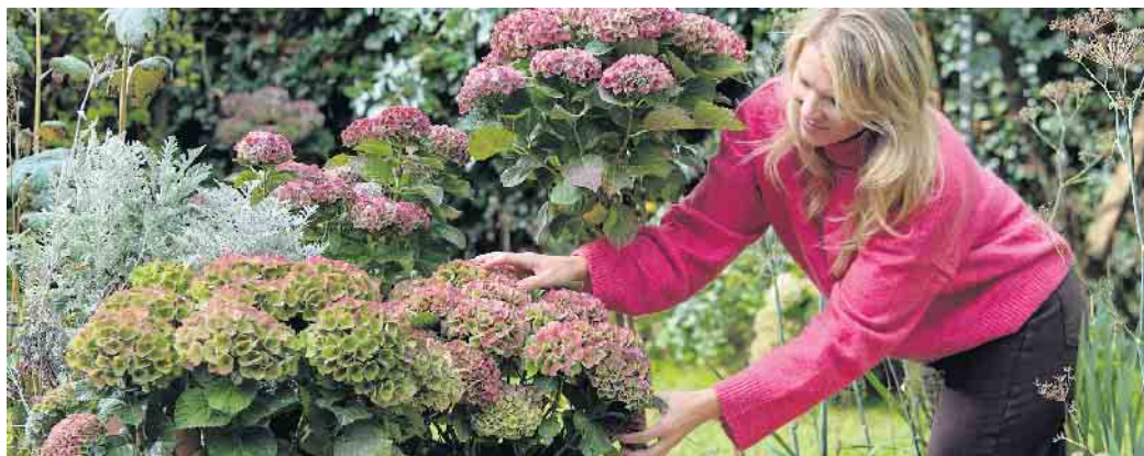
Auf der Terrasse oder vor dem Hauseingang machen sich Hortensien in Töpfen gut, kombiniert mit verschiedenen farbigen Kürbissen.