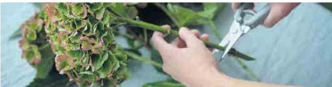
Verwenden Sie für den Schnitt der Hortensie eine scharfe, saubere Pflanzenschere. Dadurch lässt sich unnötiger Schaden vermeiden.

sicht: Bitte nicht zu viel schneiden. Die Initiative Magical Hydrangea, ein Zusammenschluss europäischer Hortensien-Züchter, empfiehlt, den Hauptschnitt der Hortensien erst im Frühjahr vorzunehmen und für Dekorationen möglichst schonend vorzugehen. Denn die Bauernhortensien legen bereits die Knospen für das nächste Jahr an - unter den alten Dolden, die wiederum als Schutz gegen Frost dienen. Daher ist es wichtig, bewusst Zweige auszuwählen, die im hinteren Bereich und nicht zu nah beieinander liegen - um die Gefahr zu minimieren, im kommenden Sommer eine unschöne Lücke in der Hortensie zu haben. Ein Jahr später wird sie sich aber bereits wieder gefüllt haben - also keine Sorge! Beachtet man diesen Hinweis, können Hortensien wunderbar in die herbstlichen Deko-Ideen integriert werden. Mit ihren warmen Farben und der schönen Blütenstruktur bieten sie sich hierfür perfekt an und machen jede Feier zu einem Fest. Weitere Informationen zur Hortensienpflege gibt es auf www.magicalhydrangea.com/de/pflege-hortensien/ . Magical Hydrangea