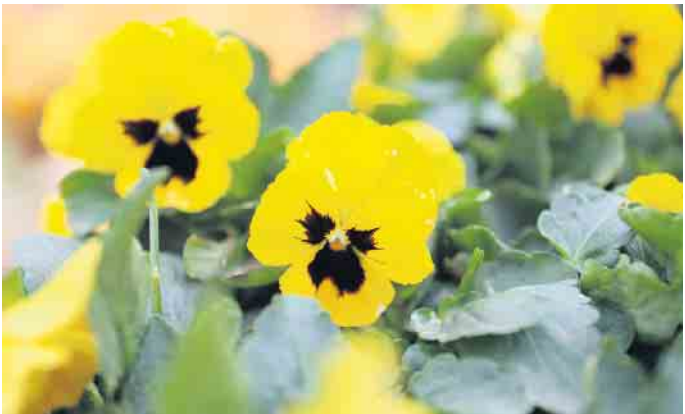
Beliebt wie eh und je: das Stiefmütterchen „Yellow with bloch“ - Gelb mit Auge

Insgesamt geht die Nachfrage nach Stiefmütterchen jedoch zurück. Trotzdem sind die Stiefmütterchen aus Zülpich-Enzen sehr gefragt. „Die Leute schätzen die Robustheit der Pflanzen“, wurde ihnen Jahr für Jahr mehrfach zurückgespiegelt. Highlight in diesem Jahr sind zweifelsohne erneut ein Hornveilchen mit ihren durchgängig dunkel violetten Blüten erinnern beim Anblick direkt an ein außergewöhnliches Farbwunder. Eine Augenweide ist auch die bunte Stiefmütterchen-Mischung. Hier bei dieser Sonderfarbe ist jede Blüte ein Unikat und besticht durch einen besonderen farblichen Verlauf. Bei unserem Besuch in Enzen sind wir von beiden Sorten restlos begeistert. Ab sofort sind die Stiefmütterchen und Hornveilchen auf den Feldern zu bewundern. FH