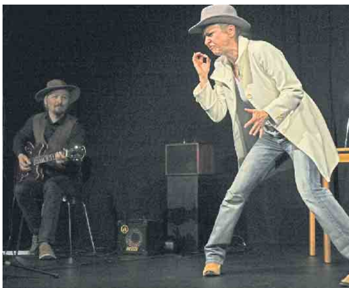
Voller Körpereinsatz mit Gitarrenbegleitung