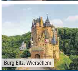
Burg Eltz, Wierschem