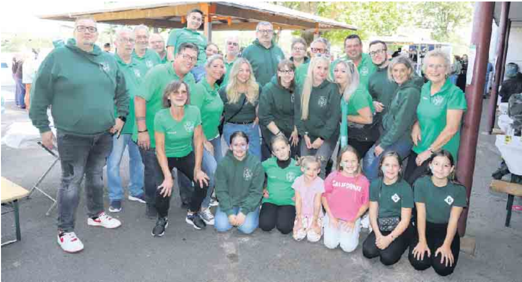
Die Karnevalsgesellschaft Schwerfe blieb Schwerfe 1947 e.V. hatte zu ihrem 13. Reibekuchenfest eingeladen

Als der Geruch nach gebackenen Kartoffelplätzchen, hier im Rheinland auch Rievkooche genannt, durch Schwerfen zog, dann wusste jeder, dass es wieder so weit gewesen ist. Die Karnevalsgesellschaft Schwerfe blieb Schwerfe 1947 e.V. lud zu ihrem bereits 13. Reibekuchenfest ein. Am Sonntag, 15. September, erwartete die Besucherinnen und Besucher auf dem Schulhof der ehemaligen Schule im Ort ein vielfältiges Programm. Natürlich drehte sich an diesem Tag Alles rund um die Kartoffelplätzchen. Los ging es bereits um 11.11 Uhr, wie es sich für eine Karnevalsgesellschaft traditionsgemäß gehört. Zig Mengen an Reibekuchenteig wurde vorbereitet, die Bräter bereitgestellt und die Arbeit wurde belohnt. Von Anfang bis Ende des Festes hörte die Warteschlange für die Reibekuchen nicht auf zu enden. Am Schluss hieß es sogar: „Ausverkauft“. Ein besseres Kompliment kann man nicht erhalten. Für alle (kleinen) Gäste, die nicht so gerne Reibekuchen mochten, gab es heiße Bockwürste und leckere Suppe. Zudem lockte den ganzen Tag über Spiel und Spaß auf der Hüpfburg, das Kinderschminken sowie das Kasperletheater mit der Märchenfee Alisande. Zur