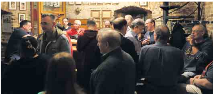
Gardequartier war beim Münstertor Abend wieder Anlaufpunkt für Gemütlichkeit und Zusammensein