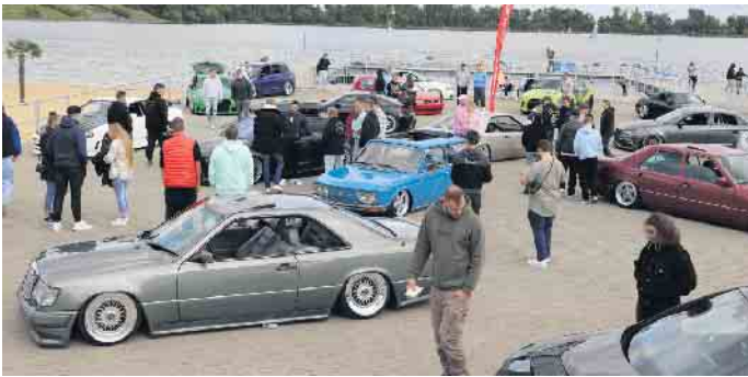
Am Samstag, 14. September, fand im Seepark Zülpich das „Seaground Car Event“ statt

aus der Strandbud genießen. Die Park-Gastronomie bot an diesem Tag ein spezielles Tagesmenü unter anderem mit belegten Brötchen und Rührei an. Wer nach den zahlreichen, tiefergelegten Autos etwas höher hinauswollte, für den war der Kletter- und Seilrutschenparcours Flying Fox geöffnet. Ebenso blieb die Badestelle während der Veranstaltung geöffnet. Das „Seaground Car Event“ wird von der „Forty-Four-Car-Culture UG“ aus Dortmund veranstaltet und zieht jährlich nicht nur Fans der Szene an. Die Besucherinnen und Besucher mussten zum „Seaground Car Event“ kein gesondertes Ticket erwerben, das Event ist im Preis für das Tagesticket zum Seepark Zülpich und für Inhaberinnen und Inhaber einer Dauerkarte kostenfrei. FH