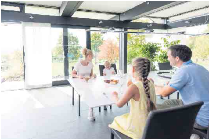
Wohnen mit Durchblick: Glas ist aus der modernen Architektur nicht wegzudenken - auch als Gestaltungsmittel im Innenausbau.

Eine offene, lichtdurchflutete Atmosphäre fördert das Wohlfühlen. Mit Glas wirkt jeder Raum nicht nur heller und freundlicher, sondern wird gleichzeitig optisch vergrößert. Ein Vorteil des Materials: Fachbetriebe können Trennwände, Schiebeelemente oder Treppen ganz nach eigenen Wünschen planen und bauen. Eine Galerie zum Beispiel erhält mit einem Glasgeländer und durchsichtigen Brüstungen ein besonders elegantes Erscheinungsbild. „Transparente Treppen scheinen förmlich im Raum zu schweben. Auch eine gläserne Balustrade stellt einen attraktiven Blickfang dar“, sagt Stefan Wolter, technischer Leiter von Uniglas. Für das notwendige Maß an Sicherheit sorgen dabei Geländer mit einer zuverlässigen Absturzsicherung sowie die Ausführung in bruchsicherem Verbund Sicherheitsglas. Fachbetriebe vor Ort können Inspirationen