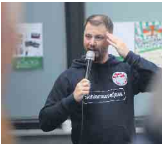
Zur Überraschung aller trat im Laufe des Nachmittages „Ne Jung usem Veedel“ auf

war neben dem Herzhaften natürlich auch mit Kaltgetränken bestens gesorgt. Die Karnevalsgesellschaft Schwerfe blieb Schwerfe 1947 e.V. dankt den vielen Besuchern und befreundeten Gesellschaften sowie Vereinen für den Besuch des 13. Rievkoochefest am Sonntag, 15. September. Weiter geht es in Schwerfen mit der großen Sessionseröffnung mit abwechslungsreichem Programm am Samstag, 9. November. FH