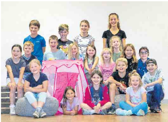
Die 19 der 20 jungen Akteure der Kindergruppe des Theatervereins „Edelweiß“ Nettersheim freuen sich auf ihre Auftritte im Märchenspiel „Die Träne der Elfe“ am Samstag, 12. Oktober, und am Sonntag, 13. Oktober, im Dorfsaal.