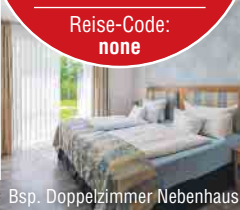
Bsp. Doppelzimmer Nebenhaus