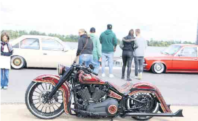
Diese Harley-Davidson stand sehr im Fokus der Besucherinnen und Besucher - ein Prachtexemplar