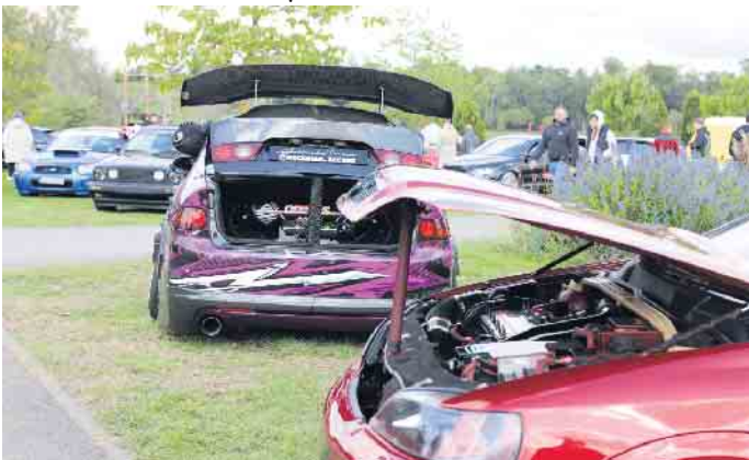
Auch ein Blick in die Autos war an diesem Tag ausdrücklich möglich