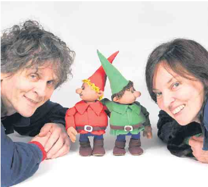
Himpelchen Pimpelchen und ihre beiden „Lehrlinge“.

denkwürdigen alpinen Unternehmens. Hier bringt die Inszenierung vom „theater 1“ Licht ins Dunkel und die Zuschauer können an diesen Erkenntnissen teilhaben. In einer Geschichte mit einfachen, klaren Bildern und zwei liebenswerten Puppen zeigen die beiden Akteure und Figurenspieler dem jungen Publikum, dass Vorsicht und Rücksicht zwei ganz wichtige Elemente für das Miteinander sind. Tickets gibt es an der Tageskasse; Kartenzahlung ist nicht möglich. Es wird empfohlen, unter 02257-4414 oder unter kulturhaus@theater-1.de zu reservieren. Reservierungswünsche, die erst am Tag der Veranstaltung eingehen, können möglicherweise nicht mehr berücksichtigt werden.