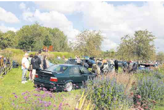
Polierte Felgen und glänzendes Chrom im Seepark Zülpich