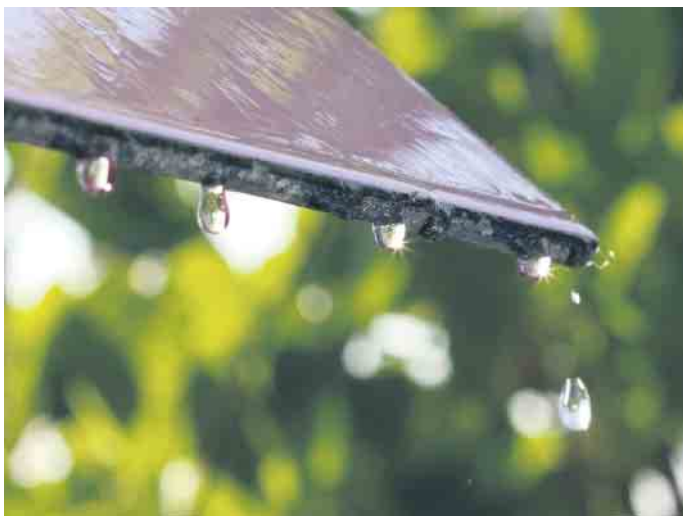
Ein großer Vorteil von Regenwasser ist dessen gute Grundqualität.

stoffen wie beispielsweise Medikamentenrückständen. Dazu schont das extrem weiche Wasser die Verbraucher und eine Enthärtungsanlage wird nicht benötigt. Dezentrale Regenwasserspeicher tragen zudem zum Überflutungsschutz bei. Die einfache Verfügbarkeit von Regenwasser als erneuerbare Ressource ist ein weiterer positiver Aspekt. Darüber hinaus können Kosteneinsparungen durch die Sammlung und Nutzung von Regenwasser erzielt werden. Je nach Gebührenmodell der Gemeinden kann sich eine solche Anlage sogar finanziell amortisieren. „Aufgrund der immer länger anhaltenden Trockenperioden sollten die Regenwasserzisternen allerdings ausreichend groß geplant werden“, rät Ringelstein. (akz-o)