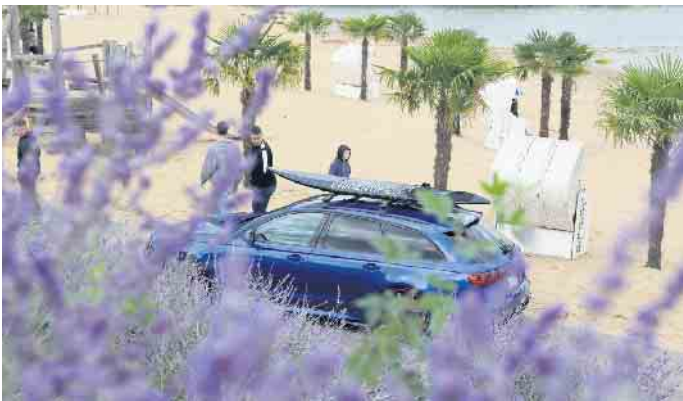
Toller Blickfang im Einklang mit Farbe und Umgebung